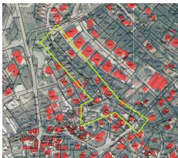
▲ Plan prometnice Križ - Runke

Premanturi koja je već dugo najfrekventnija, ali i najopasnija dionica na području naše općine zbog čestih prometnih nesreća pješaka i biciklista tijekom ljetnih mjeseci. Vrijednost radova iznosi 524.491,60 EUR, a grade se faze projekta 4, 5, 6 i 7. U budućnosti se pla-