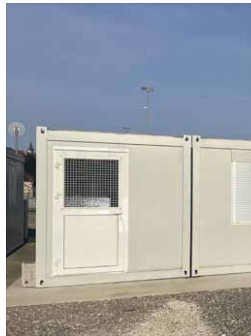
► Novi kontejneri za potrebe klubova Štraminjoni Medulin