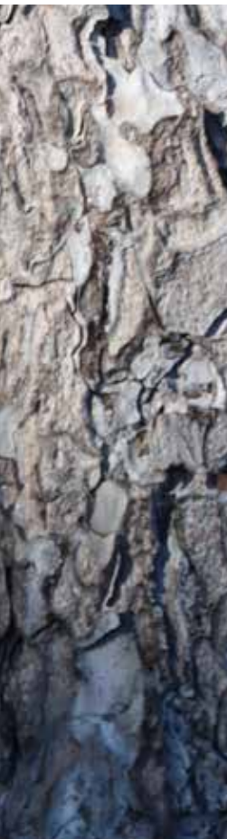
◀ Pošumljavanje park-šume Kašteja

posadili smo 20 novih sadnica pinije i hrasta crnike.