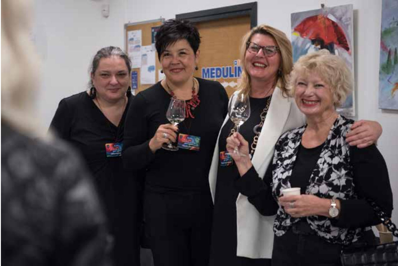
◀ Sudionice panela „Žene – od A do Ž: od ambicije do života kakvog želimo”