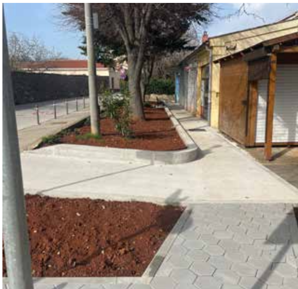
▲ Uređenje okoliša ambulate u Premanturi