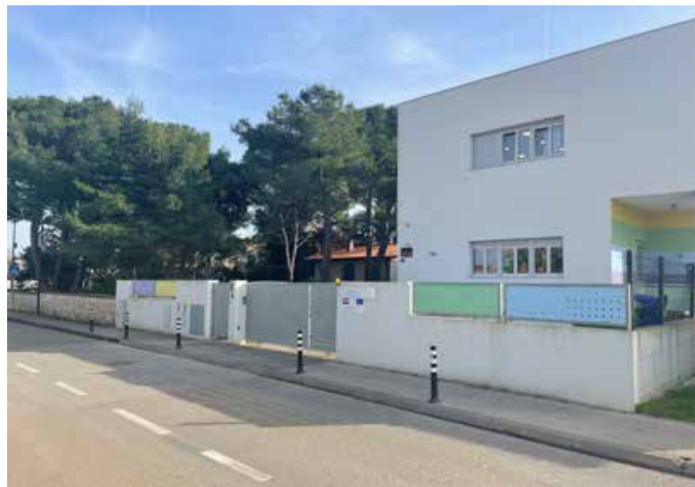
▲ Postavljeni prometni stupići ispred DV Pomer