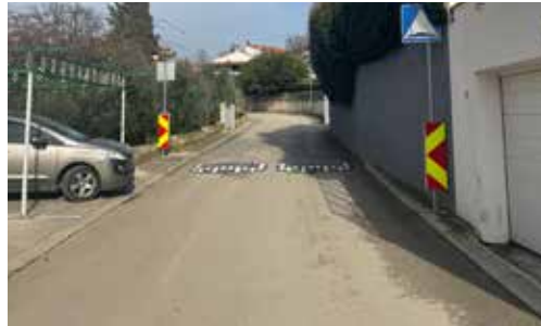
▲ Zamjena umjetnih izbočina u Vinkuranu