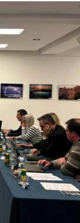
▲ Sjednica Općinskog vijeća Općine Medulin

prometnica u Medulinu – Ulica Sad, za što se planira 90.000,00 EUR, nastaviti će se radovi na vertikalni Burle, započet će radovi na prometnici Mukalba – jug, dok se za prometnice i parkirališta u Pješčanoj Uvali planira izdvojiti 106.000,00 EUR, za Premanturu 35.000,00 EUR i za Pomer 30.000,00 EUR.