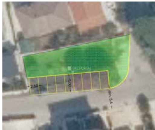
▲ Tehničko rješenje uređenja parkirališta u 3. ogranku

Na zahtjev općine Medulin izrađeno je tehničko rješenje uređenja parkirališta na k. č. 4788/1 k. o. Pula. Realizirala se izvedba osam parkirnih mjesta i jednog parkirnog mjesta za invalide, a parkiralište je organizirano okomito u odnosu