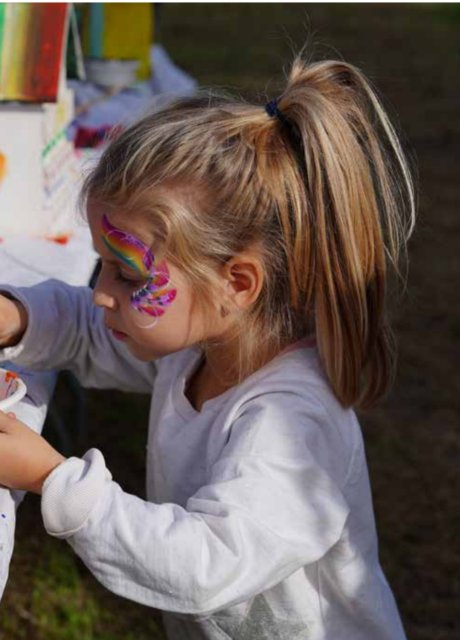
◀ Najmlađi su na radionicama oslikavali kućice za ptice koje će biti postavljene na stabla oko lokve, (Foto: F. Frgačić)

Pula sudjelovali su u seriji kreativnih radionica u centru Šantadur u Medulinu. Kroz dvije radionice osmislili su te nacrtali dizajn bedževa, a kroz druge dvije radionice upoznali su se s tehnikom linoreza u kojoj su izradili motive bilja, životinja i same lokve te ih potom otisnuli u najrazličitijim kompozicijama i bojama na platnene torbe. Bedževi su po dizajnu učenika i izrađeni, a s oslikanim su torbama postali jedinstven handmade promotivni materijali projekta. Središnja aktivnosti projekta bila je druga volonterska akcija sadnje uz Medulinsku lokvu koja je predivne, gotovo ljetne subote, 18. studenoga 2023., okupila više od dvije stotine sudionika: