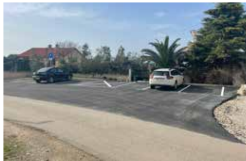
▲ Parkiralište Debeli Vrv u Vinkuranu