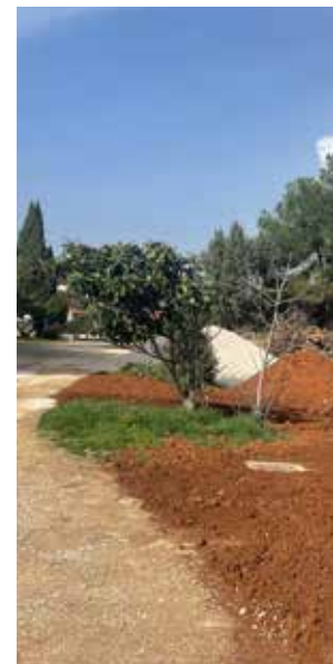
▲ izgradnja kanalizacije u Premanturi