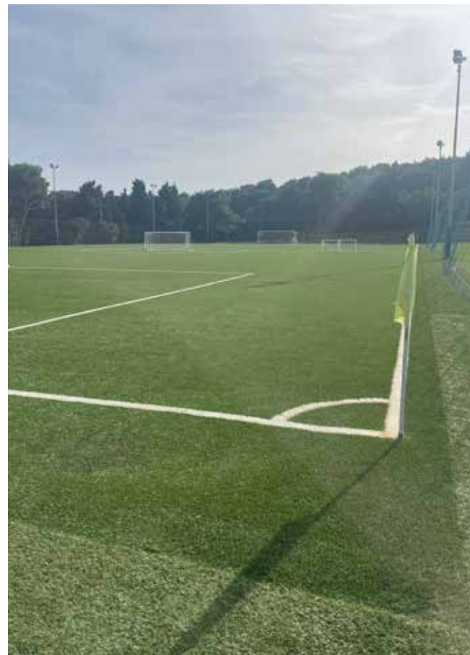
▲ Pomoćni teren NK Banjole