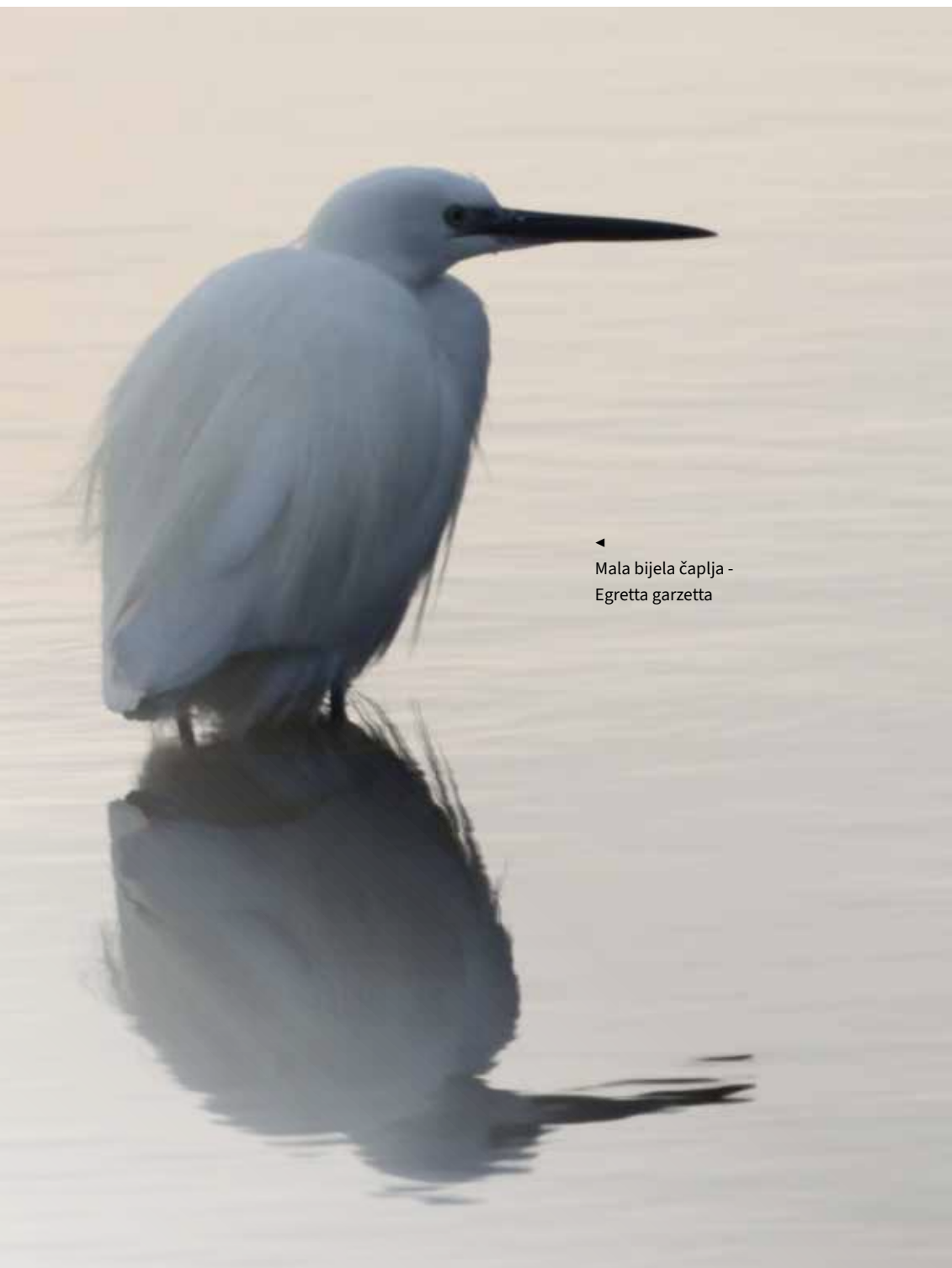
◀ Mala bijela čaplja - Egretta garzetta

Migracije ptica najčešće se odnose na kretnje ptica između područja gniježđenja i područja na kojima provode vrijeme nakon gniježđenja. Lastavica, jedna od najpoznatijih selica, od ožujka do svibnja seli iz Afrike prema Europi. Naše krajeve počinje napuštati u kolovozu, nakon gniježđenja, i tada kreće na jug, u svoja zimovališta. Upravo je seljenje ptica na jug, u toplije krajeve, jedan od najpoznatijih obrazaca seljenja životinja za koji znamo još od djetinjstva. No, što kada biste čuli da taj „jug“ nije nužno u Africi, već da su i naši krajevi nekim vrstama „topliji krajevi“.