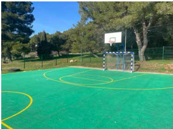
▲ Sportsko igralište u Pomeru