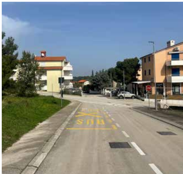
▲ Novouređeno autobusno stajalište u Premanturi