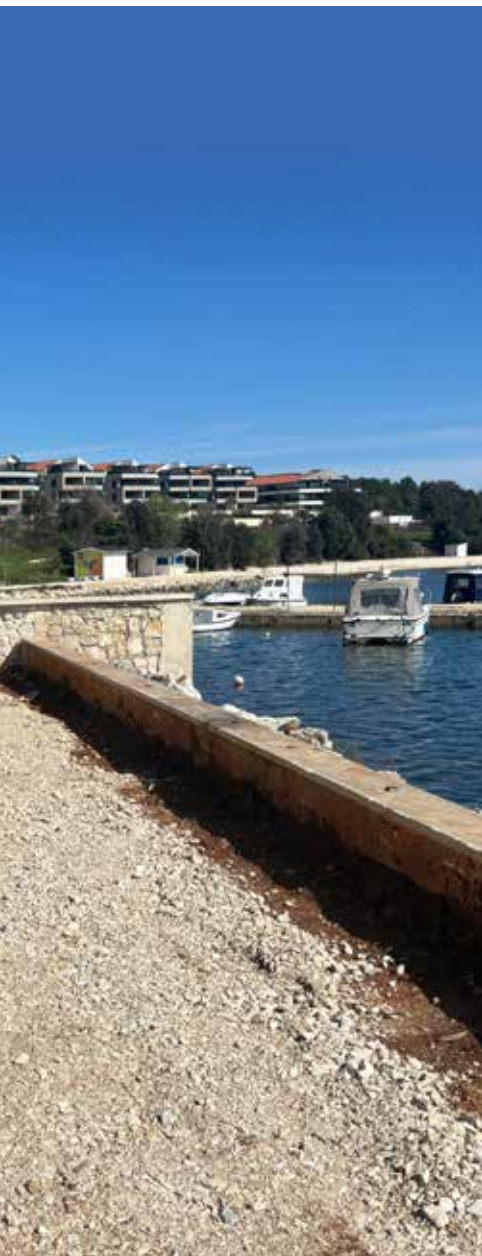
▲ Probijanje puta kod hotela Del Mar u Banjolama