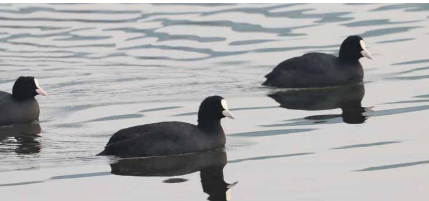
◀ Liska - Fulica atra