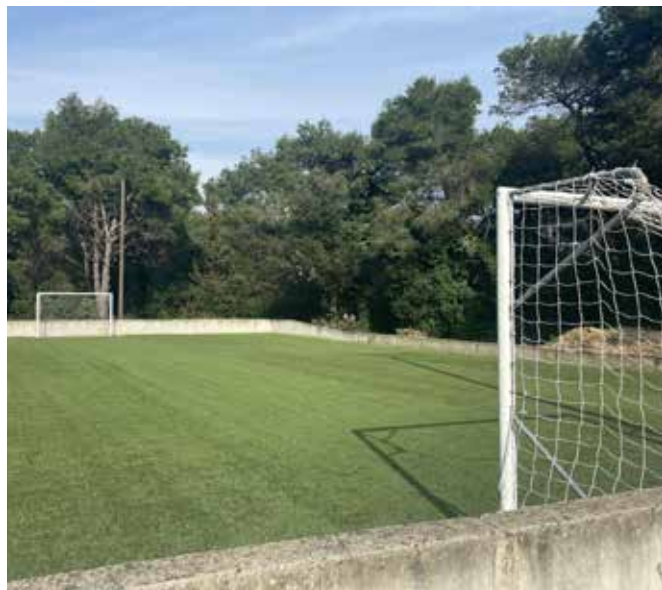
◀ Novo igralište - Sportski centar Banjole

U pripremi je izvođenje radova na izgradnji biciklističke staze i uređenje dijela nogostupa u križanju ukupne duljine od 479 metara. Također, Ministarstvu poljoprivrede poslana je cjelokupna dokumentacija potrebna za rješavanje imovinsko-pravnih poslova. Procijenjena vrijednost radova iznosi 257.061,00 EUR.