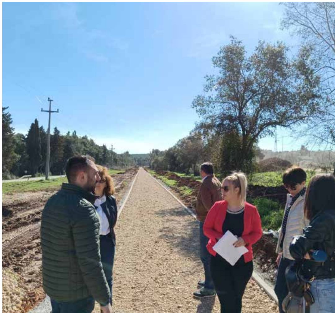
▲ izgradnja biciklističke staze Kamik - Šćuza

Radovi na biciklističkoj stazi Volme – Šćuza započeli su u siječnju 2024. i trajat će tri mjeseca. Riječ je o dugoočekivanim radovima na izgradnji biciklističke trase na dionici ceste prema