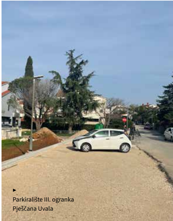
► Parkiralište III. ogranka Pješćana Uvala

U naselju Vintijan uređeno je dječje igralište, a radovi u vrijednosti od