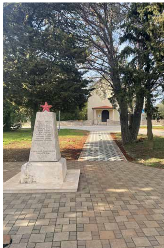
▲ Novo popločenje spomenika u Banjolama