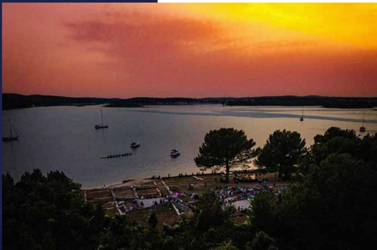
▲ Sumrak na vižuli