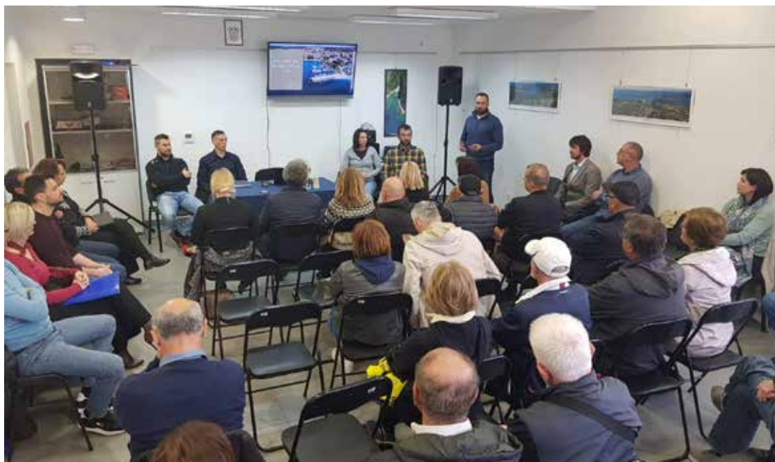
◀ Zbor mještana Pješćane Uvale