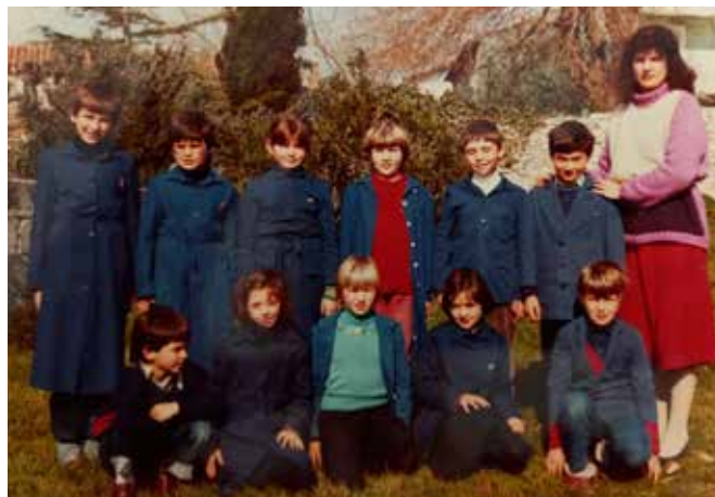
▲ Prva generacija Područne škole Ližnjan