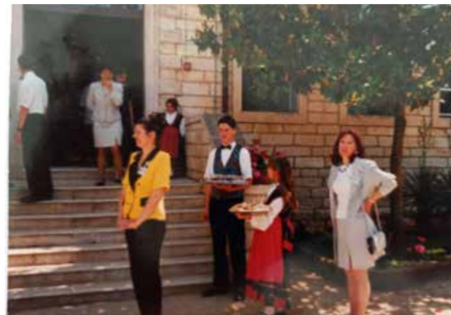
▲ Adaptacija stare zgrade škole