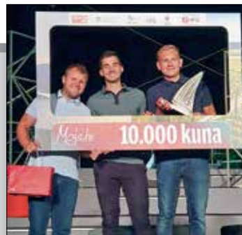
Medulinci osvojili drugo mjesto u projektu MOJA.HR! str. 15