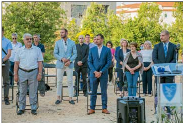
Svečana sjednica Općinskog vijeća na Arheološkom parku Vižula započela je izvođenjem himni Republike Hrvatske i Istarske županije

Za harmoničan odnos sakralnog i svjetovnog segmenta zajednice plaketu su dobi-