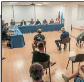
U 3mc-u održan sastanak s ugostiteljima i trgovcima str. 13