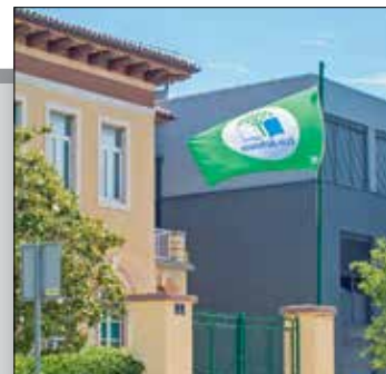
Zelena zastava Eko-škole i u školi dr. Mate Demarina str. 8