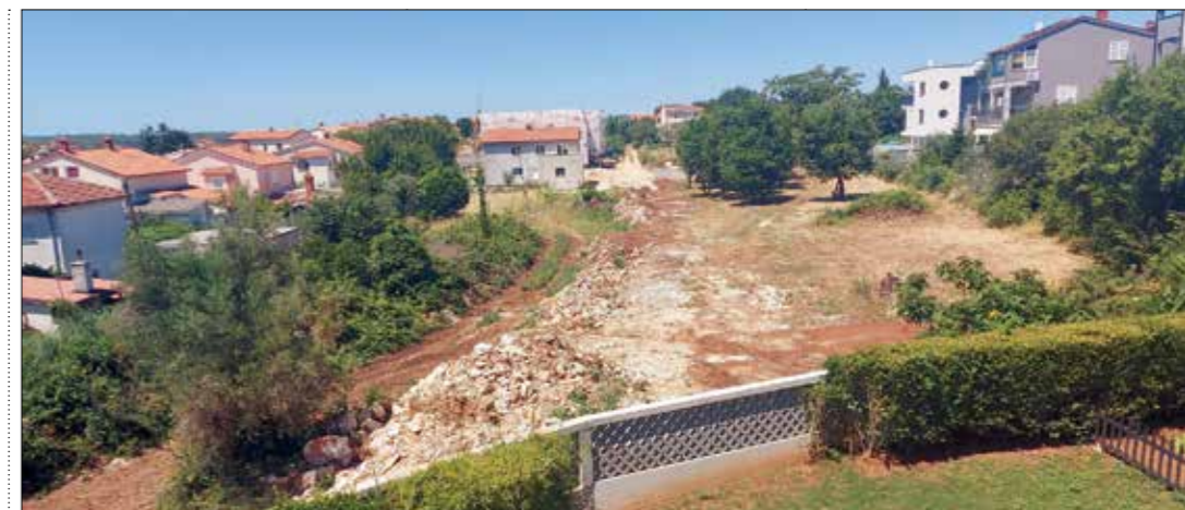
Burle kanal FK-2