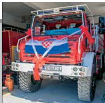
DVD Medulin dobilo novo vatrogasno vozilo str. 32