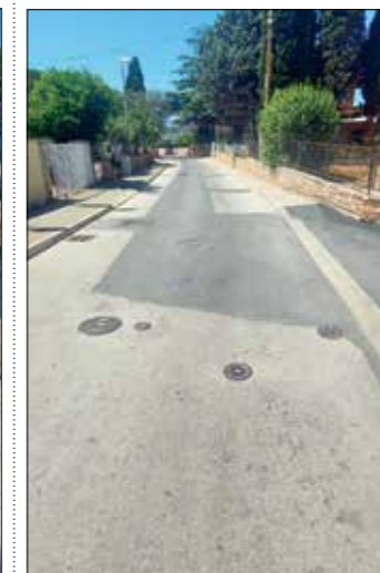
Medulin - spoj na ulicu SAD