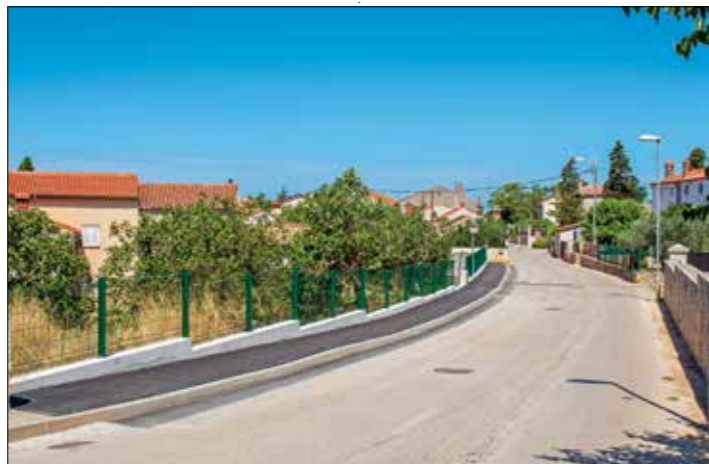
U Vinkuranu je izgrađena nova pješačka staza u dužini od 90 metara

U Pješčanoj Uvali zatekli su tako radnike pulske Ceste koji su dovršavali ocrtaivanje horizontalne signalizacije, čime se privode kraju radovi na obnovi asfaltnih površina u IX. ogranku, kojima se pristupilo zbog derutnog stanja asfalta i brojnih prekopa. Pulska Cesta d.o.o. obnovila je uku-