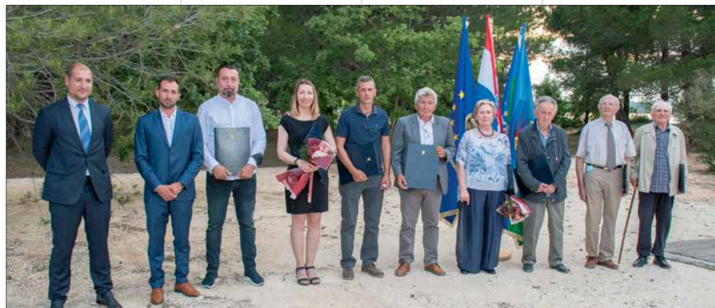
Nakon scenske igre uslijedilo je uručivanje svečanih povelja Općine Medulin za 2021. godinu