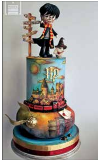
Najbolji rad inspiriran knjigama

Zbog panemije, ali i usprkos njoj godinu smo započeli izložbom u izlogu – ugostila nas je pozamantarija u Veronskoj ulici u Puli. Loreta Rovis izložila je svoje heklane radove od pamučnih trakica – zanimljive torbice i raznolike košare. Usljedila je zajednička izložba članica primijenjene sekcije. Svaka na svoj način izrazila se na temu fotografije, a prigodno nas je ugostio Foto studio Flash u Zagrebačkoj ulici u Puli. Treća izložba te vrste bila je ona slikarske sekcije u središnjoj poslovnicu OTP banke također u Puli.