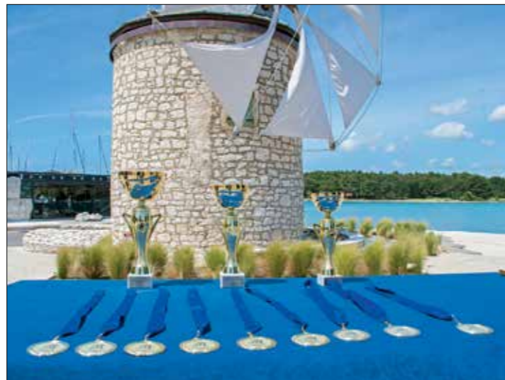
Udruga Ulika za prve tri nagrade osigurala je pehare. Svim ostalim sudionicima ovogodišnje Smotre diplome su dostavljene poštom

Edo Družetić, voditelj proizvodnje u uljari Vodnjan, Agroprodukt, rekao nam je kako se rad i trud uvijek isplati. Cijeli život je u ovom poslu pa može reći i da se tijekom godina puno toga promijenilo. Zbog klimatskih promjena berba se pomaknula za čak dva