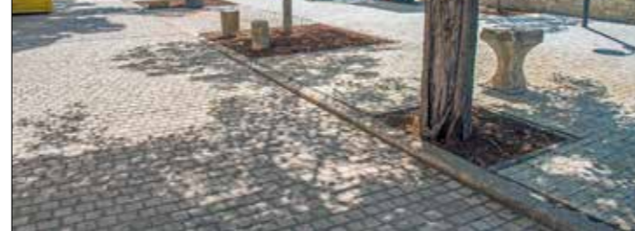
Na trgu u Premanturi popločena je površina na kojoj se ranije nalazilo bočalište

rekonstrukcija i dogradnja postojeće vodovodne mreže te izgradnja javne rasvjete. Zbog konfiguracije terena, i ovu rekonstrukciju prati gradnja potpornog zida. Radove izvodi tvrtka Iza duge d.o.o., a vrijedni su 549.000,00 kuna.