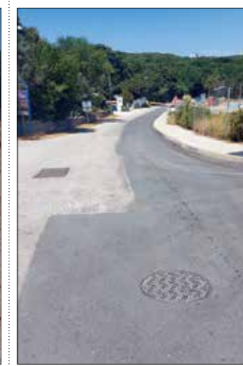
Vinkuran - kod novog SC-a

SANITARNA I OBORINSKA ODVODNJA DIJELA NASELJA MEDULIN – ULICA KATIKULIĆ