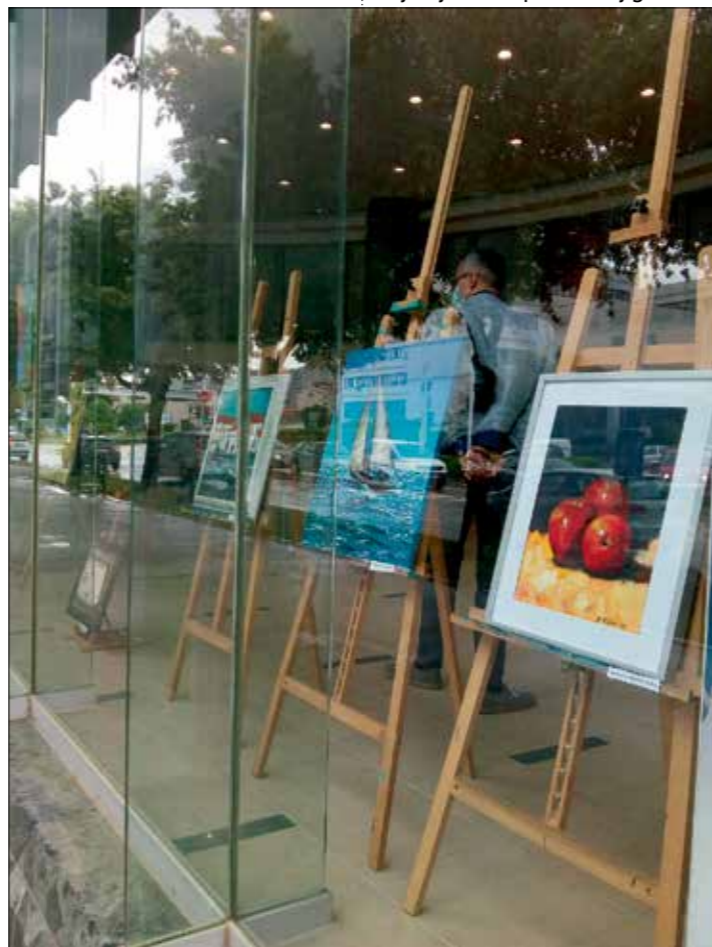
Izložba u izlogu OTP banka