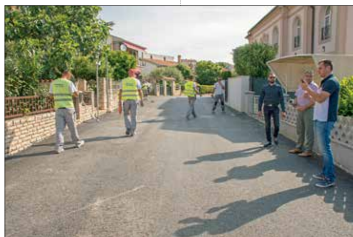
U Pješčanoj Uvali su završeni radovi na obnovi asfaltnih površina u IX. ogranku