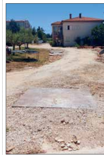
Medulin - spoj na ulicu SAD