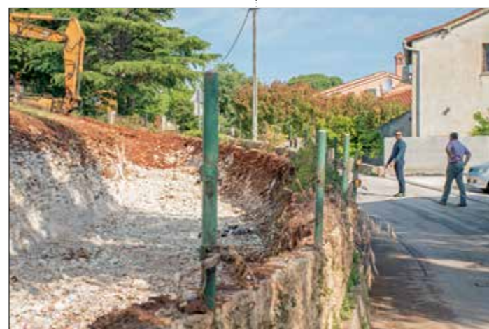
U Vintijanu je u tijeku rekonstrukcija raskršća na ulazu u naselje