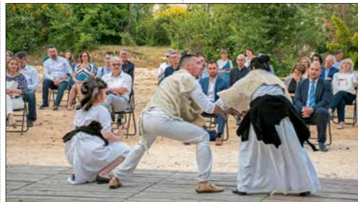
Istra Inspirat je scenskom igrom „Koraci kroz vrijeme“ – šetnjom u šest koraka, proveo prisutne povijesnim razdobljima