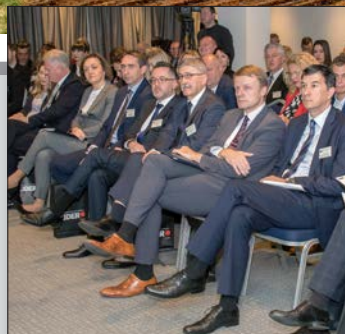
3. konferencija Greenfield investicije str. 6-7