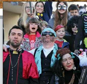
Maškare Banjola, Pomera, Medulina i Premanture str. 20-21