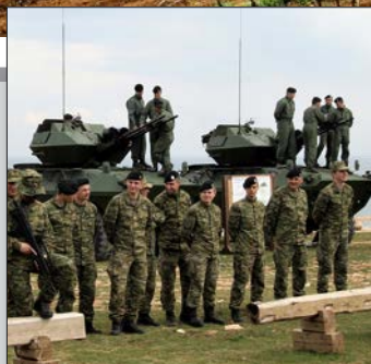
Vojna vježba Štit 19 str. 12-13