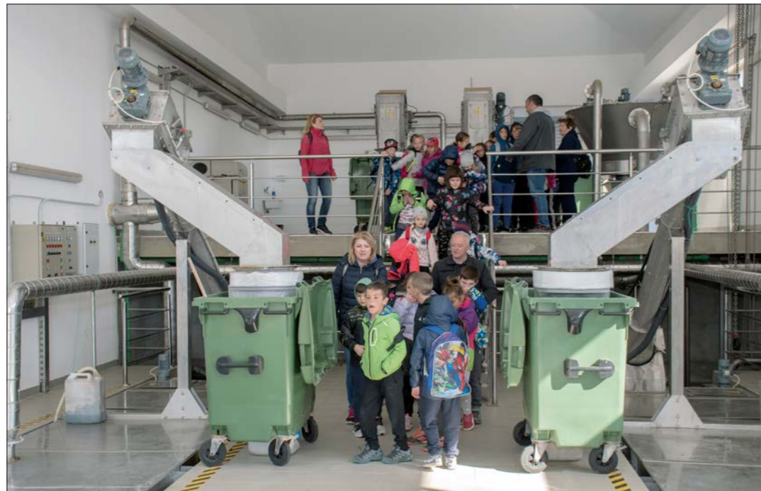
Edukacijski posjet školaraca UPOV-u Marlera

Početkom ove godine nastavili su se radovi izgradnje fekalne kanalizacije po pojedinih aglomeracijama kako slijedi: