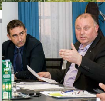
Fiksni dio javne usluge prikupljanja otpada snižava se za 10% str. 5