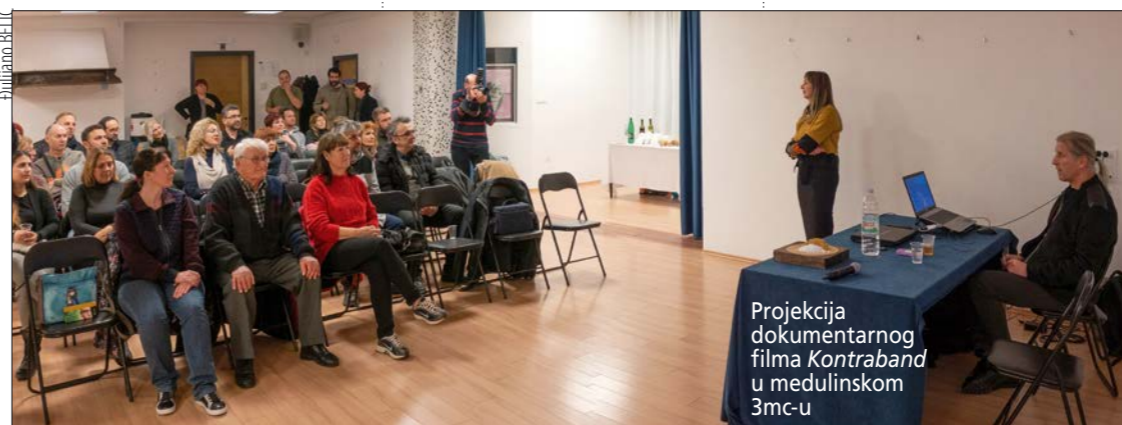
Projekcija dokumentarnog filma Kontraband u medulinskom 3mc-u