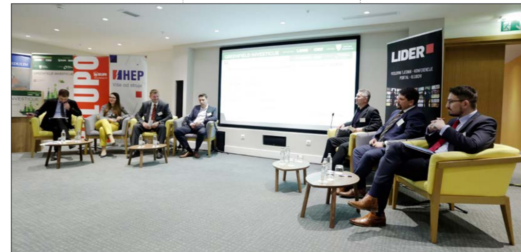
Tijekom dva dana održana su brojna predavanja i nekoliko panel-diskusija