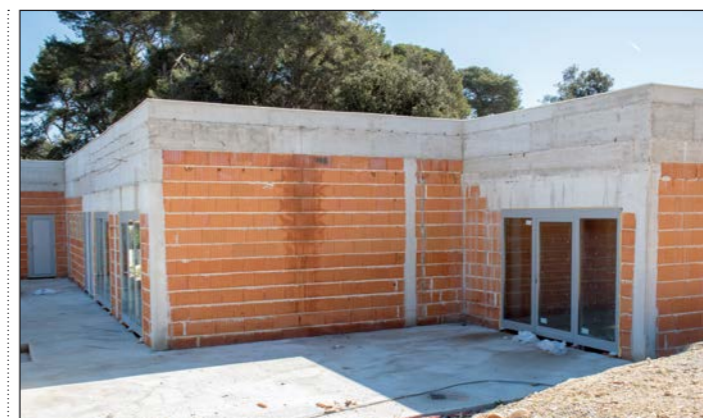
SC Vinkuran – dobava i ugradnja vanjske ALU stolarije

Uređenje prostora Medulin FM-a na adresi Centar 58 u naselju Medulin. Uključena je izrada kompletne elektroinstalacije, telefonske i računalne instalacije, zamjena stolarije PVC stolarijom, oblaganje zidova i stropa gips-kartonskim pločama, zamjena završne podne obloge, soboslikarski radovi. Izvođači radova su Regi Elektrik d. o. o., Sinel d. o. o., obrt EA i Pinjola Istra d. o. o., vrijednost radova s PDV-