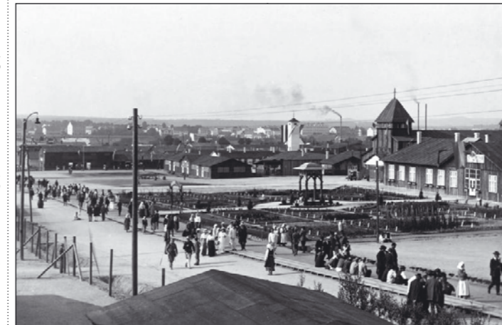
Gmünd 1916.-1917.