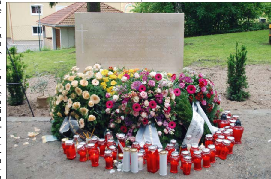
Spomen ploča za stradale Istrane postavljena je u Gmündu 2014. godine

Istre. U Medulin se na svoja ognjišta nisu vratila 162 žitelja-izbjeglice i 14 vojnika, u Valde-