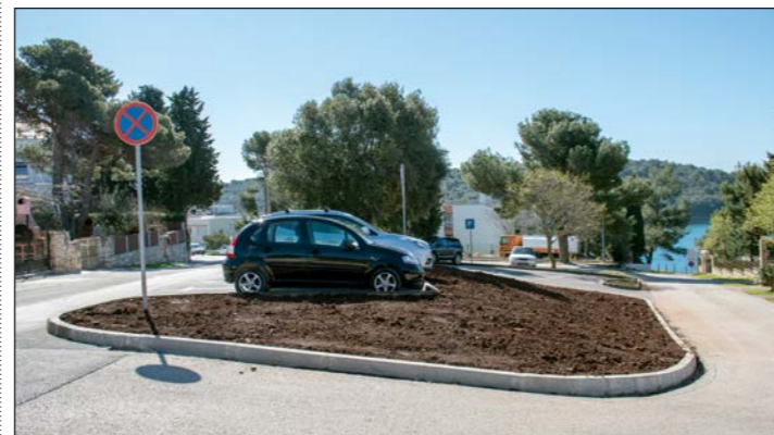
Sustav navodnjavanja zelenog pojasa uz parkiralište na lokaciji Indije u naselju Banjole