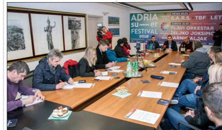
Najavu nadolazećeg Adria Summer Festivala popratilo je velik broj medija

Marko PERCAN Snimio Mario ROSANDA Medulinska rivijera d.o.o.