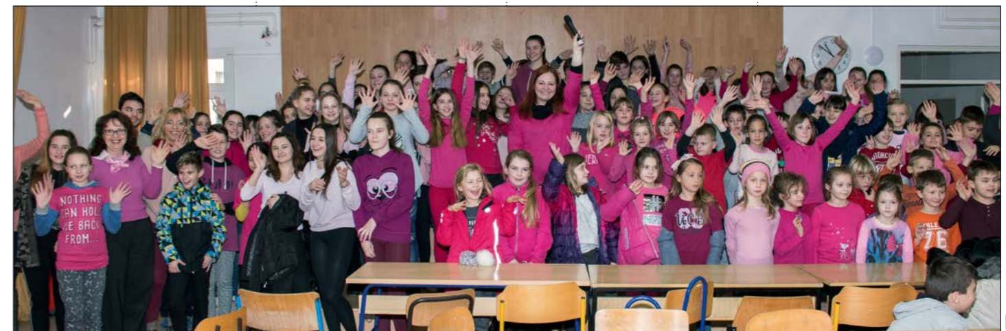
Učenici i nastavnici osnovne škole Dr. Mate Demarina u Medulinu

Medulinska rivijera d.o.o.