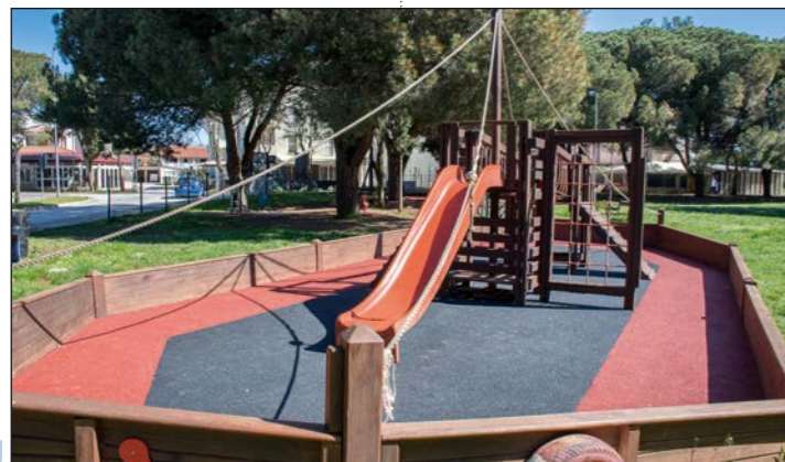
Gumena podloga za igrala na dječjem igralištu Osipovica u Medulinu

Ervin BIČIĆ OPĆINA MEDULIN Snimio Mario ROSANDA Medulinska rivijera d.o.o.