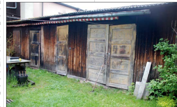
Ostaci logorskih baraka u Gmündu vidljivi su i danas

bek 9, u Cave romane pet, a u Vintijan 16 civila, u Vinkuran 18 civila i jedan vojnik, u Ba-