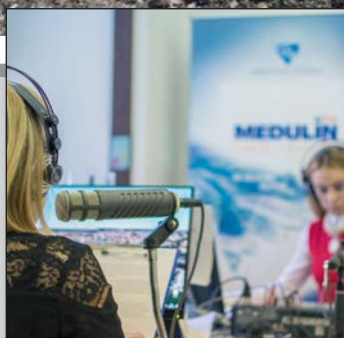
Nova radijska stanica – Medulin FM