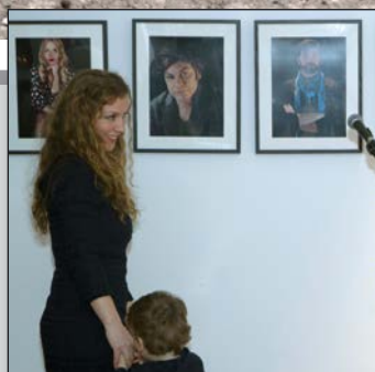
Umjetnici za Sigurnu kuću Istra