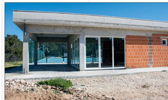
SC Premantura – dobava i ugradnja vanjske PVC stolarije

Građevinsko-obrtnički radovi na uređenju prolaza između IX. i VI. ogranaka u naselju Pješćana Uvala, k. č. br. 4750/33 k. o. Pula. Radovi obuhvaćaju pripremne, ze-