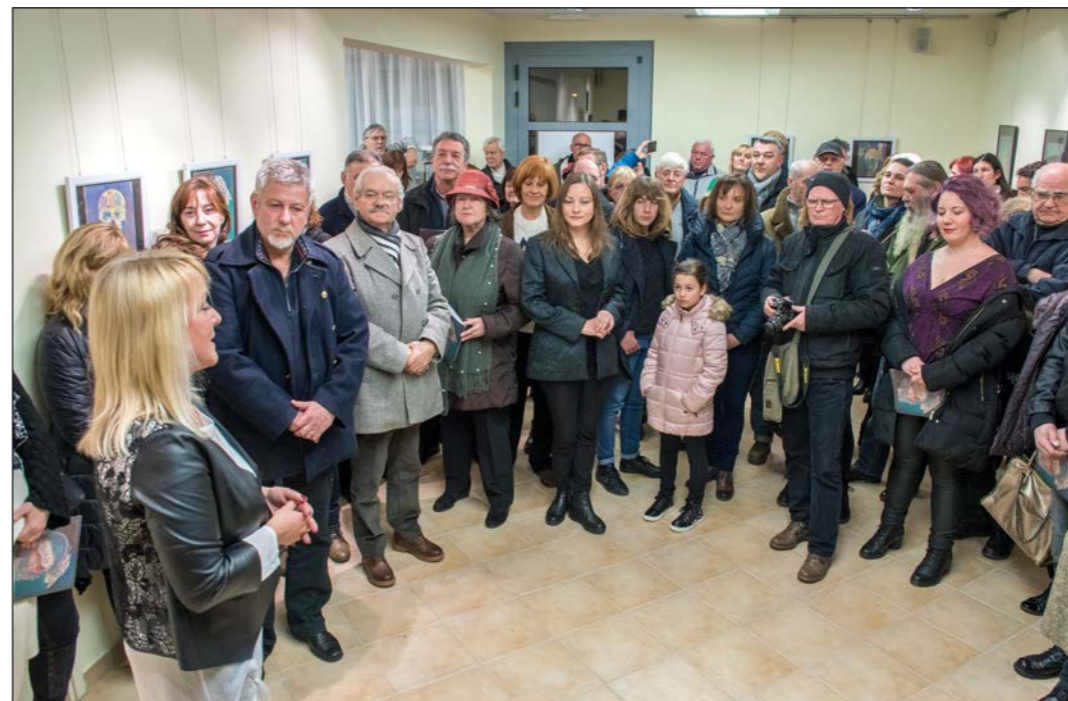
Otvorenje izložbe pred mnogobrojnom publikom, Bizjakovim prijateljima i članovima obitelji

Čovjek i stvaratelj koji je srcem živio i ljubio umjetnost