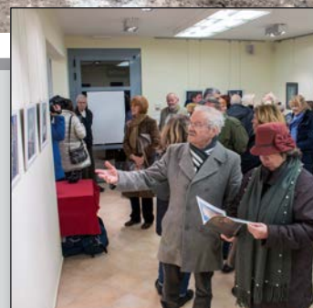
BIZJAK – slikar realnosti i mašte