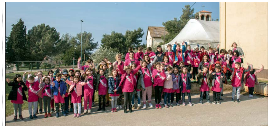
Učenici i nastavnici područne škole u Banjolama s majicama koje su im podijelili predstavnici Općine Medulin

U svakom razredu posebno su pohvaljene najoriginalnije poruke.