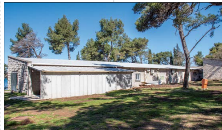
Sanacija i rekonstrukcija krovista zgrade Veslačkog kluba Medulin