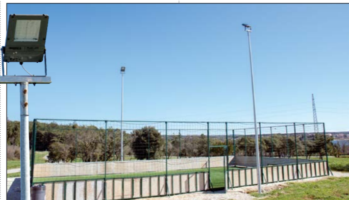
Izgradnja rasvjete igrališta u naselju Volme

rasvjetna stupa visine 6 m s LED rasvjetnim armaturama. Izvođač radova je Regi Elektrik d. o. o. Medulin, vrijednost radova s PDV-om iznosi 86.000,00 kn. Radovi su u tijeku.