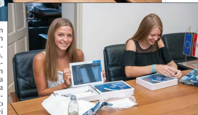
Svaka je učenica na poklon dobila tablet i ručnik

s prosjekom od 5,0 u svih osam godina školovanja, one su uspješne i u drugim područjima pa se tako svaka od njih u svoje slobodno vrijeme bavi raznim sportovima i aktivnostima. Tako su učenice uspješne u odbojci, triatlonu, glumi, glazbenoj školi i plesu. Sve učenice upisale su Gimnaziju u Puli (opća, matematička), a pročelnica Suzana Racan Stern naglasila je da Općina Medulin surađuje s Gimnazi-