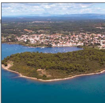
Započeo projekt „ARHEOLOŠKI PARK VIŽULA“ str. 2-3