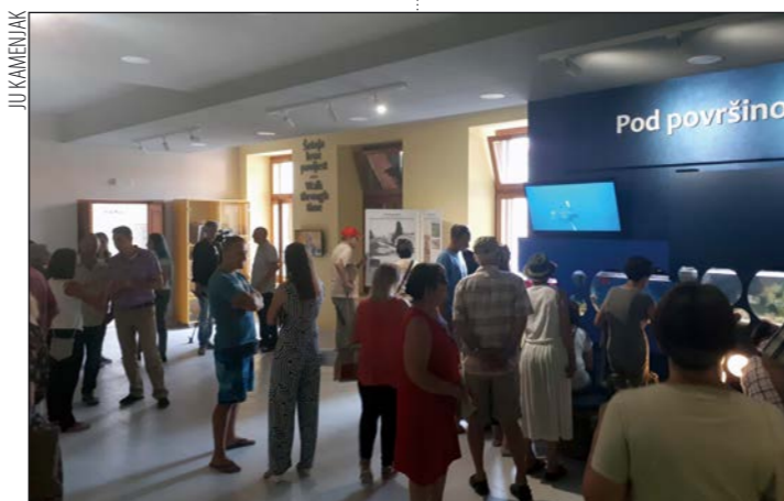
Svečano otvorenje „Kuća prirode“ u Premanturi