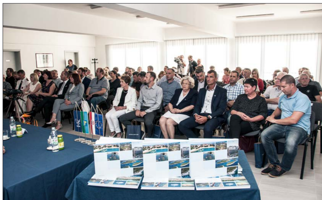
Svečana sjednica Općinskog vijeća Općine Medulin i promocija monografije o povijesti turizma Općine Medulin „Turizam medulinske rivijere“

Povodom ovogodišnjeg Dana Općine Medulin, koji je obilježen 12. lipnja, Općina Medulin je, u suradnji s ustanovama i udrugama sa svog područja, pripremila bogat i raznolik osmodnevni program te glazbena, zabavna, kulturna i poučna događanja u naseljima općine