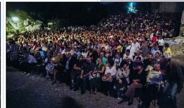
U prekrasnom ambijentu vinkuranskog kamenoloma Cave Romane Carminu Buranu poslušalo je čak 1.300 posjetitelja