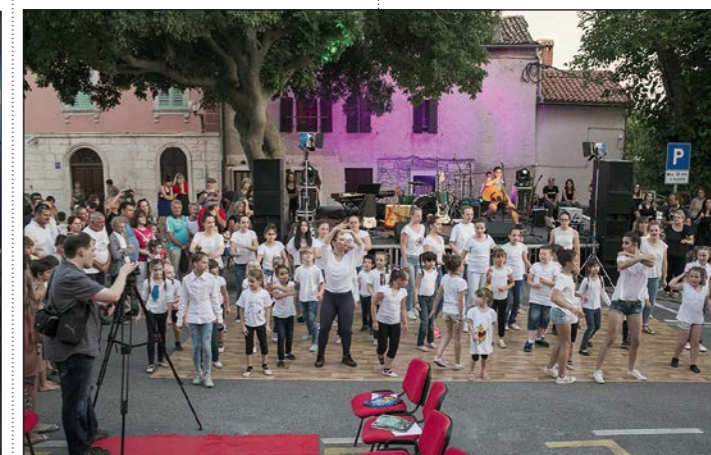
Mali plesači i plesačice Plesnog studija Pirueta