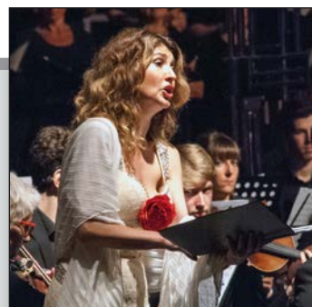
Carmina Burana u vinkuranskom kamenolomu str. 16-17