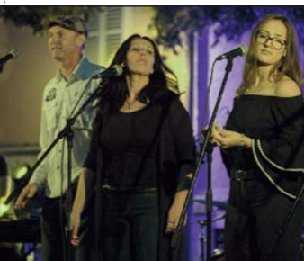
Koncert grupe Sakramenski

Dan kasnije, 17. lipnja, na medulinskoj rivi održana je gastronomska manifestacija i natjecanje u pripremanju jela od gljiva „Gljivarijada 2017.“ u organizaciji Udruge Sunčanica. Slavljenički krug po naseljima općine, bogat događanjima, zatvoren je 21. lipnja u Premanturi kada je svečano otvorena posebno vrijedna atrakcija za domaće i strane posjetitelje