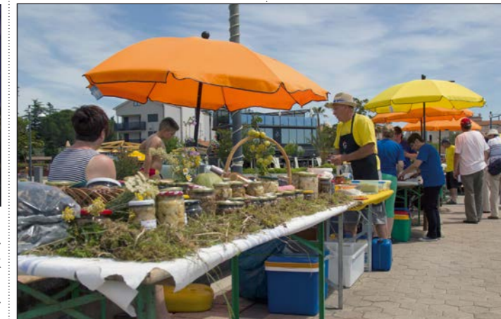
Na medulinskoj rivi održana je gastronomska manifestacija i natjecanje u pripremanju jela od gljiva „Gljivarijada 2017.“