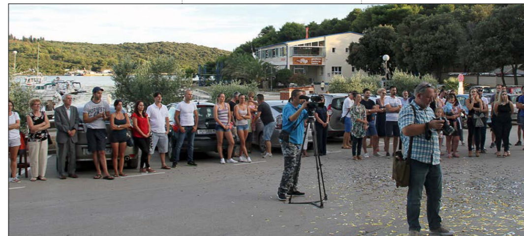
... te brojni mještani općine Medulin, prijatelji i obitelj