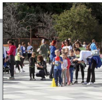
Manifestacije „Obiteljski dan 2017.“ i „Od mora do stola“ str. 12-13