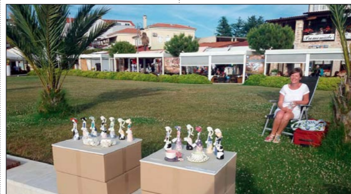
Vinkuran 3D fest na medulinskoj rivi