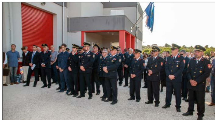
Svečanosti su prisustvovali mnogobrojni gosti i uzvanici

mnogobrojnih gostiju čija je destinacija područje općine Medulin. Vrijedi istaknuti kako je u svega