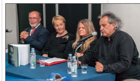
U Društvenom domu u Banjolama na koncu večeri predstavljena je knjiga Jelene Lužine „Marija Crnobori – eseji o fragmentima“

Ispred njezine rodne kuće na Dračicama u Banjolama postavljena je spomen-ploča, a pred Društvenim domom Banjole, odnosno Zavičajne galerije Crnobori, bista velike glumice ● U galeriji posjetitelji mogu razgledati spomen-sobu posvećenu upravo Mariji Crnobori, a predstavljena je i knjiga „Marija Crnobori – eseji o fragmentima“