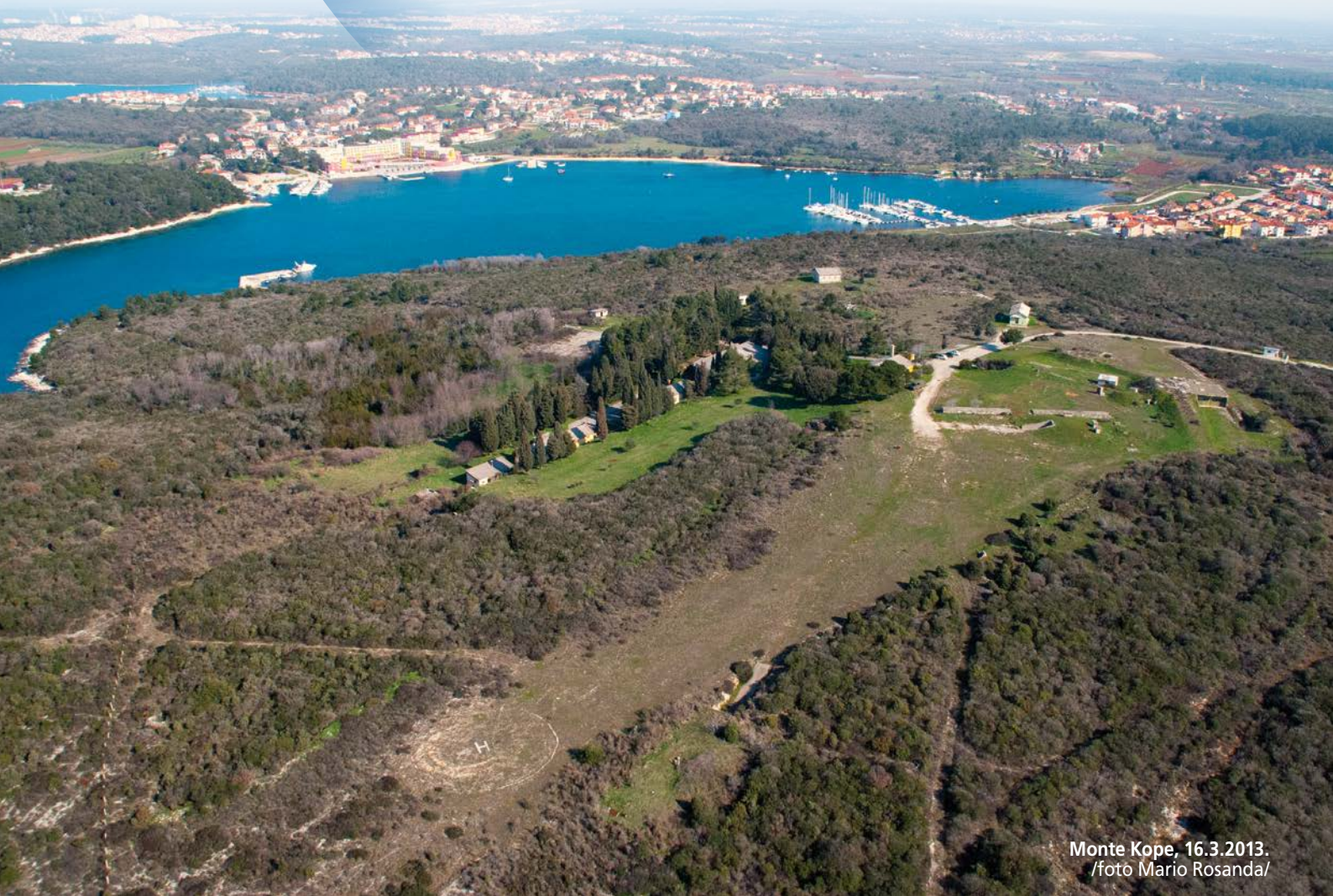
Monte Kope, 16.3.2013.