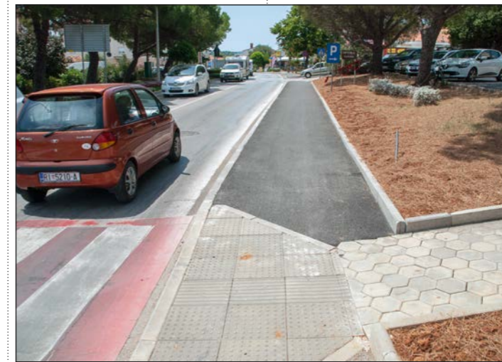
Uređenje pješačke staze na lokaciji Munida u naselju Medulin