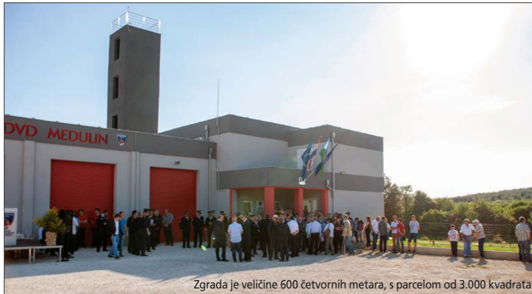
Zgrada je veličine 600 četvornih metara, s parcelom od 3.000 kvadrata