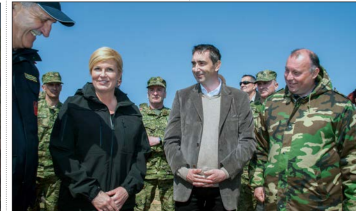
Predsjednica se zahvalila načelniku i suradnicima na gostoprimstvu