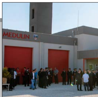
OSTVAREN DAVNI SAN - otvoren hram vatrogastva str. 12-13