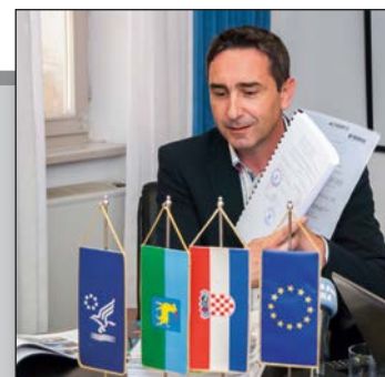
16 milijuna kuna za projekt ARHEOLOŠKI PARK VIŽULA str. 18