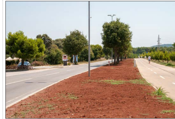
Navodnjavanje buduće zelene površine od Kamika do Oš Banjole