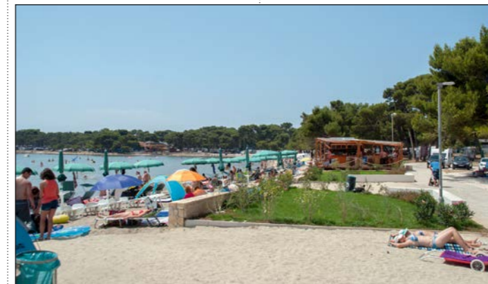
Uređenje plaže Bijeca u Medulinu

va iznosi 621.477,50 kn. Izvođač radova je Vintijan d.o.o. Pripremni i zemljani radovi na čišćenju i pripremi terena – uklanjanje konstrukcije tuševa i postojećih kameno-betonskih zidova, uklanjanje i premještanje postojećih komunalnih instalacija, uklanjanje po-