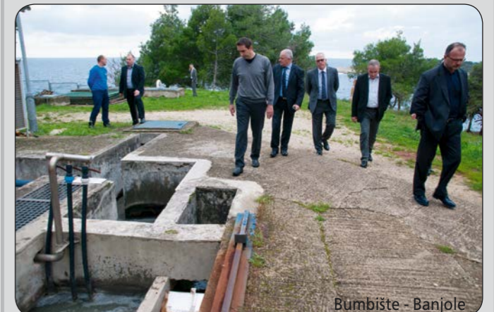
Bumbište - Banjole