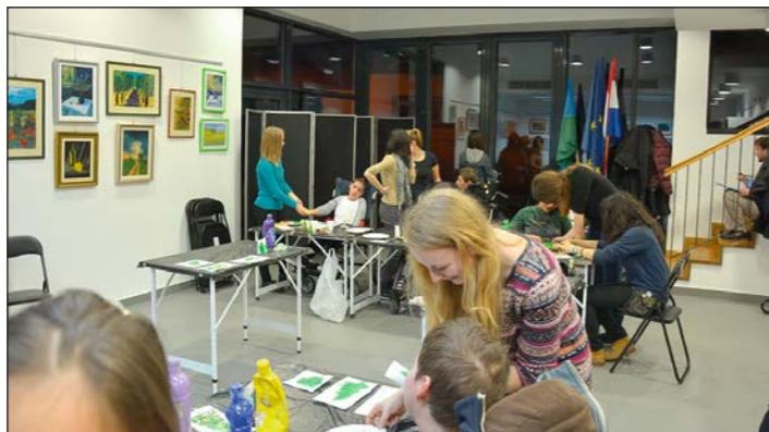
Izrada radova za humanitarno-prodajnu izložbu članova Udruge cerebralne paralize Istarske županije i Kreativne akademije