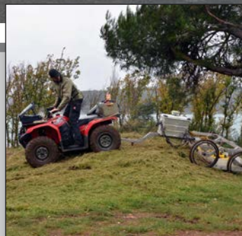
Jedinstveni arheološki stroj na Vižuli str. 8-9