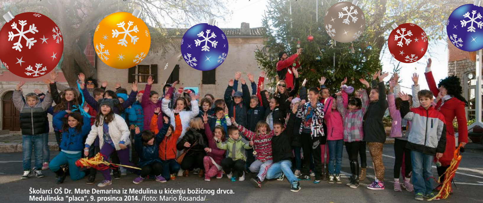
Školanci OŠ Dr. Mate Demarina iz Medulina u kićenju božićnog drvca. Medulinska "placa", 9. prosinca 2014.