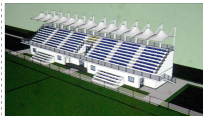
Trodimenzijski prikaz budućih tribina s 500 mjesta za gledatelje

ciljeva i izvora prihoda budućeg sportskog centra kao što su preseljenje svjetskog malonogometnog udruženja WMA (World MiniFootball Association) na prostor Sportskog centra Banjole, osnivanje nogometne Akademije i suradnja s velikim europskim nogomet-