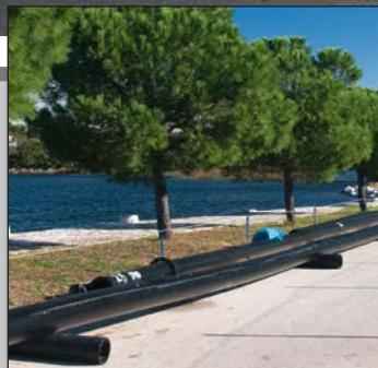
50 milijuna kuna u kanalizaciju str. 4-5