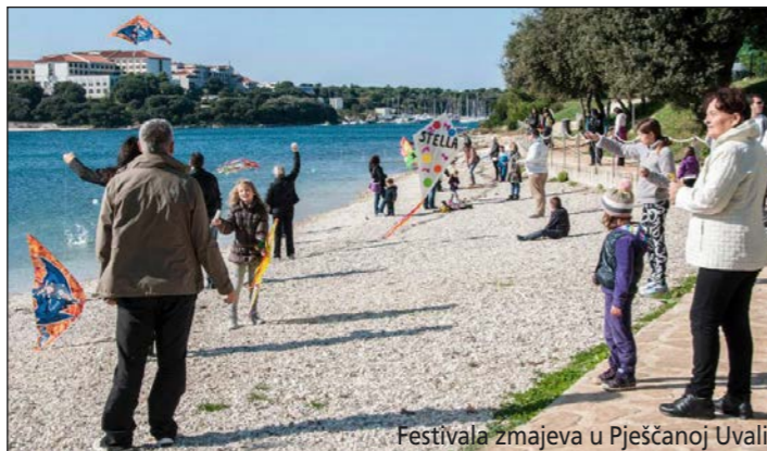
Festivala zmajeva u Pješčanoj Uvali

Pješčana Uvala koja je u ovoj godini kulminirala u prosincu radionicom s Udrugom cerebralne paralize Istarske županije i humanitarnom aukcijom slika za njih u koju se uključila i Općina Medulin.