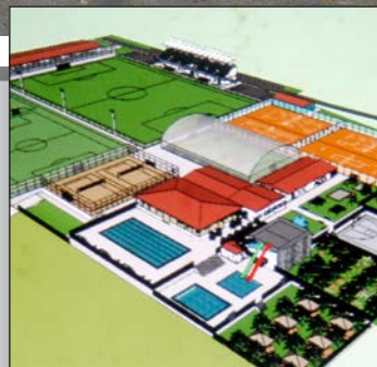
Banjole: Sportski centar od 27 milijuna kuna str. 12-13