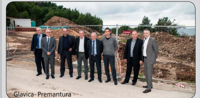
Glavica - Premantura