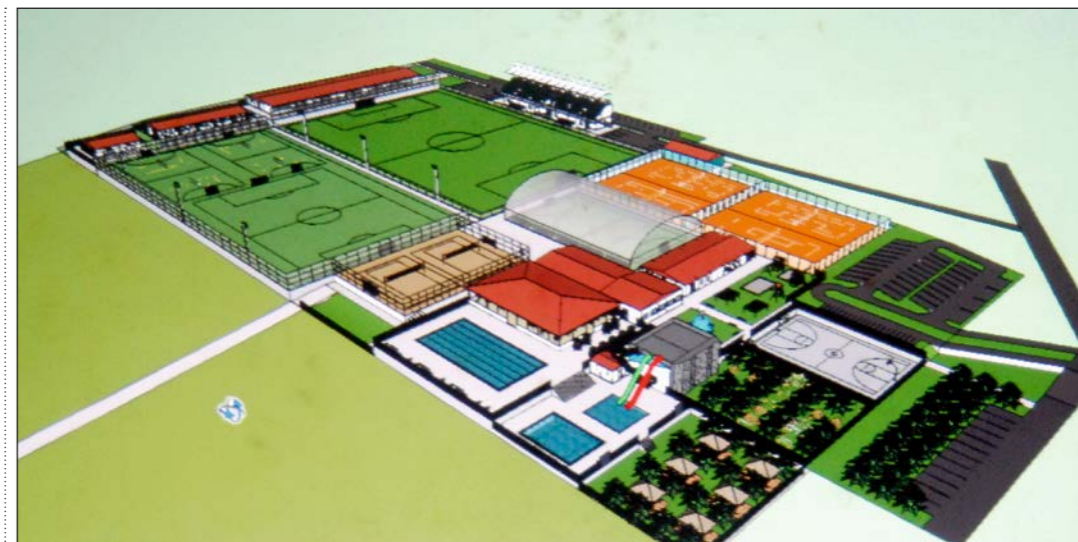
3D projekcija projekta budućeg Sportskog kompleksa Banjole

Na upit prisutnih gdje je financijski interes privatnog partnera u projektu, Špiranec je odgovorio kako je ovo investicija kroz koju planira pozitivno prihodovali prvenstveno kroz ostvarivanje glavnih