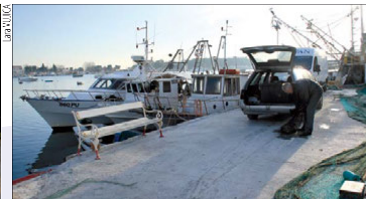
Medulinski ribari dobili su obnovljeno mulo od Straminjoni