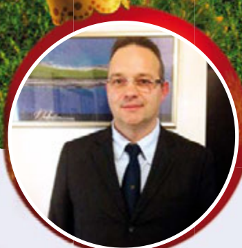
Novi ravnatelj u JU Kamenjak str. 9