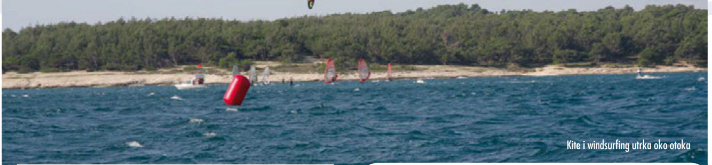
Kite i windsurfing utrka oko otoka