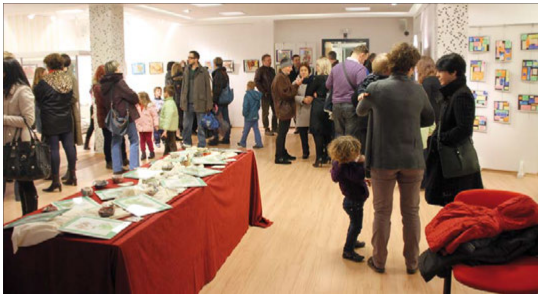
Humanitarna akcija - prodaja radova koje su izradila djeca iz Dječjih vrtića Medulin za djecu Afrike u 3mc-u

Postavili smo si cilj da u svakome mjestu naše općine uredimo po jedan prostor gdje se naši građani mogu okupljati, razvijati i pokazati svoja kulturna dostignuća te širiti znanja iz naše bogate baštine, prvenstveno zbog nas samih, naših mnogobrojnih gostiju i definitivno naših budućih naraštaja.