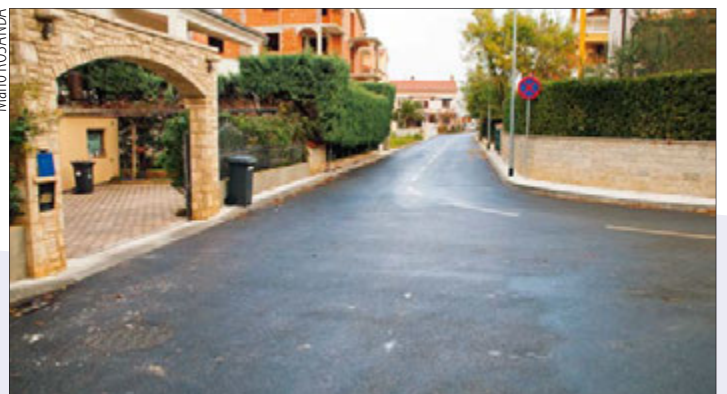
Novo izgrađena prometnica na Fucanama u Medulinu