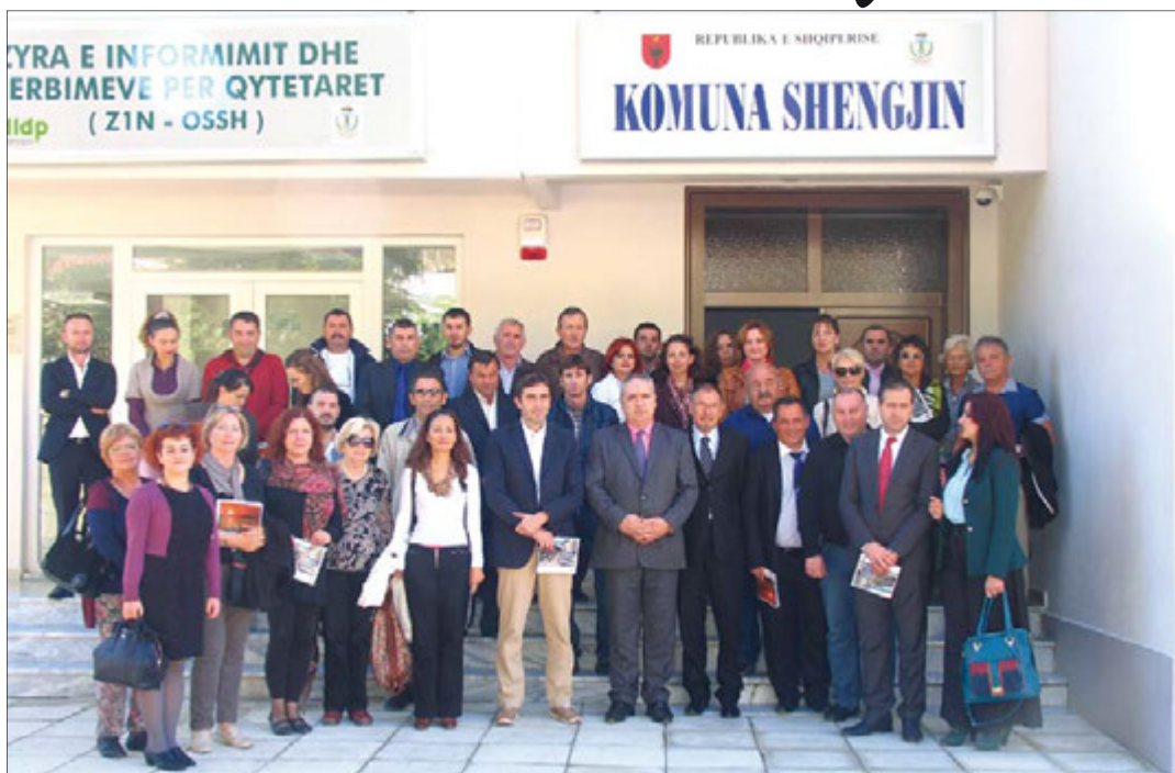
Delegacija Općine Medulin s domaćinima prijateljske Općine Shengjin u Albaniji

Nakon ručka u Shengjinu, gdje smo se pogostili ribljim specijalitetima, nastavili smo put za albansku prijestolnicu Tiranu u kojoj smo razgledali kulturne znamenitosti. Ostali smo zadivljeni hortikulturnim i arhitektonskim uređenjem samoga grada koji je jako napredovao u zadnjih deset godina. Večerali smo u poznatijem restoranu "Kod medvjeda" gdje smo degustirali albansku nacionalnu kuhinju, a za zabavu se