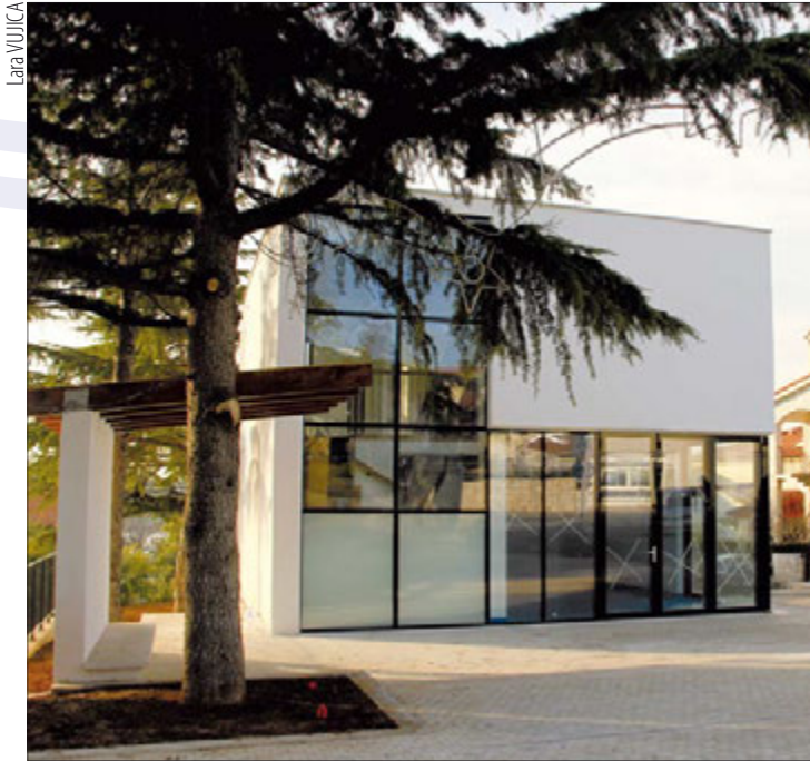
Završeni su radovi na Društvenom domu u Pješčanoj Uvali