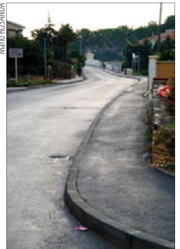
Novo izgrađena prometnica sa kompletnom infrastrukturom u Pomeru