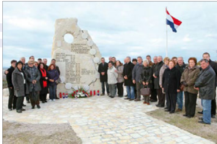
Polaganje vijenaca i paljenje svijeća za dvadeset i dvoje ubijenih nadinjana za vrijeme Domovinskog rata

“kamenjak”, mjesto na kojem je izgrađen križni put, na čijem je vrhu podignuta mala crkvice u spomen svim stradalima u Drugom svjetskom ratu, kada je 62 ljudi iz okolnih naselja, hrvatske nacionalnosti, dovedeno na vrh, mučki ubijeno i bačeno u