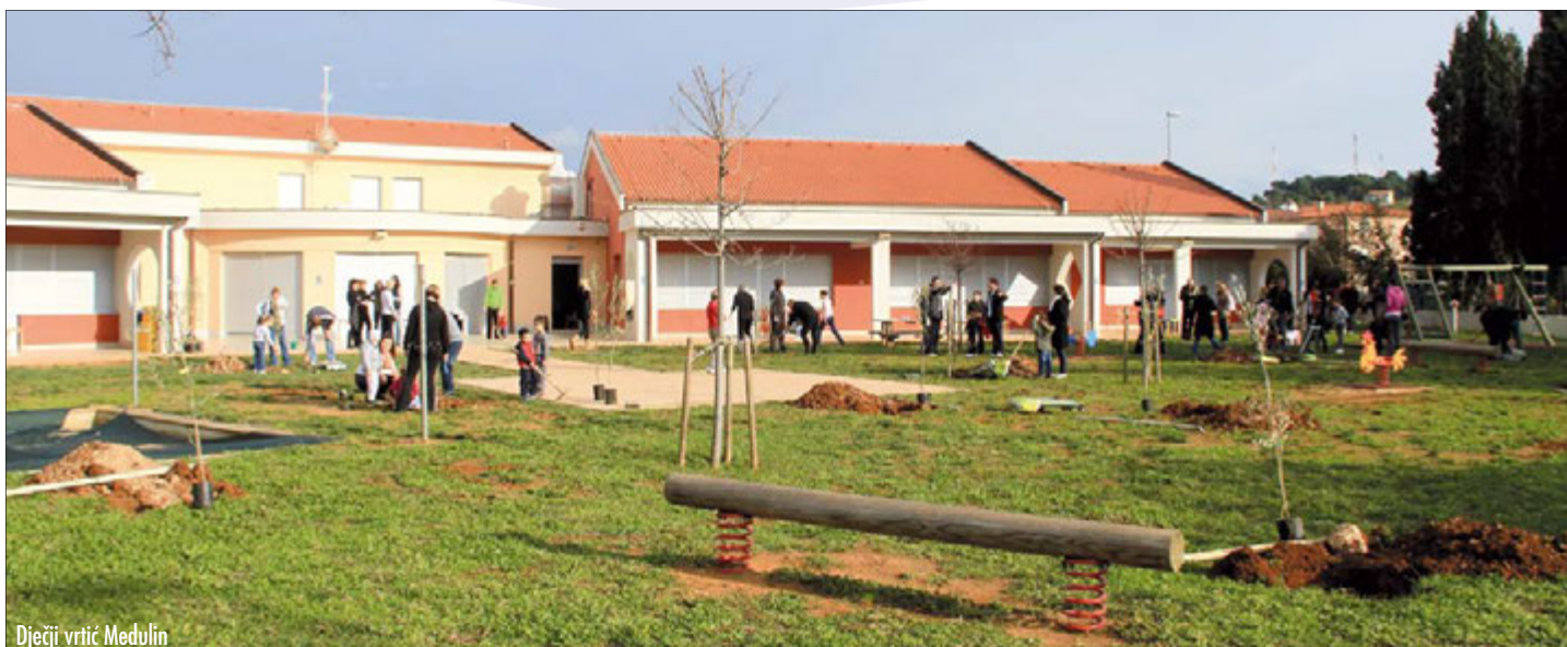
Dječji vrtić Medulin

Poštovani, pred vama je tek kratki prikaz aktivnosti i doživljaja koje smo s djecom dijelili od rujna do prosinca ove godine. Sve aktivnosti svoje polazište nalaze u diskusijama o postignućima i potrebama uočenim u prethodnoj godini, ali i želji da djeci prenosimo radost učenja, spoznavanja, istraživanja i osjećaje pripadnosti svojem društvu i kulturnom okruženju. Željeli smo omogućiti djeci uvjete u kojima će se osjećati kompetentno, vrijedno pažnje, slobodno u izražavanju mišljenja i ideja. Naposljetku, ali ne i manje bitno, željeli smo kod djece pobuditi potrebu za aktivnim djelovanjem kroz koje će osobno doživjeti postignuća i radost timskog rada u postizanju zajedničkog cilja.