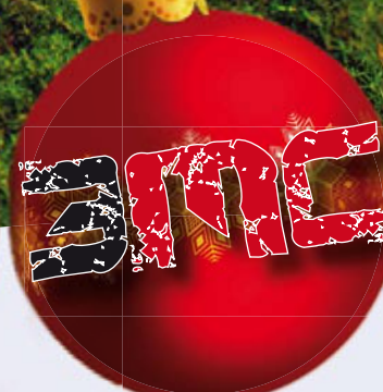
Novi multimedijski centar na Placi u Medulinu str. 23