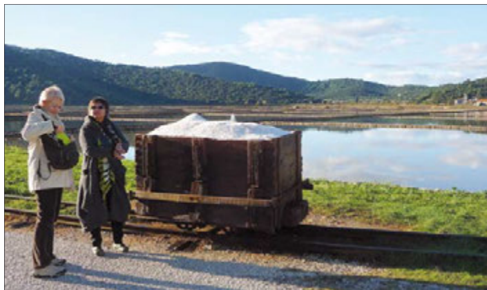
Vagonet sa prirodnom soli u stonskoj solani

Razgovarali smo o mogućnostima prekogranične suradnje na raznim EU-projektima strukturnih i kohezijskih fondova, od kojih bi i naša općina i Tivat mogli imati koristi.