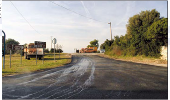
Obnovljeno raskrižje Glavica - Kaštanjež

Prometnicu je rekonstruirala tvrtka Cesta iz Pule, vrijednost izvedenih radova je 722.372,50 kn, a obuhvaćaju asfalt, oborinsku kanalizaciju, javnu rasvjetu, fekalnu kanalizaciju i vodovod.