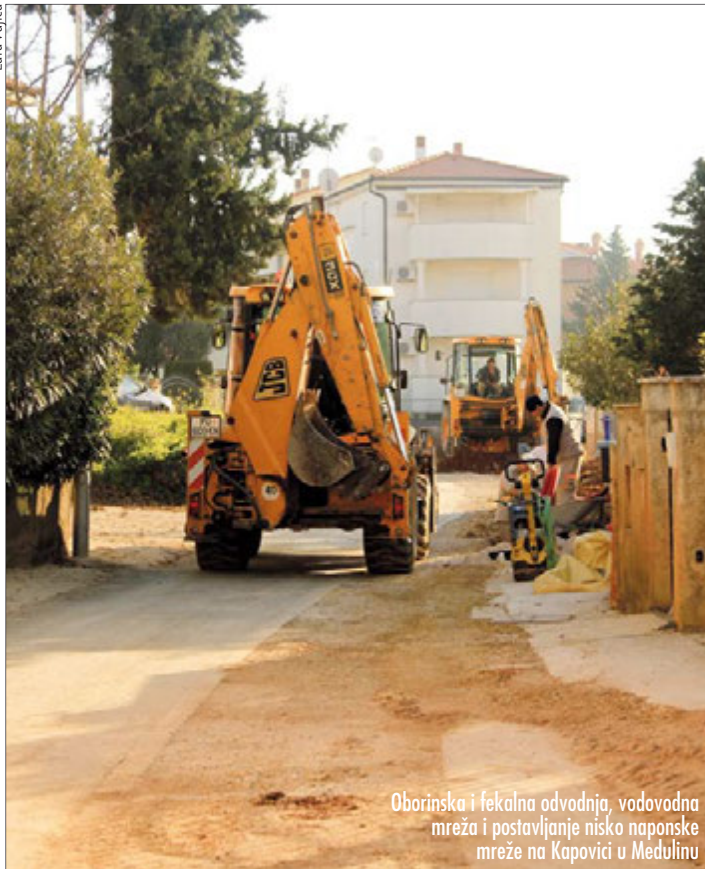
Oborinska i fekalna odvodnja, vodovodna mreža i postavljanje nisko naponske mreže na Kapovici u Medulinu

U Pješčanoj Uvali pri kraju je izgradnja Društvenog doma, a očekuje se da bi trebao biti zgotovljen do 20. prosinca ove godine. Radovi su ugovoreni s