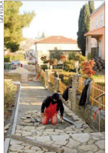
Nakon postavljanja nisko naponske mreže na Munidi popločava se pločnik

Općina Medulin je s tvrtkom Ariana turist vile d.o.o. zaključila ugovor o financiranju izgradnje infrastrukture u naselju Pošesi, s obzirom da su u vlasništvu 48 građevnih čestica na kojima su izgradili turističke građevine-vile i u interesu im je da se naselje komunalno opremi. Izgradnju javne rasvjete, oborinske odvodnje i prometnica financirali su na način da se trošak izgradnje prebija s komunalnim doprinosom za izgrađene građevine. Pored toga izgradili su i vodovodnu i fekalnu kanalizaciju. Infrastruktura je prošla tehnički pregled i uskoro bi trebala biti obavljena primopredaja radova i dokumentacije.