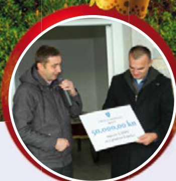
U posjetu pradomovini - Nadinu str. 14-15