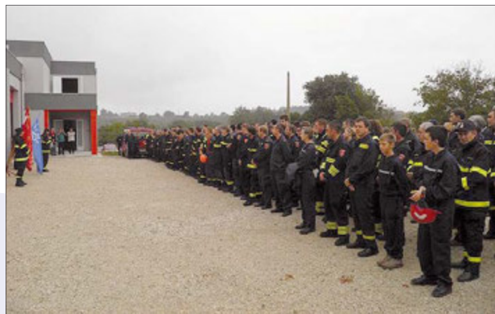
Postrojavanje svih DVD-a koji su učestvovali u vježbi