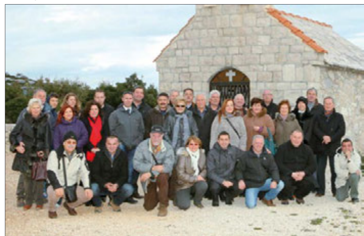
Spomen crkvice na Kamenjaku iznad vranskog jezera

duboku jamu. Ubili su ih četnički agresori pod blagoslovom njihova vojvode poznatijeg kao pop Đujić. Zapalili smo svijeću, slikali prelijepi pogled na Kornate te se zaputili u mjesto Polaču, u kojoj je najpoznatije prezime ono obitelji Bobanović.