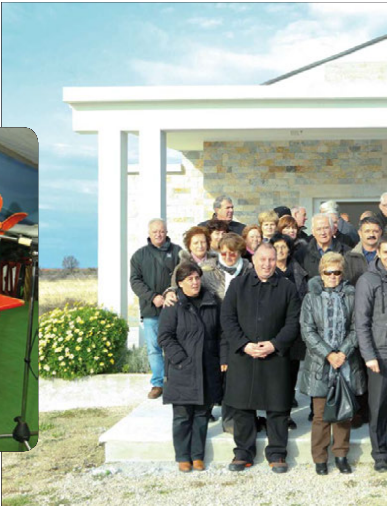
Blagoslov i otvorenje kapelice u Nadinu