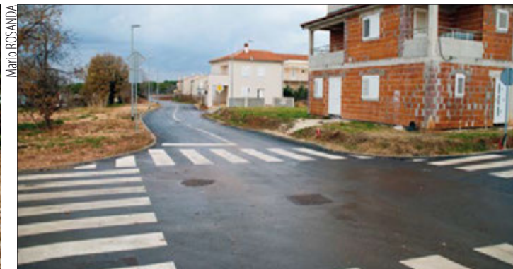
U Pošesima izgrađena kompletna infrastruktura