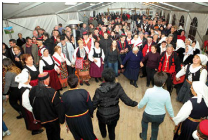
Peta degustacija vina i ulja u Nadinu