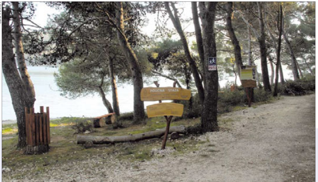
Udruga mladih Frašker postavila je koševe za smeće i klupice na šetnici Bumbište u Banjolama