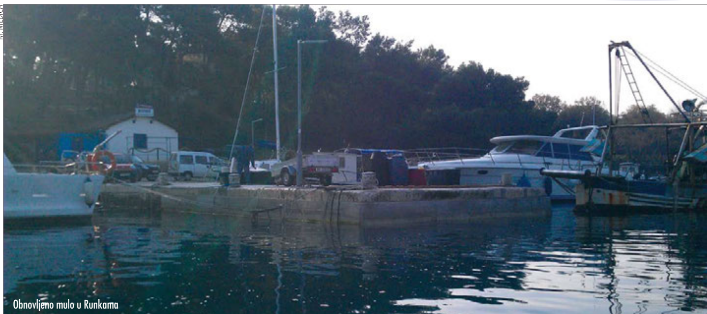
Obnovljeno mulo u Runkama

Prošla je i druga godina otako Buža d.o.o. upravlja lučkim područjem u Runkama i Polju. Prije točno godinu dana najavili smo radove u lučicama Runke i Polje za 2013. god. u visini od ukupno planiranih 450.000 kn.