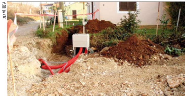
Postavljanje ormarića nisko naponske mreže u Kazalima u Medulinu

U Premanturi će se pak izgraditi sportski centar, koji će se sastojati od klupske zgrade, višenamjenskog igrališta/rukometnog, dva košarkaška i jednog za mali nogomet, igrališta s vanjskim spravama za fitness i dječjeg igrališta, na građevnoj čestici od 4.473 m 2 . Radovi će započeti 15. siječnja 2014. godine, a prvu fazu izgradnje izvodit će Tilia sport d.o.o. iz Viškova, za 694.197,50 kn.