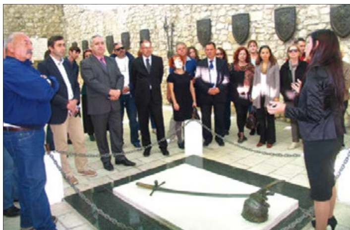
Na grobu poznatog albanskog junaka Gjergja Kastriote Skenderbeua