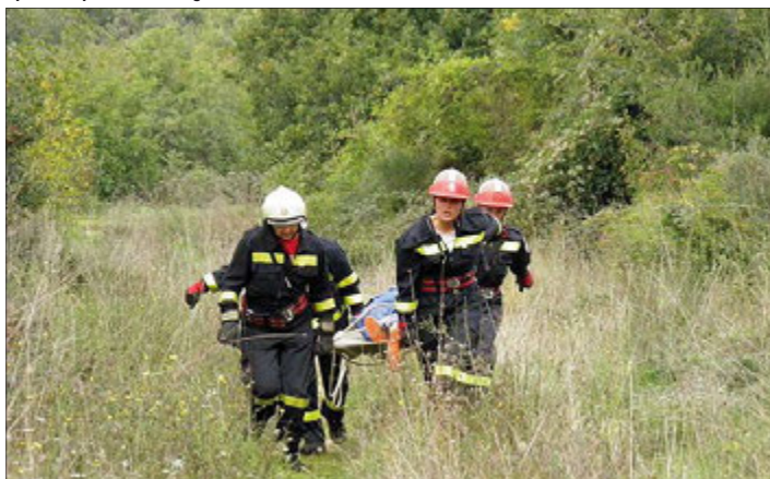
Spašavanje unesrećenog na kopnu

Medulin; organizirati vatrogasna odjeljenja djece i mladeži i organizirati stalan rad s njima; priprema ekipa za sudjelovanje na natjecanjima koje organiziraju druge vatrogasne organizacije; nastavak aktivnosti na opremanju društva vatrogasnom opremom i tehnikom i zaštitnom opremom, u skladu s financijskim planom i mogućnostima za 2013. godinu; organizacija aktivnosti i radnih akcija u cilju dovršetka uređenja