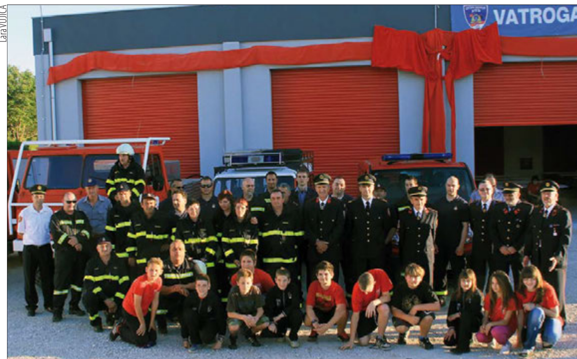
S obilježavanja završetka prve faze radova na domu DVD-a

Operativni dio društva raspolaže s 28 vatrogasaca, 7 vatrogasaca I. klase, 4 vatrogasna dočasnika, 3 vatrogasna časnika, 4 viša vatrogasna časnika, 2 vatrogasca logističara, 5 vatrogasnih časnika s posebnim ovlastima, 15 članova su vatrogasna djeca i mladež, a tu je i 20-ak počasnih članova, onih podupirućih i veterana. Imamo 6 vatrogasnih vozila - 4 navalna i 2 za prijevoz ljudstva i potrebe logistike. U 2013. godini, u skladu sa Statutom, 23. ožujka održana je 1. redovna izvještajna i skupština Dobrovoljnog vatrogasnog društva Medulin na kojoj su usvojeni izvještaji za 2012. godinu te planovi rada i financijski plan za 2013. godinu, kao i izabran novi Upravni odbor, Zapovjedništvo i radna tijela.