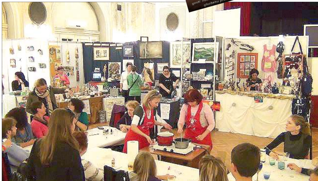
Hand Made Fest u Puli

Potom, ujedinili smo proslavu Noći vještica i obilježavanje Mjeseca knjige, što je