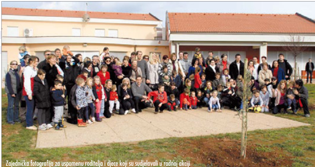
Zajednička fotografija za uspomenu roditelja i djece koji su sudjelovali u radnoj akciji