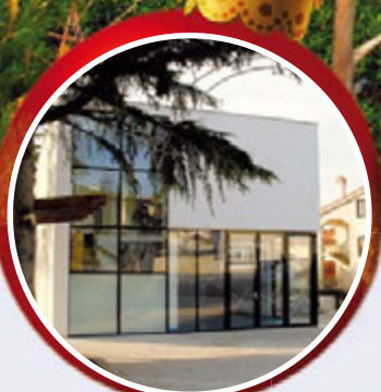
Radovi po općini str. 4-5