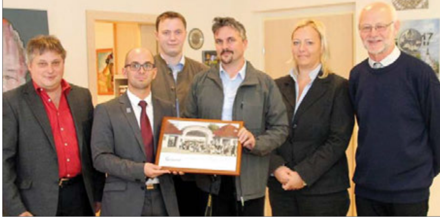
Predstavnici Općine Medulin s kolegama iz grada Gmünda

našao je svoj novi dom u logoru Gmünd. Ljudi su se tijekom tri godine u Gmündu rađali i umirali te je taj grad za mnoge od njih, nažalost, bio zadnje mjesto boravka. Posljedice izgnanstva bile su strašne, 5.000 istarskih Hrvata i Slovenaca te 30.000 ukrajinskih prognanika zauvijek su ostali u hladnoj, tuđoj