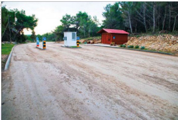
Unutar Kamenjaka uredene su prometnice ekološkim materijalom - Novokritom

Radi se o inovativnoj tehnologiji s dugogodišnjom garancijom sanacije makadamskih cesta. U potpunosti je ekološka jer se ne koriste nikakvi umjetni aditivi, nema asfalta ni bitumena. Sanacija makadamske ceste eko metodom obavlja se tako da se prvo freza postojeći sloj, i to do dubine od 30 cm, te se dodaje cementno vezivo visokog koeficijenta rastezanja i elastičnosti. Takva podloga