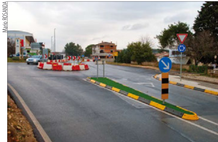
Kružno raskrižje Kamik u Banjolama