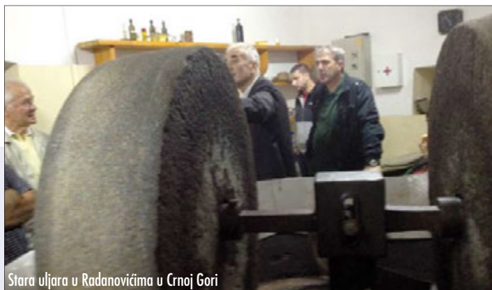
Stara uljara u Radanovićima u Crnoj Gori

pobrinula živa glazba. Vlasnik restorana ima i dva prava, velika medvjeda, koje smo pogledali bez njihova uznemiravanja.