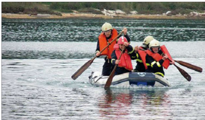
Spašavanje unesrećenog na vodi

Planom rada predviđene su sljedeće aktivnosti: nastavak obučavanja i školovanja članova za vatrogasna zvanja i specijalnosti; organizacija predavanja o vatrogasnoj djelatnosti, preventivnim mjerama i prezentaciji tehnike u osnovnim školama na području općine Medulin, s ciljem preventivne edukacije mladih ljudi i uključivanja djece i mladeži u rad DVD-a