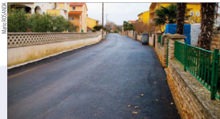
Novo izgrađena prometnica na Kapovici u Medulinu