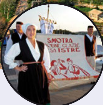
48. Smotra narodne glazbe i plesa Istre u Medulinu str. 21