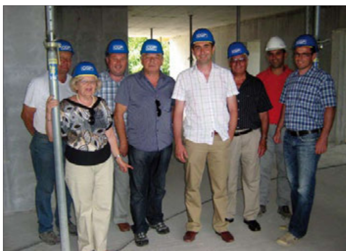
Općinska delegacija u Cerklju-umirovljenici

fe bar, usluge frizera i pedikera te liječnika. Sobe su jednokrevetne i dvokrevetne, svaka ima kupaonicu, zajednički dnevni boravak, balkon... Sve to daje omogućuje visoku kvalitetu života.