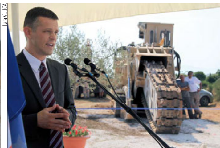
Istarski župan Valter Flego