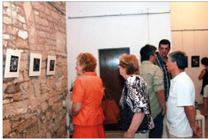
Loža u Medulinu