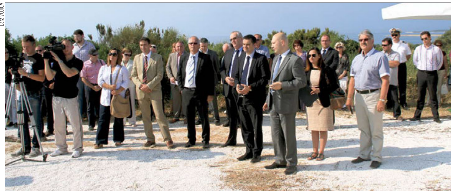
Velik broj uzvanika uljepšao je svečanost otvaranja radova u Kaželi

Do 24. rujna iskolčen je i očišćen kompletni dio trase, iskopani su kanali za polaganje cijevi u dužini od 3.280 metara, kao i kanal za energetski kabel u dužini od otprilike 850 m, obavljeno je sučelno varenje i postavljanje cijevi u dužini od oko 2.000 m i izvedeno kompletno iskolčenje podmorskog dijela ispusta prema elaboratu iskolčenja u dužini 1.030 m te napravljen podmorski snimak trase