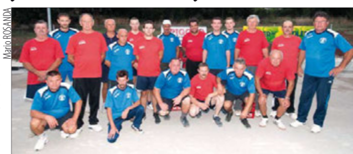
Domaćini i gosti iz B.K. "Šajini" nakon utakmice koja je završila u korist domaćina