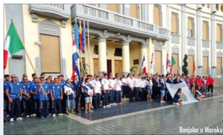
Banjolac u Maroku