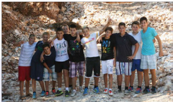
Pioniri NK Banjole bili su jedni od aktivnijih sudionika akcije