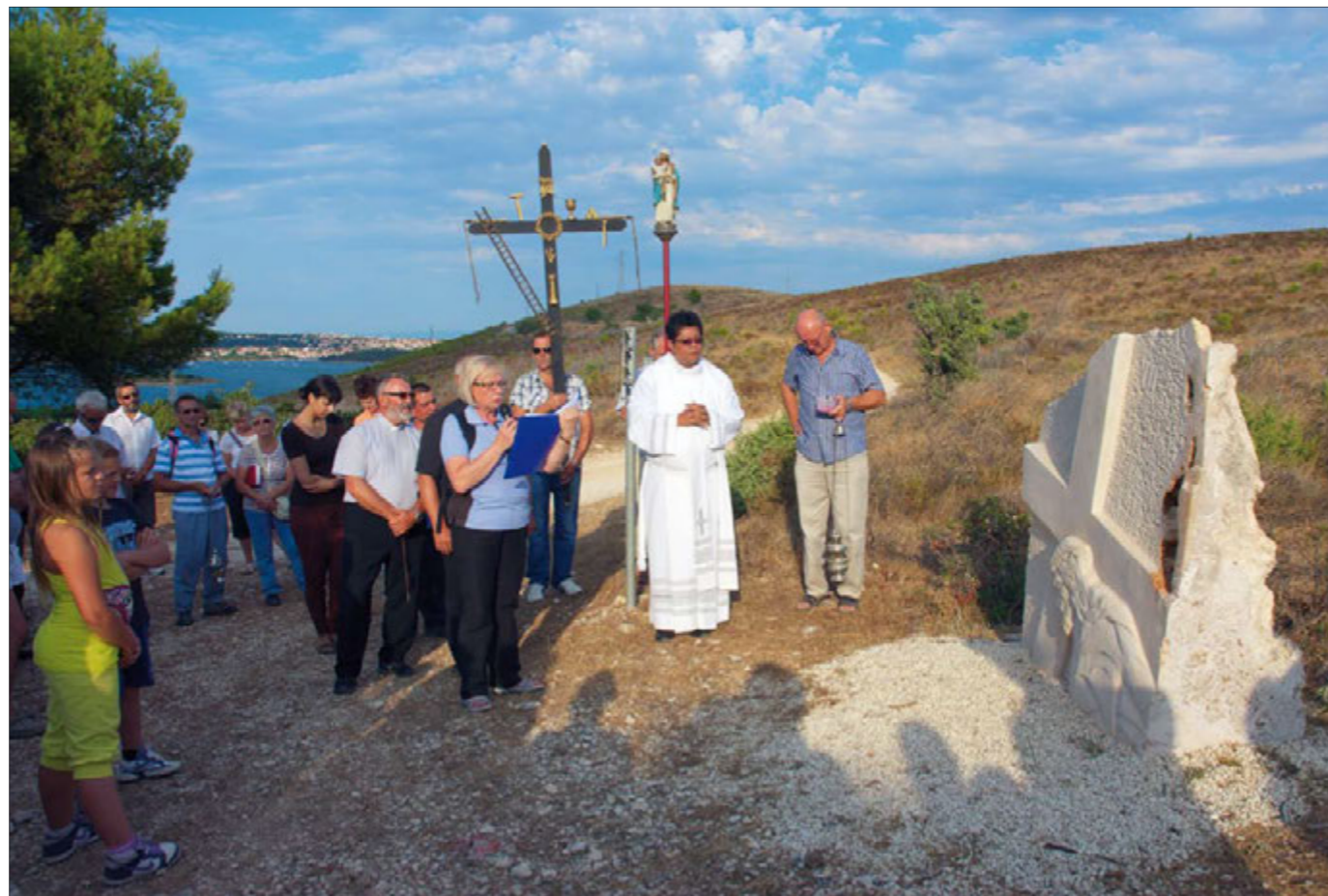
Blagoslov VII postaje

goslovio je križ i svaku postaju križnoga puta. Na čelu procesije bili su vjernici koji su nosili kadionice, veliki drveni križ i kip Djevice Marije. Više od 250 vjernika tijekom cijelog križnog puta molilo je krunice. Na pola puta, na najvišem brdu na Gornjem kamenjaku blagoslovljen je velebni križ, koji zajedno s postoljem ima gotovo sedam metara. Križ je izrastao iz ka-