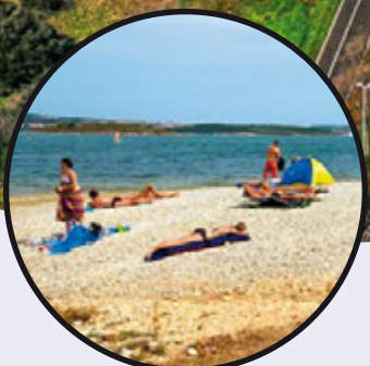
Uređivanje plaža u medulinskoj općini u 2013. godini str. 14