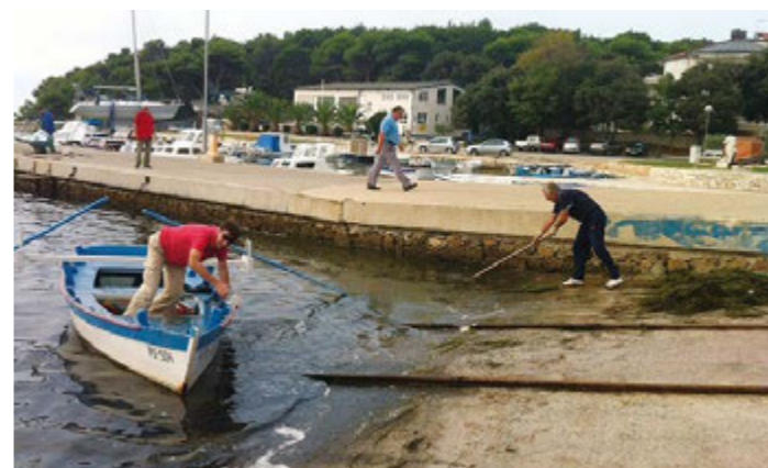
Čišćenje navoza za izvlačenje plovila