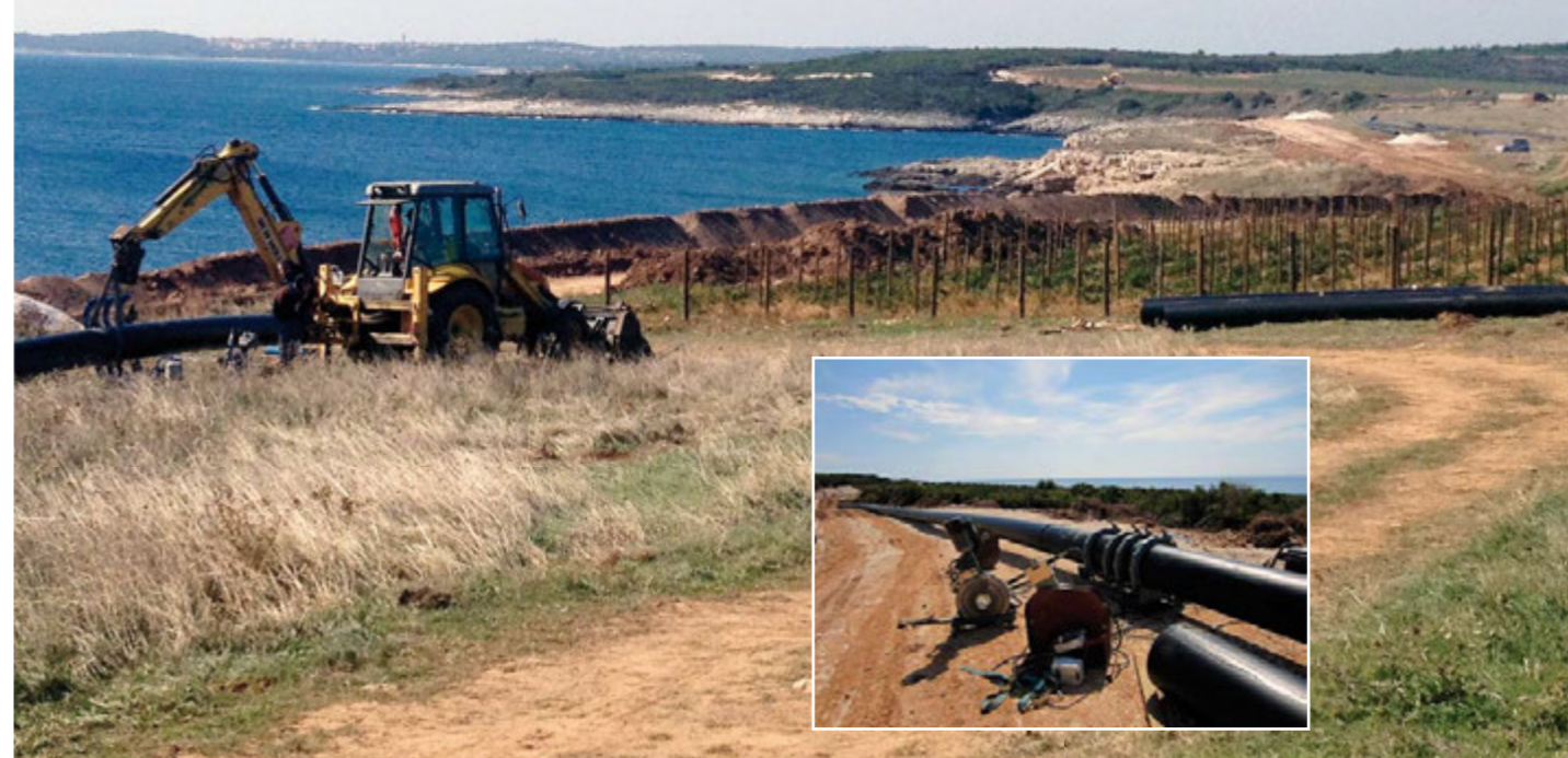
Polaganje posljednjih metara cijevi kopnenog ispusta na Marleri

U samom činu otvaranja radova i presijecanja vrpce