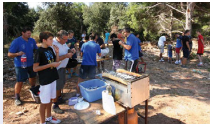
Veterani NK Banjole i članovi ŠRD Banjole također su učestvovali u akciji

POLUGODIŠNJI IZVJEŠTAJ O IZVRŠENJU PRORAČUNA OPĆINE MEDULIN ZA 2013. GODINU