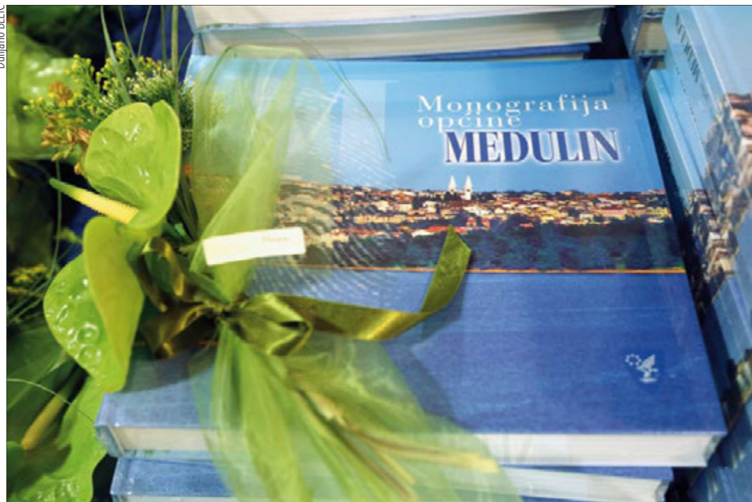
Kapitalno djelo Općine Medulin u 2013. - Monografija