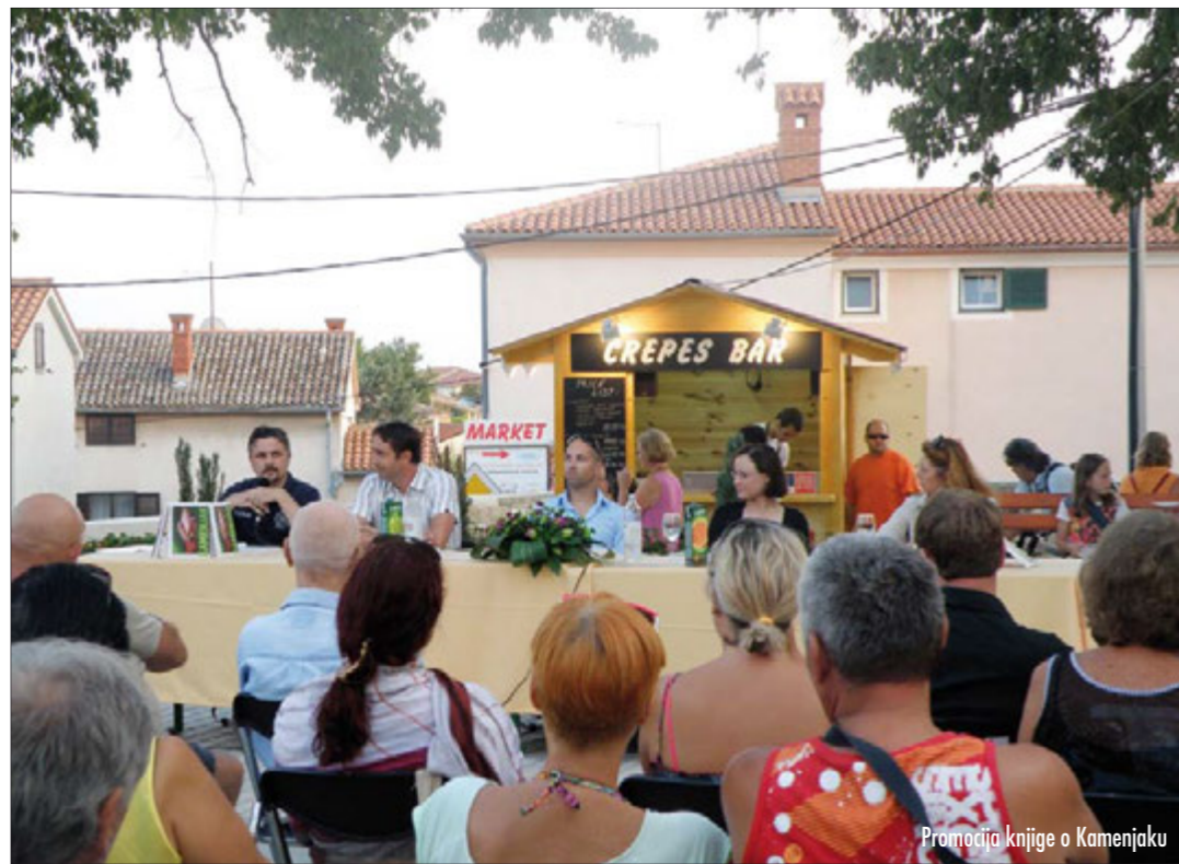
Promocija knjige o Kamenjaku

Javna ustanova Kamenjak, zadužena za upravljanje zaštićenim dijelovima prirode u općini Medulin, krajem kolovoza priredila je svečanu promociju prvog izdanja knjige o prirodnim vrijednostima medulinske općine, uz naglasak na njen prirodni brend - Značajni krajobraz Donji Kamenjak i medulinski arhipelag, a koja je namijenjena domaćim i stranim čitateljima. Na 160 stranica prikazano je više od stotinu fotografija prirodnih vizura živoga svijeta, sažeta je bioraznolikost područja i ispričane su priče o živom kozmosu oko nas, s umjerenom dozom znanosti i popularne tematike. Moglo bi se reći da ova knjiga predstavlja svojevrsnu enciklopediju i razglednicu najljepšeg dijela našeg poluotoka.