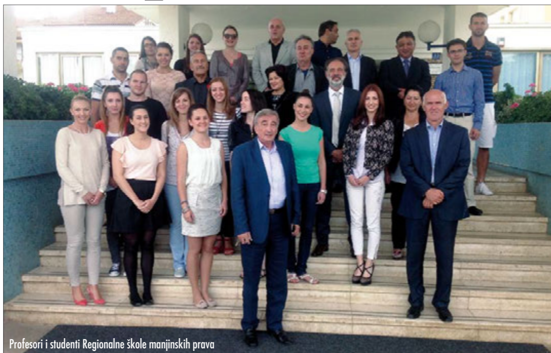
Profesori i studenti Regionalne škole manjinskih prava

Sradom je završila četrta Regionalna škola manjinskih prava u organizaciji Centra za međunarodne i sigurnosne studije Fakulteta političkih znanosti Sveučilišta u Zagrebu, koja je od 16. do 21. rujna održana u Medulinu. Sedmodnevni rad 40-ak studenata i profesora Fakulteta političkih znanosti iz Beograda i Zagreba, Pravnog fakulteta iz Zagreba, predstavnika lokalnih, regionalnih i državne vlasti, kao i mladih pripadnika manjinskih zajednica u Republici Hrvatskoj, rezultirao je preporukama koje će u formi zaključaka biti upućeni političkim institucijama zaduženim za zaštitu nacionalnih manjina država sudionica. Tijekom seminara izloženo je i raspravljeno mnogo tema koje su od vitalnoga značaja za opstanak nacionalnih manjina – od zakonodavnih okvira koji reguliraju različite politike prema manjinama, preko modela političkog predstavnništva do ra-