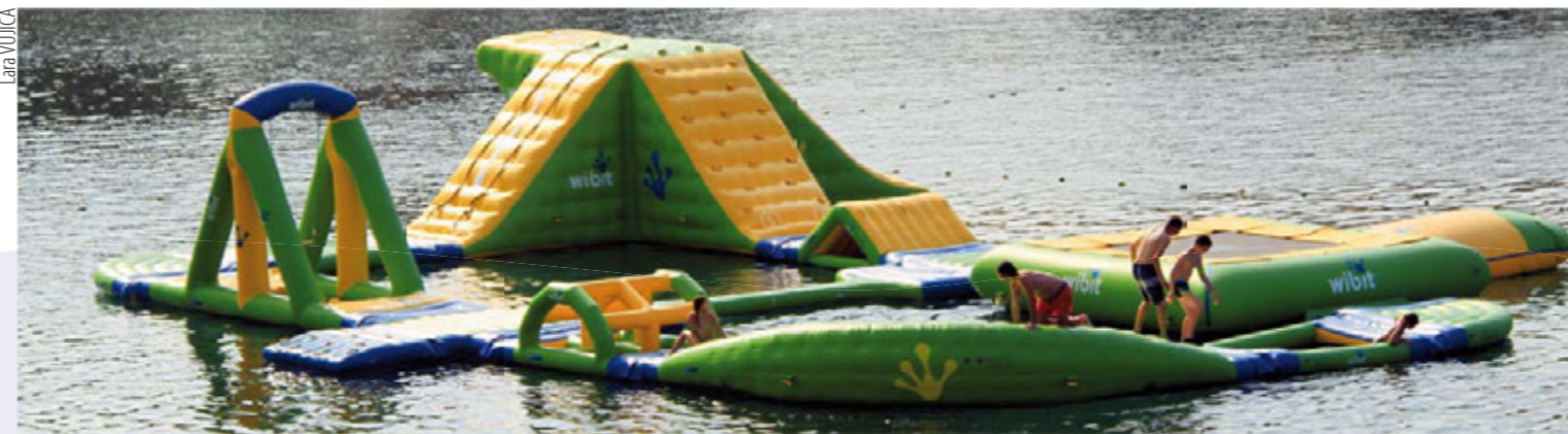
Privatni poduzetnici važan su čimbenik pri punjenju općinskog proračuna - vodeni park u Pješčanoj Uvali

Pročelnica upravnog odjela za proračun i financije Silvia Perica