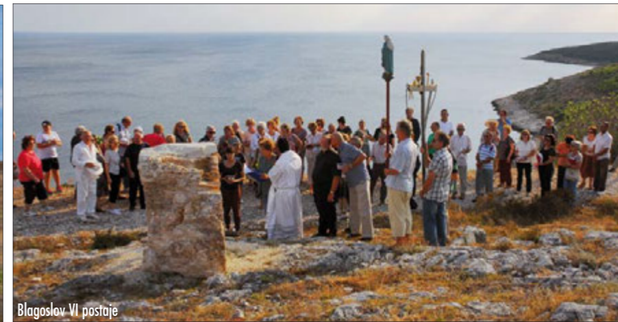
Blagoslov VI postaje