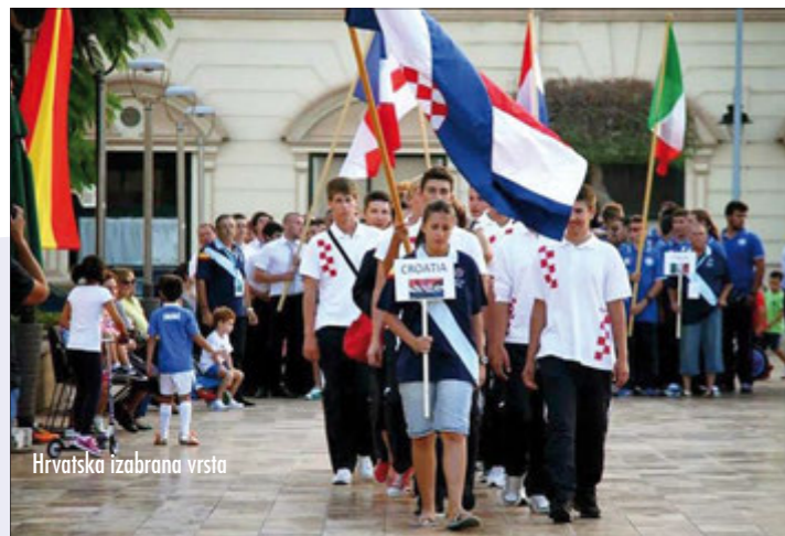
Hrvatska izabrana vrsta

Hrvatska vrsta pokazala se ozbiljan sudionik u jakoj konkurenciji u kojoj su učestvovala Španjolska koja je osvojila prvo mjesto, zatim Italija koja je osvojila drugo mjesto, Portugal, Francuska i Holandija. Svaka državna reprezentacija broji šest najboljih učesnika. Tko zna, možda imamo čast poznavati budućeg Svjetskog prvaka!