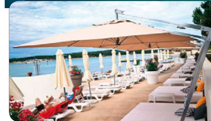
Novouređena plaža hotela Belvedere u Medulinu

bara Lungomare. Svi kupaći bit će pod budnim okom spasilaca. Renovirani i brendirani hotel Park Plaza Medulin od ove godine posluje po konceptu "Couples Only", kao prvi i jedini takav hotel na Jadranu. Rezultat je to višegodišnjeg ugovora s vodećim britanskim touroperatorom TUI UK Thomson Holidays. Thomsonov "Couples Only" koncept je nova turistička ponuda ekskluzivnih hotela za odrasle. Naglasak koncepta je na modernom dizajnu hotela koji nudi opuštanje i odmor u intimnom