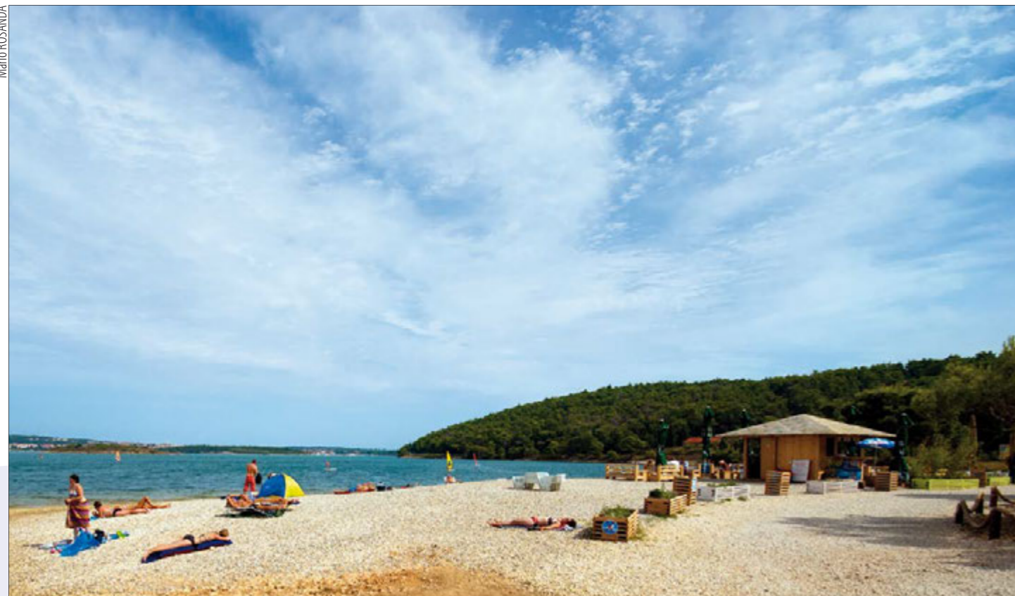
Hit ovoga ljeta bila je novouređena plaža na Šcuži