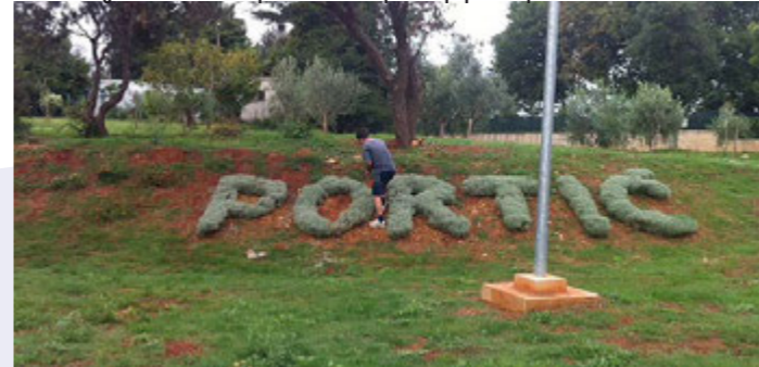
Uređena zelena površina