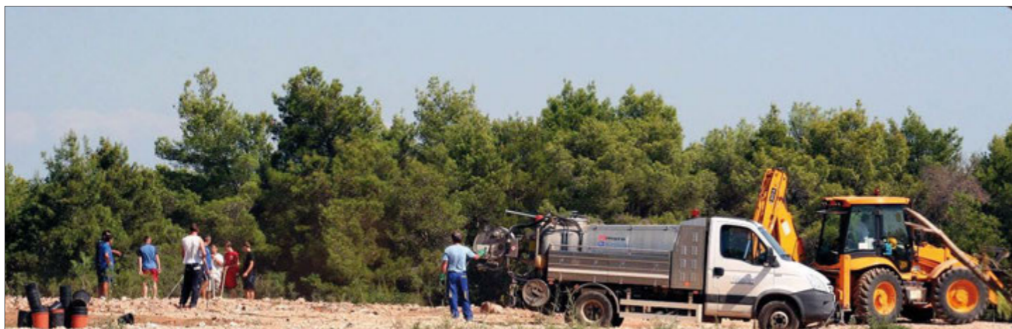
Pošumljavanje bivšeg deponija Pećine u Banjolama

Koncem rujna većim je dijelom okončana sanacija divljeg deponija Pećine u Banjolama, i to sadnjom sadnica crnika i crnog bora na središnjem dijelu tog zemljišta. Na dubljim zemljanim dijelovima posađeni su hrast crnika i primorski bor, a na kamenitijem terenu alepski i crni bor. Ovime je Šumarija Pula obavila završnu fazu sanacije velikog dijela bivšeg odlagališta. Visine sadnica kreću od se 30 centimetara do jednog metra, stare su od 3 do 5 godina, a uzgojene su u rasadnicima Frančeskija kod Savudrije i Šijana u Puli, oba u sastavu Hrvatskih šuma. Sve šumarije (Buje, Buzet, Cres – Lošinj, Poreč, Pazin, Pula, Opatija i Labin) sakupljaju sjeme šumskih vrsta za uzgajanje sadnica za pošumljavanja u Istri