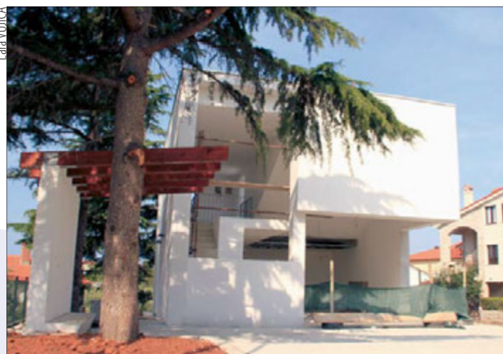
Lara VUJIĆ Društveni dom u Pješčanoj Uvali biti će završen početkom studenog 2013. godine

Za izgradnju sportskog centra u Vinkuranu ugovoreni su