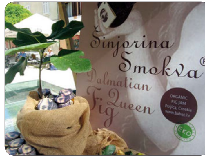
Ekološki proizvod - pekmez Šinjinorina Smokva

rijetki smokvu upotrebljavaju u pripremi slanih jela i slastica. Vrsni kuhari i slastičari su svoje gastro viđenje smokve i njenih prerađevina demonstrirali kroz servirane ukusne delicije. Pripremili su niz jela sa svježim smokvama, suhim smokvama te ekološki uzgojenim i proi-