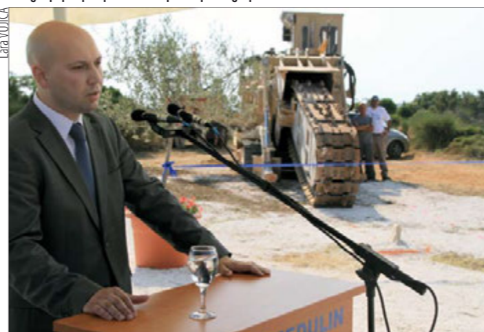
Ministar zaštite okoliša i prirode Mihael Zmajlović

medulinski župnik Ante Močibob je blagoslovio početak radova. Ministar Zmajlović je istaknuo da će izgradnja ispusta osigurati bolje stanje okoliša, što je jako važno za medulinsku općinu, kojoj je najvažnija privredna grana turizam.