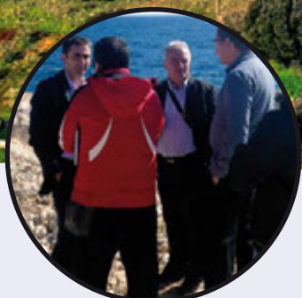
Počela izgradnja kanalizacijskog ispusta Kazela - Marlera str. 6-7