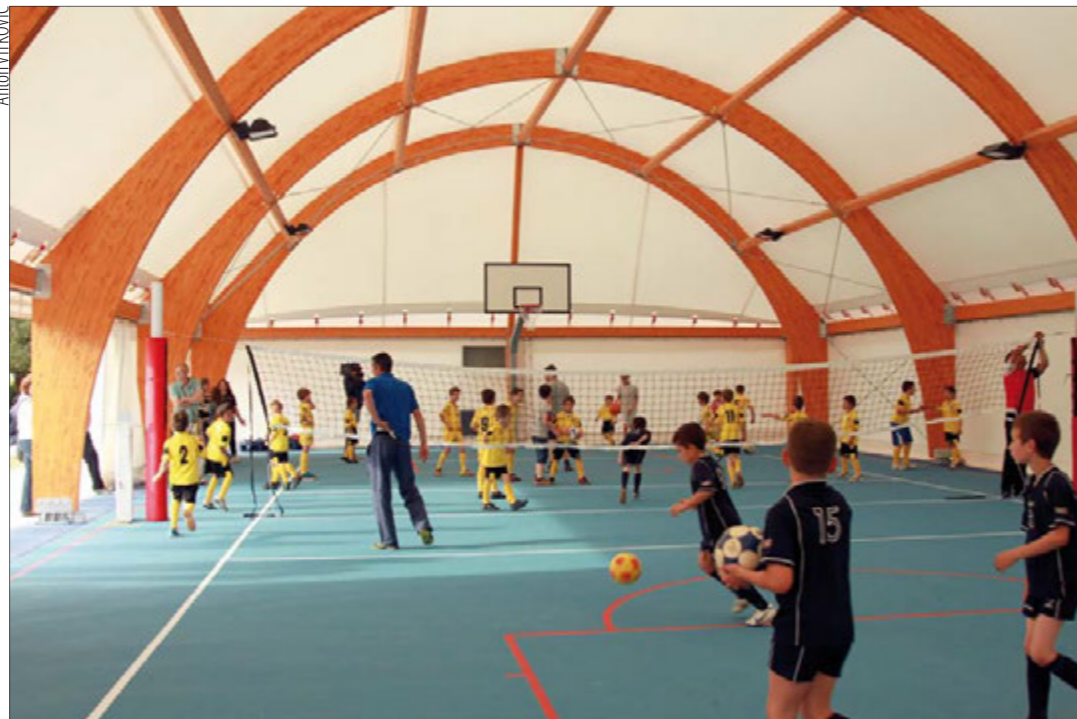
Anton VIKOVIĆ Mlade snage Medulina i Banjola obilježile su završetak izgradnje polivalentnih dvorana u Banjolama i Medulinu

Dosad je izgrađeno prizemlje od 547,19 m 2 od toga garaža 300 m 2 , i kat od 200 m 2 . Na prvom katu se nalaze društvene prostorije. Izvedeni su i zemljani radovi u cilju uređenja okoliša, koji su koštali 48.000