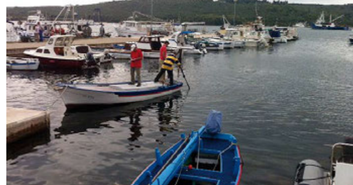
Kontrola lanaca za sidrenje