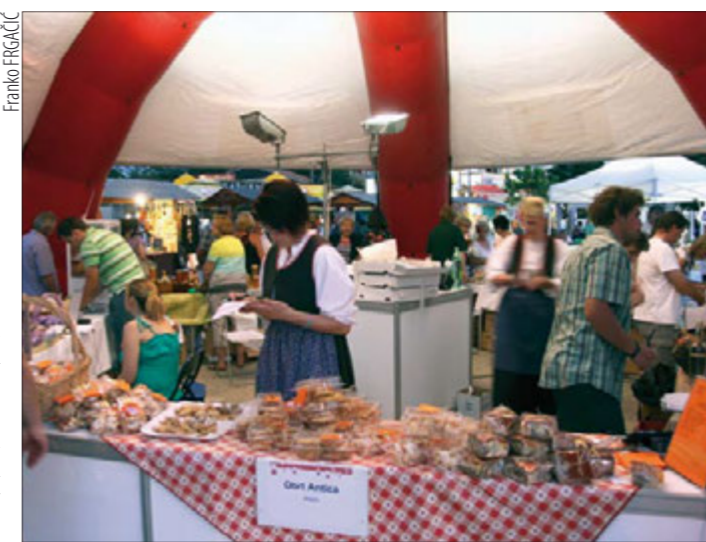
Jedna od važnijih gospodarskih manifestacija ovoga ljeta na medulinskoj rivi - "Kupujmo Hrvatsko"

Općina Medulin sufinancira produženi boravak osnov-