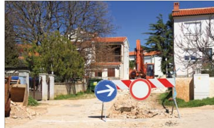
Radovi na kanalizaciji od Rova prema Vrčevanu