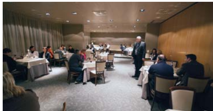
Večera u restoranu hotela Kokra, protokolarna rezidencija Slovenske vlade Brdo kod Kranja