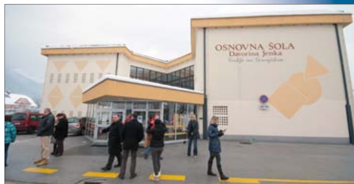
Razgledavanje škole i sportske dvorane