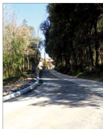
Uređena je i prometnica na Rupicama u Banjolama