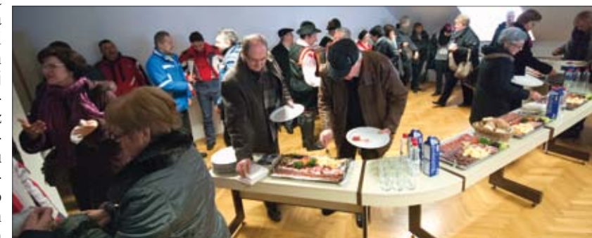
Za naše penziće domaćini su organizirali bogatu trpezu dobrodošlice