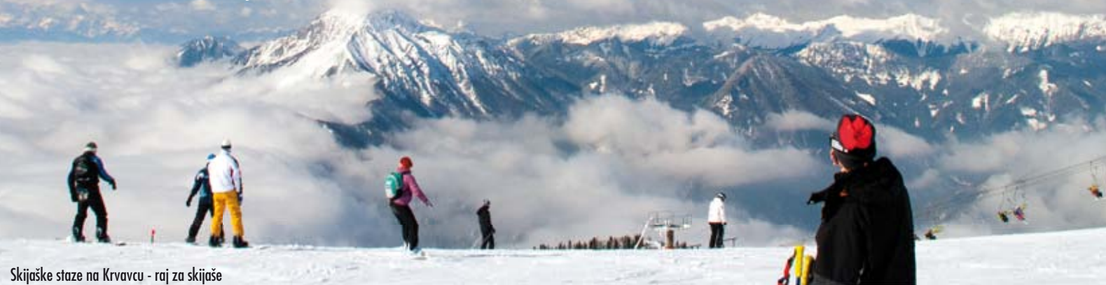
Skijaške staze na Krvavcu - raj za skijaše

Susret u Cerklju financiran je sredstvima programa Europske unije "Europa za građane" i održan je u tri dijela – za općinare, vrtičare i osnovnoškolce te umirovljenike