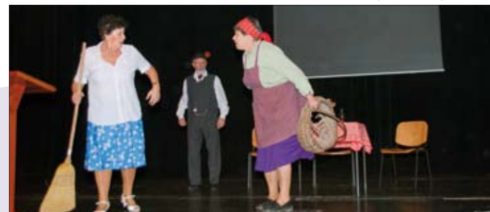
Domaćini su oduševili sve prisutne svojim programom, za što su bili nagrađeni dugačkim aplauzom