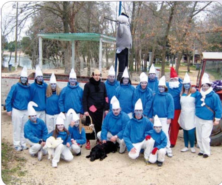
Banjolski štrumfovi u punom sastavu

K ao i svake godine, kako tradicija nalaže, održale su se tradicionalne "Banjolske krabulje" u organizaciji Udruge mladih Banjola "Frašker". Ove godine organizatori su se po prvi puta odlučili za grupnu masku štrumfova. Grupna maska iznenadila je mještane Banjola koji su bili oduševljeni tom idejom. Štrumfovi su se pokazali u punom sjaju zajedno sa Papa štrumfom, prekrasnom štrumfetom, Gargamelom i Azrijelom! Krenulo se od ranoga jutra,