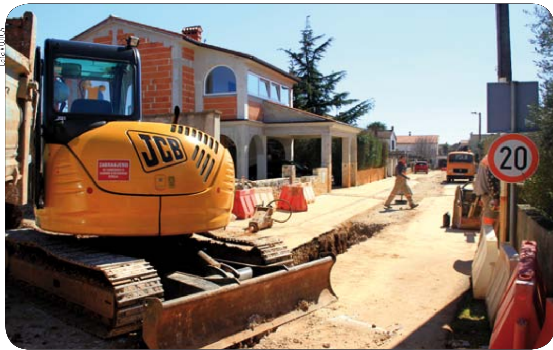
I naselje Biškupija u Medulinu dobiva fekalnu mrežu

Komunalno poduzeće Albanež investitor je u izgradnji sustava odvodnje otpadnih voda u općini Medulin te se radovi nastavljaju i u 2013. godini, još jačim tempom no u 2012., i to prvenstveno kroz projekt "Jadran" i investicijski ciklus Hrvatskih voda.