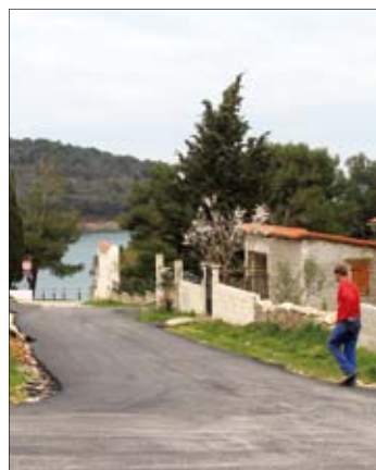
Novouređena prometnica u Indijama