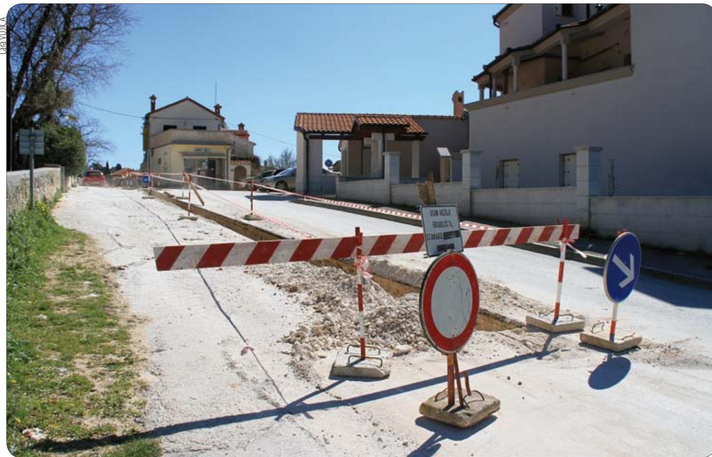
U Vinkuranu se gradi fekalna odvodnja

Budućnost Općine vidim u snažnoj suradnji s privatnim sektorom, obzirom da strateške investicije nisu moguće bez suradnje javnog sektora i potencijalnih investitora. U prvom redu mislim na poboljšanje,