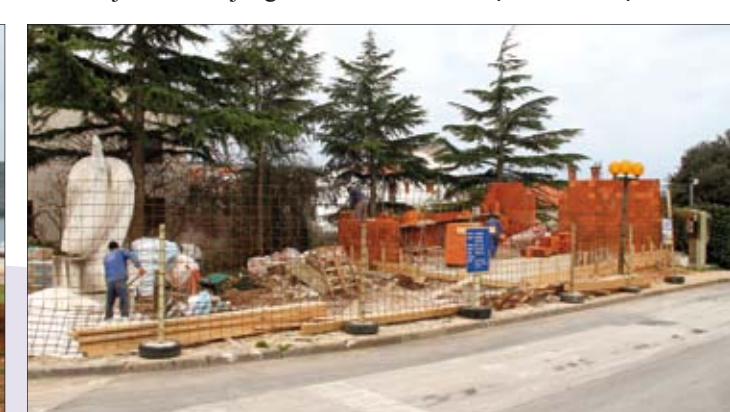
Radovi na društvenom domu u Pješčanjoj uvali