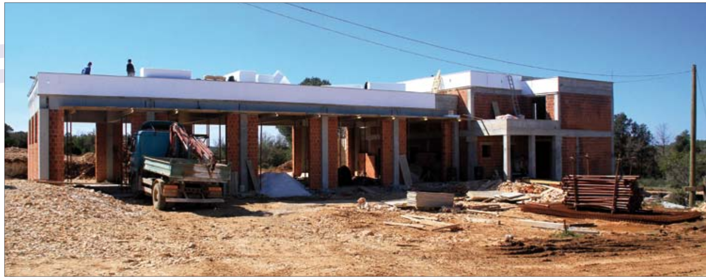
Radovi na DVD domu privode se kraju