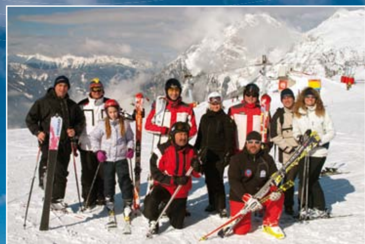
Predstavnic općine Medulin isprobali su skijalište na Krvavcu