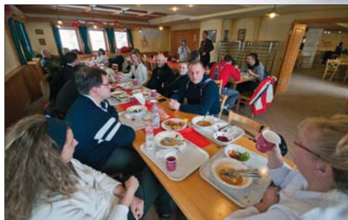
Tradicionalni krvavški ručak