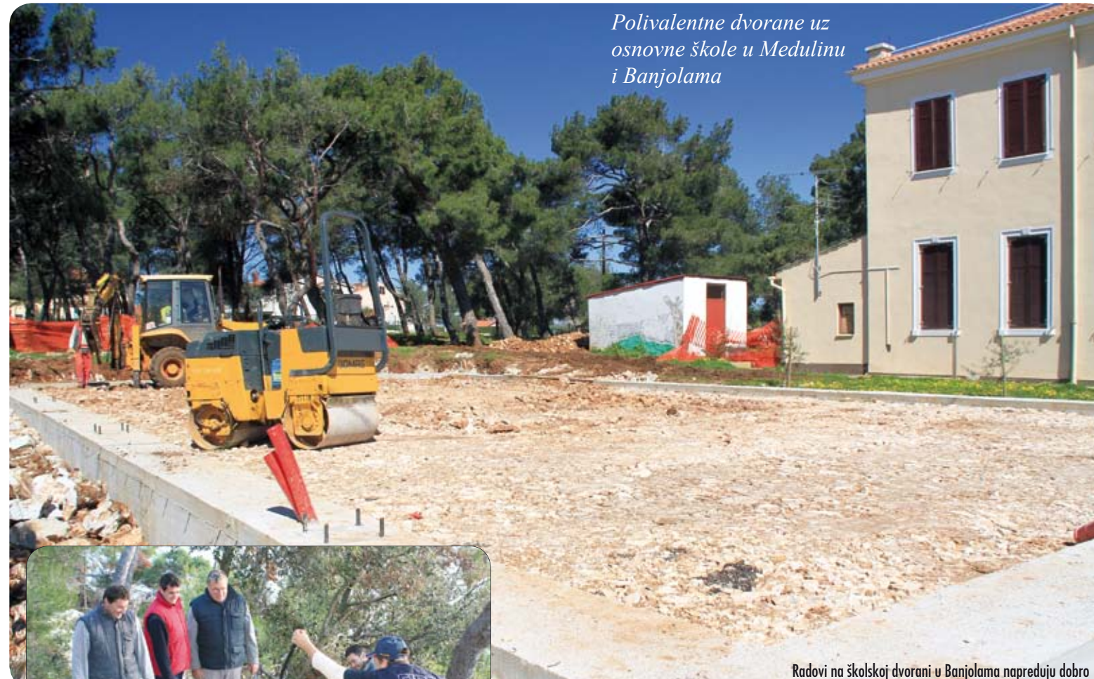
Polivalentne dvorane uz osnovne škole u Medulinu i Banjolama

Za I. fazu izgradnje sportskog centra u Vinkuranu ugovor je sklopljen s tvrtkom Vladimir