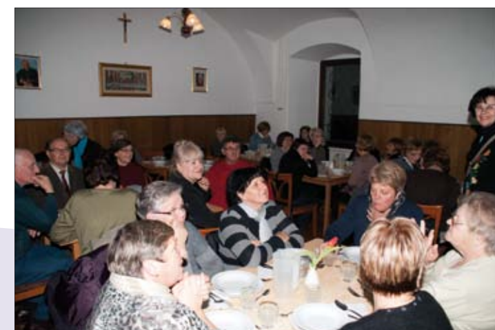
Zajednička večera u samostanu Velesovo koji slavi 850 godišnjicu postojanja