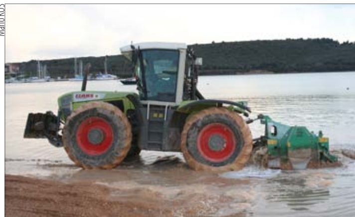
... uz pomoć moćne mehanizacije