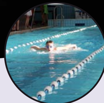
Sport u općini ostvaruje sjajne rezultate str. 25-27