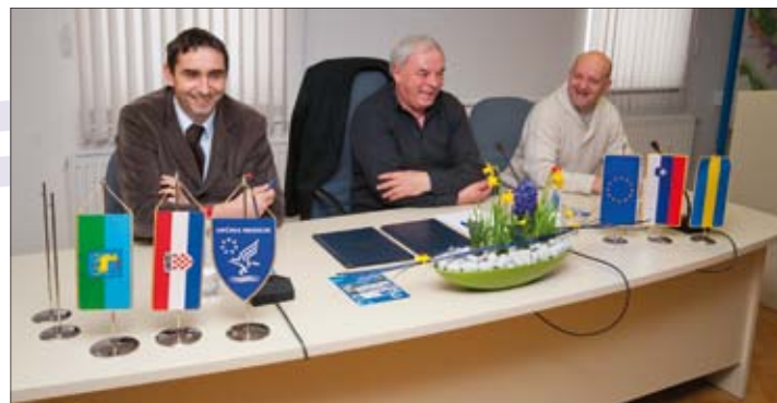
U vijećnici su načelnici općina ponovno potpisali Povelju o bratimljenju