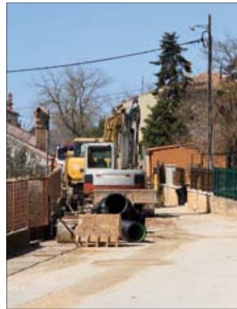
U Vinkuranu se gradi oborinska odvodnja