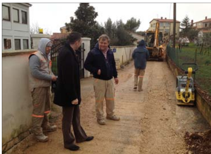
Pomer dobiva novu vodovodnu mrežu