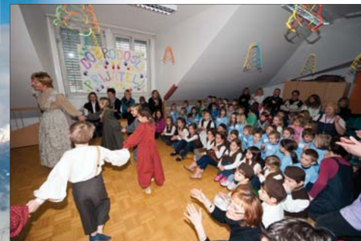
Kulturni program domaćina i gostiju u vrtiću u Cerklju