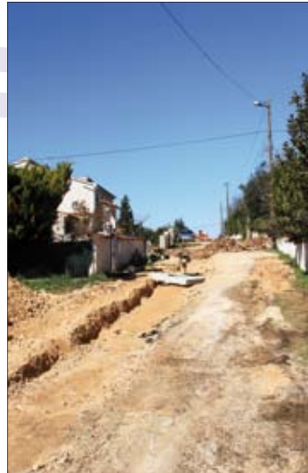
Naselje Regi u Medulinu dobilo novu kanalizaciju

Dobivena je potvrda glavnog projekta, izrađen je troškovnik i raspisana javna nabava za izvođenje radova. Vrijednost nabave je 716.800,00 kn. Predviđeno je izvođenje građevin-