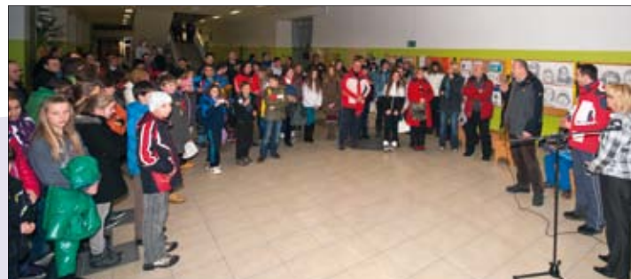
Medulinski osnovnoškolci u uzvratnom posjetu obiteljima slovenske djece iz OŠ Davorina Jenka

ZAJEDNO MOŽEMO: SUSRET U CERKLJU NA GORENJSKEM OD 14. DO 16. VELJAČE 2013.