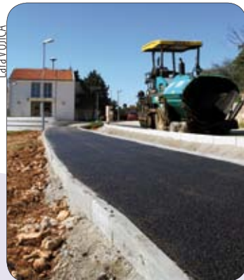
Uređen je novi nogostup kod Galerije u Banjolama

Općina, naravno treba nastaviti s izgradnjom komunalne infrastrukture po naseljima, uređaja za pročišćavanje otpadnih voda, koristeći se pri tome svim izvorima financiranja koji su na raspolaganju od Bruxellesa do Zagreba.