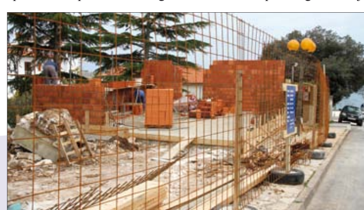
Društveni dom u Pješčanjoj uvali dobiva svoje obrise

lište, dva terena za košarku ili jedan teren za mali nogomet površine 1100,00 m 2 . Dovršetak se očekuje unutar dva tjedna. II. faza sportskog centra je