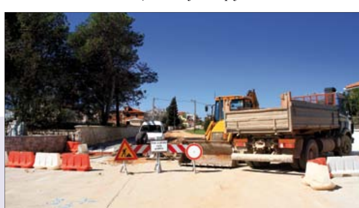
U pomeru se uređuje prometnica sa nogostupom

Izgradnja polivalentnih dvorana u Medulinu i Banjolama ugovorena je s tvrtkom Vintijan, vrijednost radova iznosi 372.858,90 kn i u tijeku su.