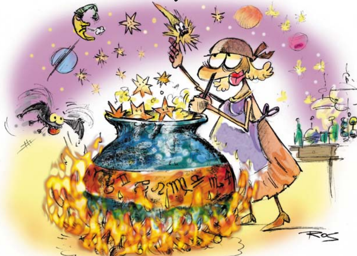
Ilustracija Mario ROSANDA ROS

- On je bio jako mudar čovjek ali nikada nije htio pričati. Malo