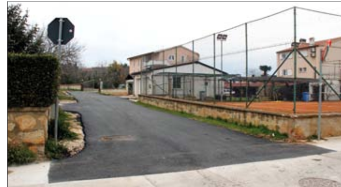
Novouređena prometnica na Glavici u Banjolama