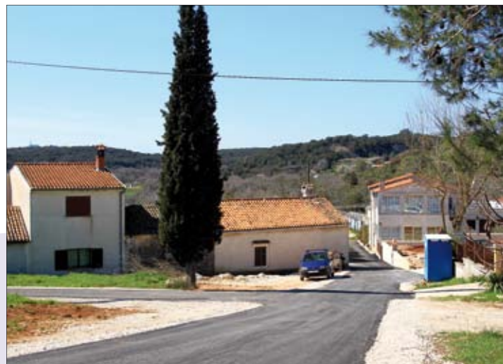
Naselje Valbonaša dobilo je novu vodovodnu mrežu i asfalt

skih radova na prometnici bez asfaltnog sloja, koji bi se postavio krajem godine.