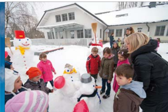
Posjet vrtiću u Cerklju