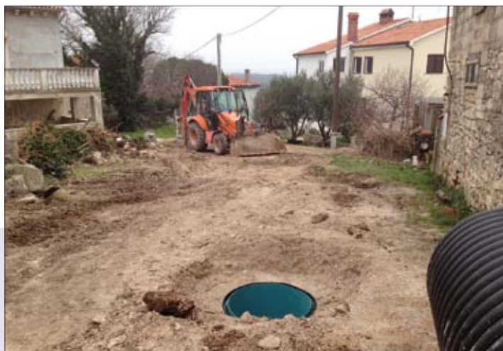
Premantura dobiva novu fekalnu mrežu

s tvrtkom Hidroprojekt-Ing iz Zagreba potpisan ugovor za izradu glavnog projekta kanalizacijskog sustava Pomer, čija se realizacija očekuje do ljeta. Nakon toga će se provesti natječaj za izgradnju kanalizacijskog sustava ovog naselja i njegovo spajanje na sustav Banjole.