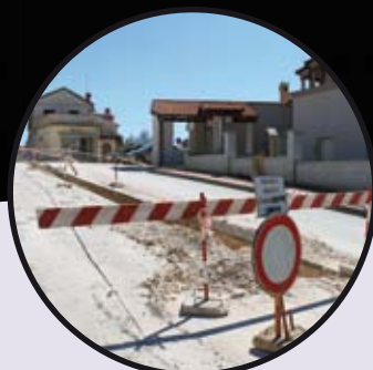
Radovi punom parom diljem općine str. 6-9