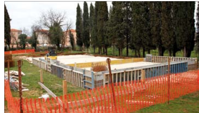
Priprema se temelji i podloga za buduću školsku dvoranu u Medulinu