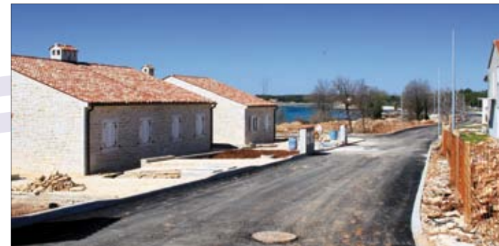
Medulinski Pošesi dobivaju novu infrastrukturu

U sklopu projekta "Jadran" uređuje se šetnica iz pravca lučice Vinkuran prema lučici Kanalić, a radove obavlja tvrtka Cesta iz Pule. Također, na tom