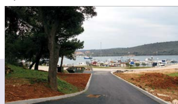
Uređena je pristupna staza u Portiću u Banjolama