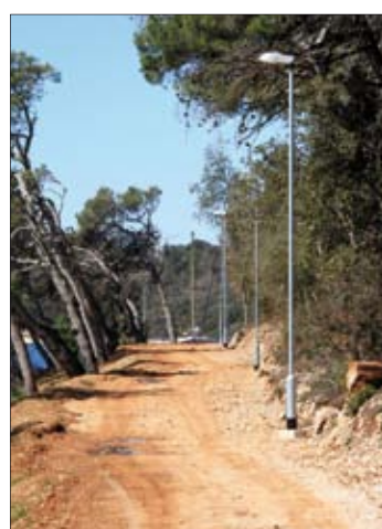
Uređuje se nova šetnica sa javnom rasvjetom od lučice Vinkuran do Kanalića u Banjolama