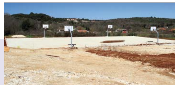
Radovi na Polivalentnom igralištu i bočalištu u Vinkuranu privode se kraju

je potezu postavljena i javna rasvjeta, a radove je izvela tvrtka Zanitel iz Vinkurana. Koštali su ukupno 60.000,00 kuna.