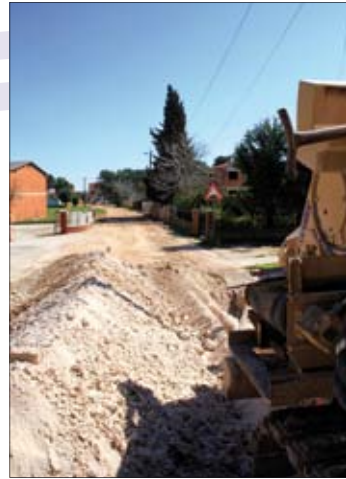
Radovi u Pomeru na oborinskoj i fekalnoj mreži