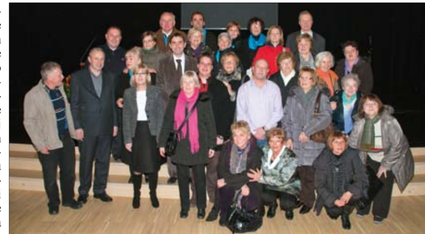
Zajednička fotografija za uspomenu nakon kulturno-umjetničkog programa u kulturnom domu