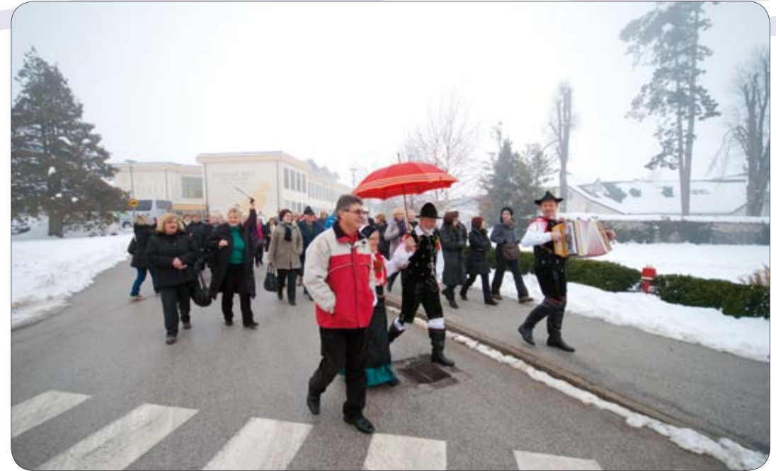
Umirovljenike su domaćini dočekali uz harmoniku i pjesmu

U okviru projekta pobratimljenja među općinama Cerklje na Gorenjskem i Medulina, ponovo smo s 43 umirovljenika posjetili Cerklje gdje smo prije dva mjeseca organizirali okrugli stol s temom problematike života osoba treće životne dobi kako bi došli do nekih novih saznanja da poboljšamo položaj i život umirovljenika. U prekrasnom ugođaju koji nam je pružio ovaj sada bijeli grad od snijega, dočekani smo uz zvuke harmonike i pjesme, jer već smo s njima ranije sklopili poznanstva, pa nije bilo teško nastaviti. Nakon pozdravnog govora, priređena nam je zakuska prema slovenskim običajima uz bisku i rakiju, koja nam je u ovom hladnom danu baš odgovarala. Nastavljamo razgovorom koje su vodile puna dva sata slovenske i naše aktivistice umirovljenika, uglavnom iz djelatnosti socijalne skrbi i u konačnosti kako doprinjeti podizanju kvalitete života kod starijih osoba. Ručak nam je poslužen u lijepo staroj gostionici. Po završenom ručku obišli smo njihove znamenitosti u gradu i smjestili se u Samostanu Velesovo, obišli crkvu i katacombe gdje su pokopane sestre i dva duhovnika. Nakon večere, organiziran je susret uz razmjene poklona pa nije nedostajalo smijeha i zabave uz ples do kasnih sati. Pod motom «skupaj zmoremo - zajedno možemo» sudjelovali smo uz članove društva upokojencev iz Cerklja koji su nas oduševili sa folklornom skupinom, a mi smo njih sa našim pjevačkim zborom, koji je burnim