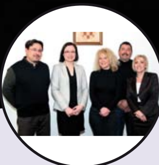
Novo Upravno vijeće JU Kamenjak str. 14