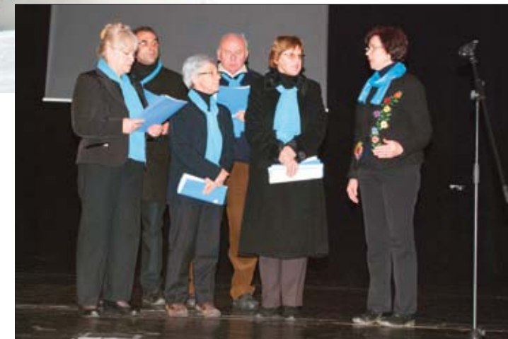
Umirovljenici su zajednički upriličili bogat kulturno-umjetnički program - crkveni zbor iz Banjola