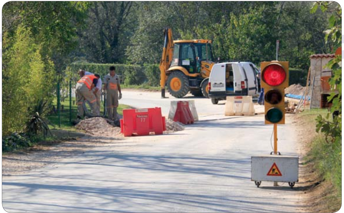
Nova vodovodna mreža - spoj kamenoloma i Vintijana

Izgradnja sportsko rekreacijskog centra u Premanturi je projekt za koji je u postupku ishodovanje akata za gradnju pa će se nakon ishodovanja pristupiti radnjama za njegovu izgradnju. Kako je ljetni period vrijeme kada je zbog turističke sezone obavljanje građevinskih radova zabranjeno, osim hitnih intervencija, radovi na novim projektima se nastavljaju. Svakako je projekt polivalentne sportske dvorane uz Osnovne škole u Medulinu i Banjolama važan i od općeg interesa, u postupku je ishodovanje akta za gradnju obju dvorana, radovi bi trebali započeti odmah nakon dobivanja dokumentacije za građenje.