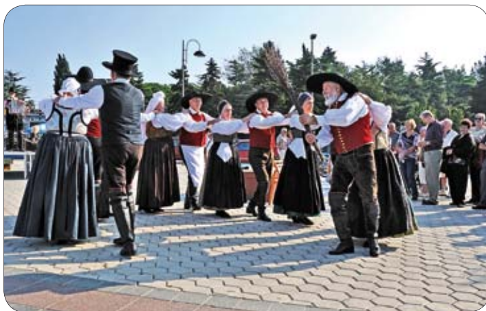
Slovenski folklor na medulinskoj rivi

Medulinskim osnovnoškolcima u posjet su došli učenici iz OŠ Davorina Jenka iz Cerklje na Gorenjskem te su imali posebno organiziran sportsko-kulturni dan na igralištu škole. Uz to, organiziran je i okrugli stol na temu "Kad ja narastem u EU-u" i "Mladi u EU-u" te im je prezentiran program za mlade u Uniji. Navečer je za sve učenike organiziran EU party, na kojem su plesali uz domaće i strane hitove.