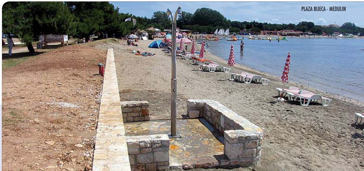
PLAŽA BIJECA - MEDULIN