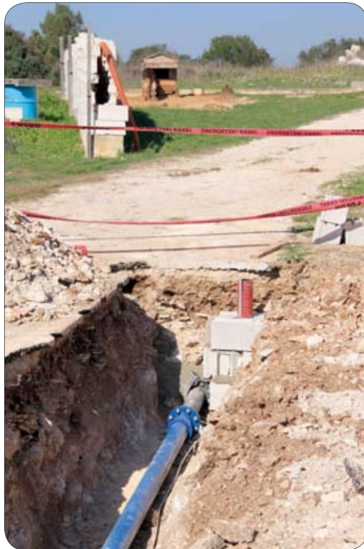
Vintijan dobiva novu vodovodnu mrežu