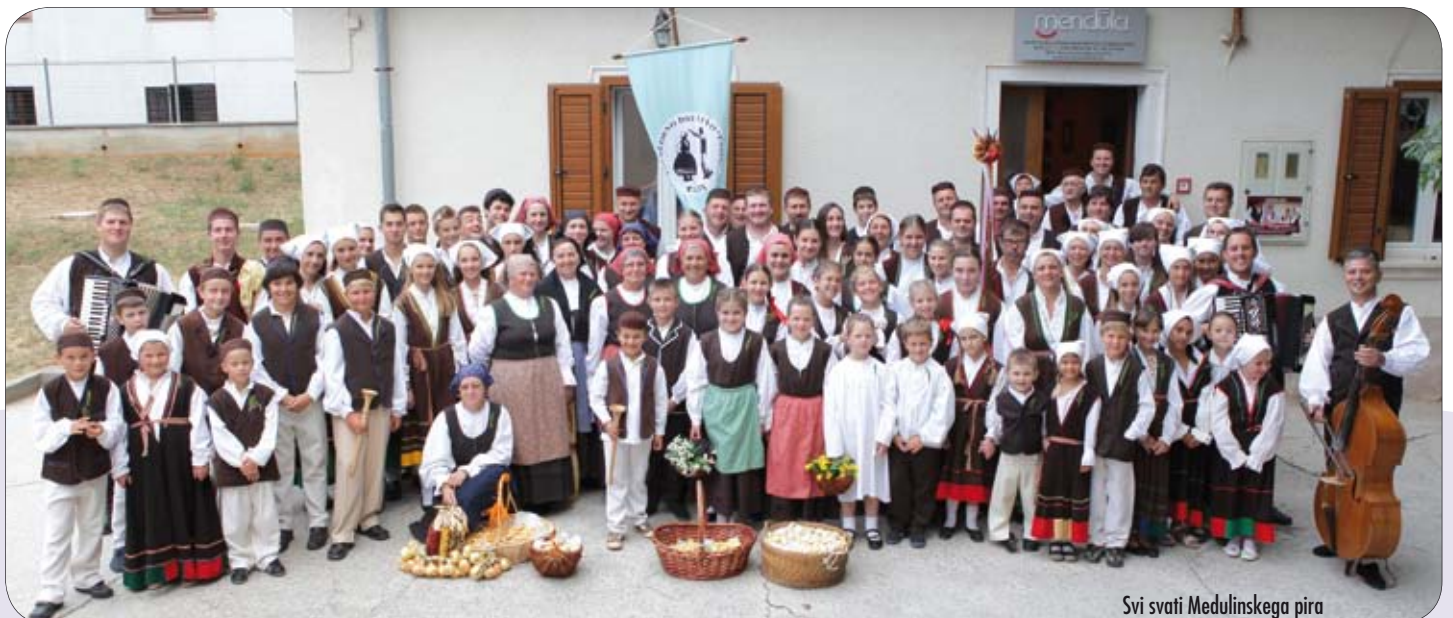
Svi svati Medulinskega pira

Večera sa mladencima nastavila se na rivi, za svadbenim stolom, uz bogatu gastronomsku ponudu autohtonih jela Medulina i Pazina, te veselu pratnju benda Anelidi. Iako je vrijeme kroz cijelu manifestaciju prijetilo kišom, i ove je godine Medulinka donijela osmijeh na mnoga lica i još jednom dokazala da se i u Medulinu, još uvijek može pronaći zajedništvo; a pronaći ga možete u radosnim licima svakoga od dvjesto volontera koji su zdušno pružili ruke jedni drugima i zajednički spleli ovakav događaj, a posebno u očima svih članova DKUS-a Mendula koji su s ponosom svijetu predstavili još jedan projekt iz bogate riznice tradicijske povijesti.