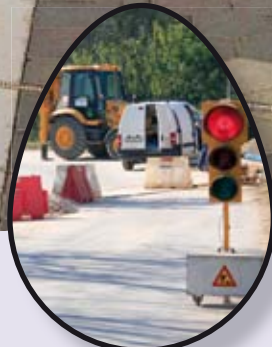
Radovi diljem općine Medulin str. 10-13