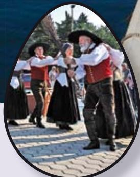
Susret sa slovenskom Općinom Cerklje str. 6-7