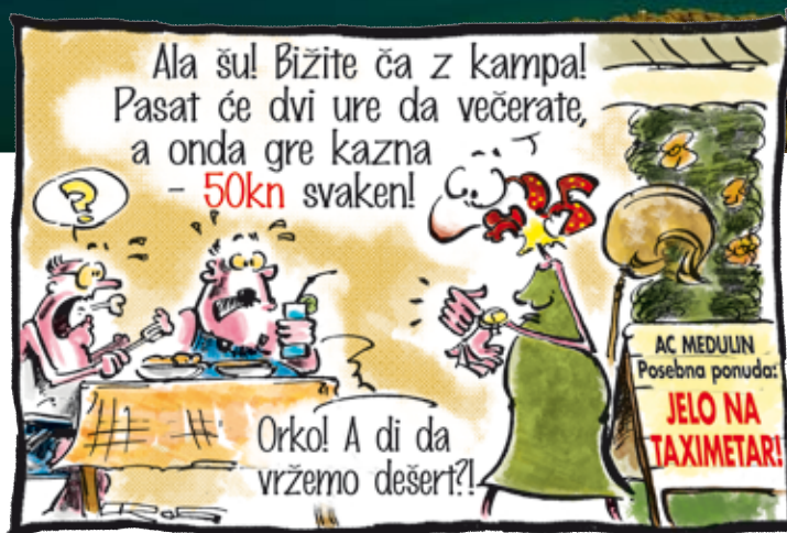
Arenaturist je na razne "kreativne" načine pokušavao ograničiti kretanje domicilnog stanovništva unutar kampova (Skovacera Marija Rosande u Glasu Istre)

postoji još jedan gorući problem za medulinsku općinu, a time i za turizam i za sve mještane, a to je problem kanalizacije. Kao što svi znamo u našoj je općini potrebno izgraditi tri sustava s pripadajućim pročistačima kako bi se zbrinule otpadne vode svih naših naselja. Na svaki od tih pojedinačnih sustava biti će priključen barem jedan objekt Arenaturista. Uređaj za naselje Medulin će, na primjer, biti dimenzioniran tako da pola kapaciteta služi za potrebe mještana, a druga polovica za zbrinjavanje otpadnih voda nastalih u turističkom sektoru. Budući da Arenaturist u tako značajnoj mjeri sudjeluje u opterećenju infrastrukture i da su troškovi za izgradnju ogromni, bilo bi razumno da će Arenaturist susretljivo ući u suradnju s Općinom kako bi na zajedničkoj osnovi dogovorili rokove izgradnje, plaćanja, spajanja objekata i sve ostale detalje. Na opće iznenađenje, stav je Arenaturista da oni ne trebaju platiti niti kune za izgradnju kanalizacije pa niti davanja za priključenje na sustav koji su u njihovom slučaju višemilijunski. Zašto? Jer smatraju da oni imaju riješene svoje sustave i da mogu eventualno simbolički sudjelovati u troškovima izgradnje i održavanja sustava. Iako su vjerojatno svjesni da je čisto more prvi preduvjet