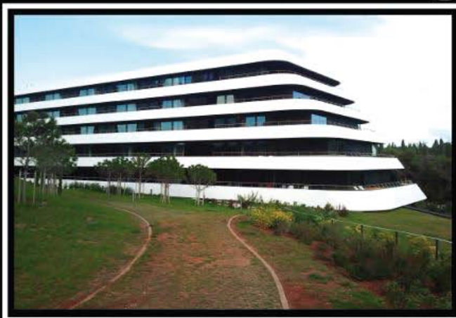
Lone u Rovinju. Pet zvjezdica. Jedan od najluksuznijih hotela na jadranskoj obali koji svojim dizajnom privlači goste dobre platežne moći. Iako niste gost možete se prošetati lijepo uređenom okolicom.