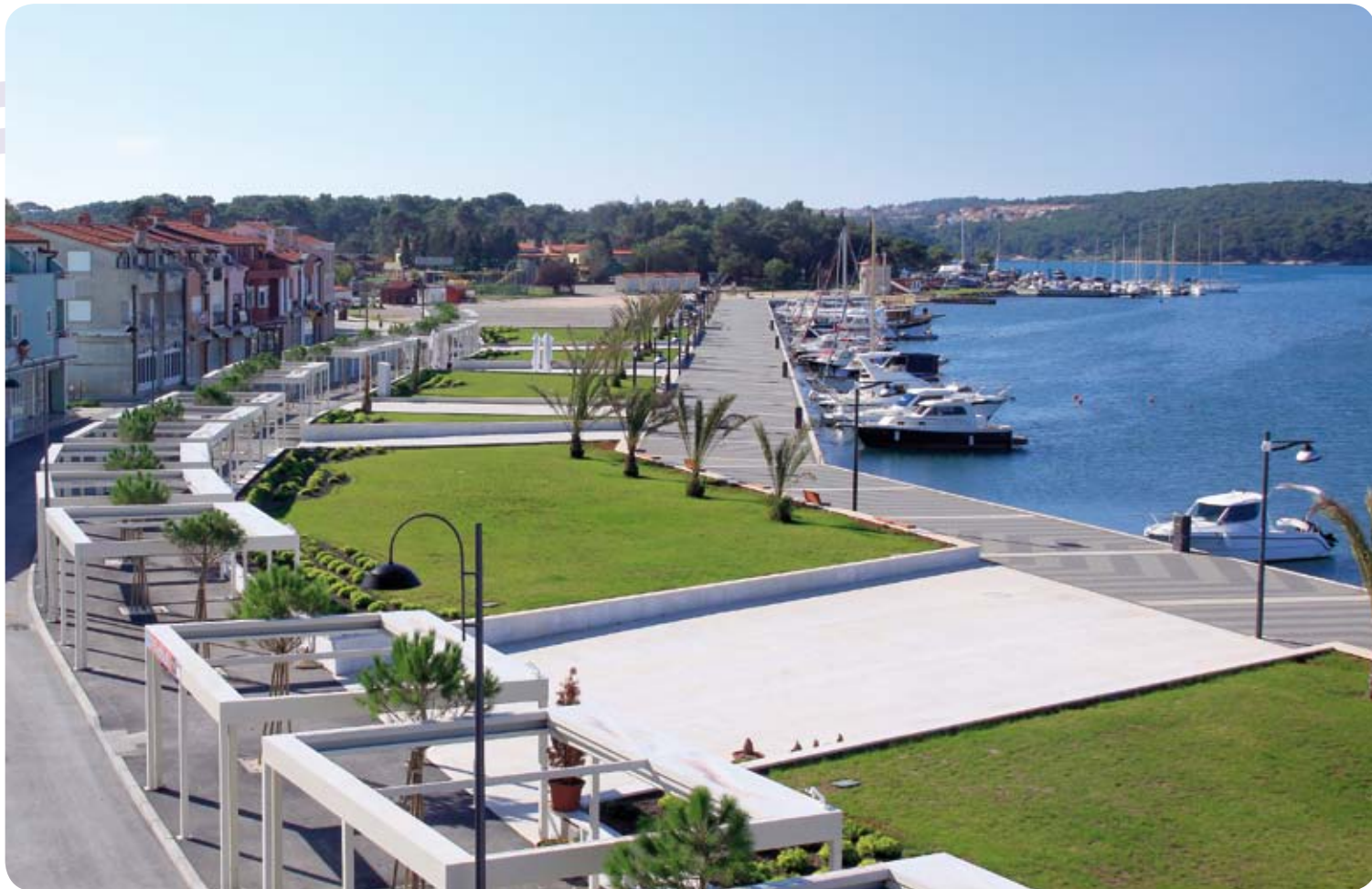
Medulinska riva u novom ruhu

đaja, malu izgrađenost sekundarne mreže naselja Medulin, a sa budućim ispuštanjem na Marleru u normalno more, još slijedećih deset godina po kriterijima EU lokalnom stanovništvu nije potreban dodatni trošak i financijsko opterećenje za pročišćavanje otpadnih voda. Nije izgubljeno vrijeme na analizu isplativosti prvog ili trećeg stupnja pročišćavanja otpadnih voda kao i lokacije ispusta, već se upravo tehno ekonomskom analizom sa predstavnicima Svjetske banke i Hrvatskih voda ukazalo na realno i razumno trošenje sredstava zajma. Ujedno odustajanje od trećeg stupnja pročišćavanja