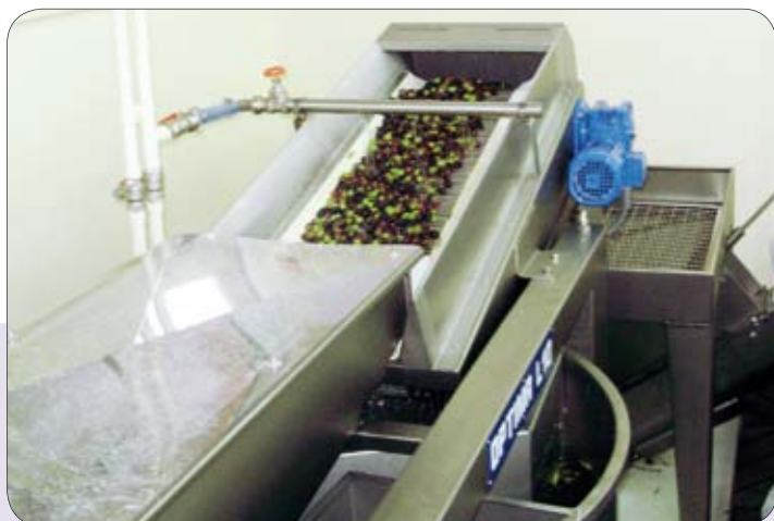
Sustav Pieralisi ugrađen je u banjolsku uljaru