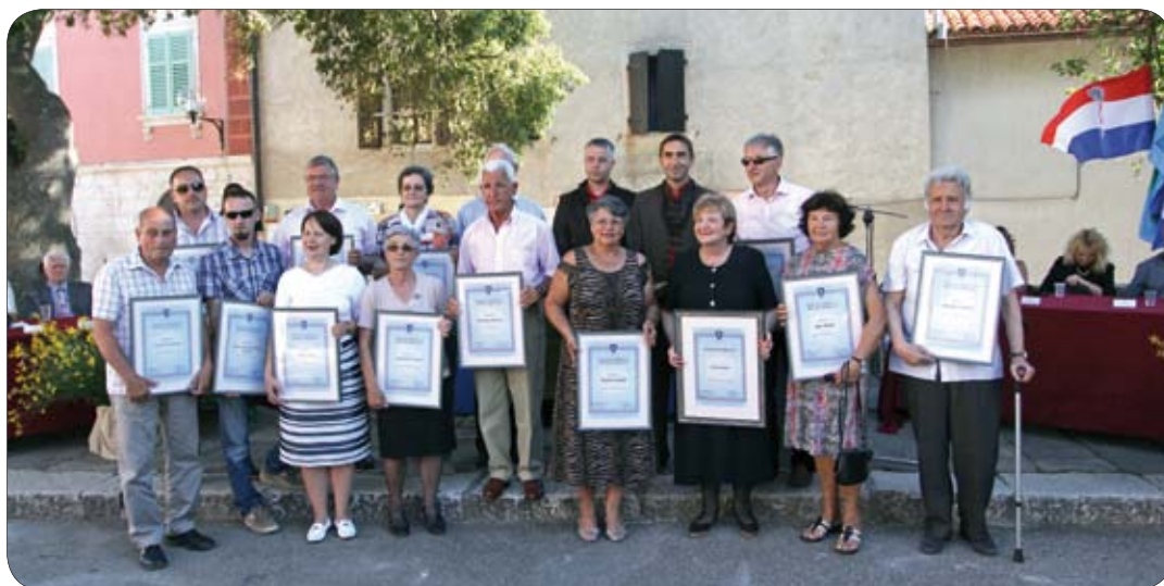
Laureati općinskih nagrada

cijalnom vijeću Općine Medulin, mjesnom odboru Vinkuran i drugim sferama društvenog života Općine.