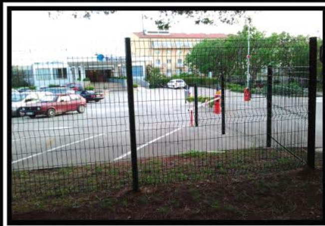
Belvedere u Medulinu. Tri zvjezdice. Neugledan hotel koji je svoje bolje dane imao prije 20tak godina kad se u njemu održavao ples pod maskama. Sve Arenaturist hotele u Medulinu okružuje ograda.