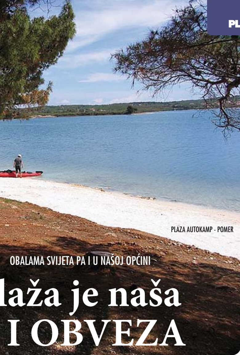
PLAŽA AUTOKAMP - POMER