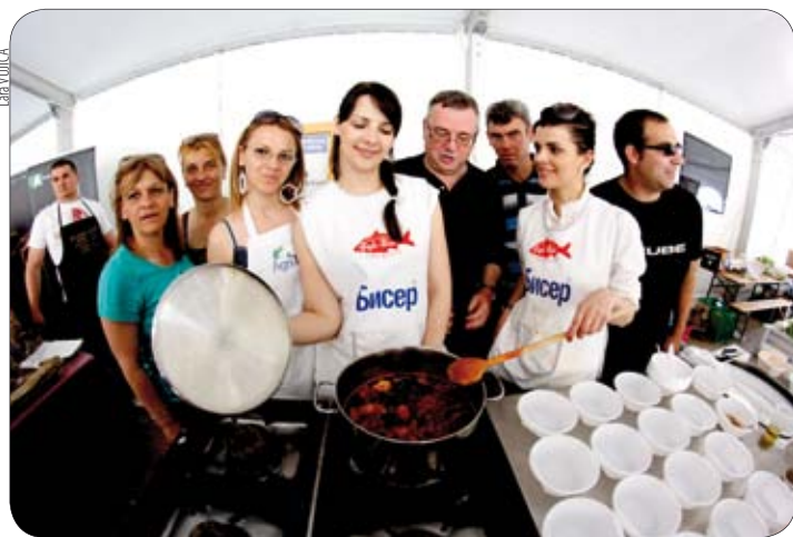
Brudet kuhinja iz Makedonije potpomognuta jakim snagama iz Premanture

Jedan od ciljeva i krana ovog projekta bila je upravo ova završna konferencija i međunarodni festival maslinovog ulja, vina te slanih i slatkih delicija, na kojem su sve partnerske općine predstavile bogatu ponudu svojih tipičnih proizvoda. U sklopu te manifestacije, Općina Medulin i udruga Ulika organizirale su smotru i dodjelu nagrada "ULIKA 2012."