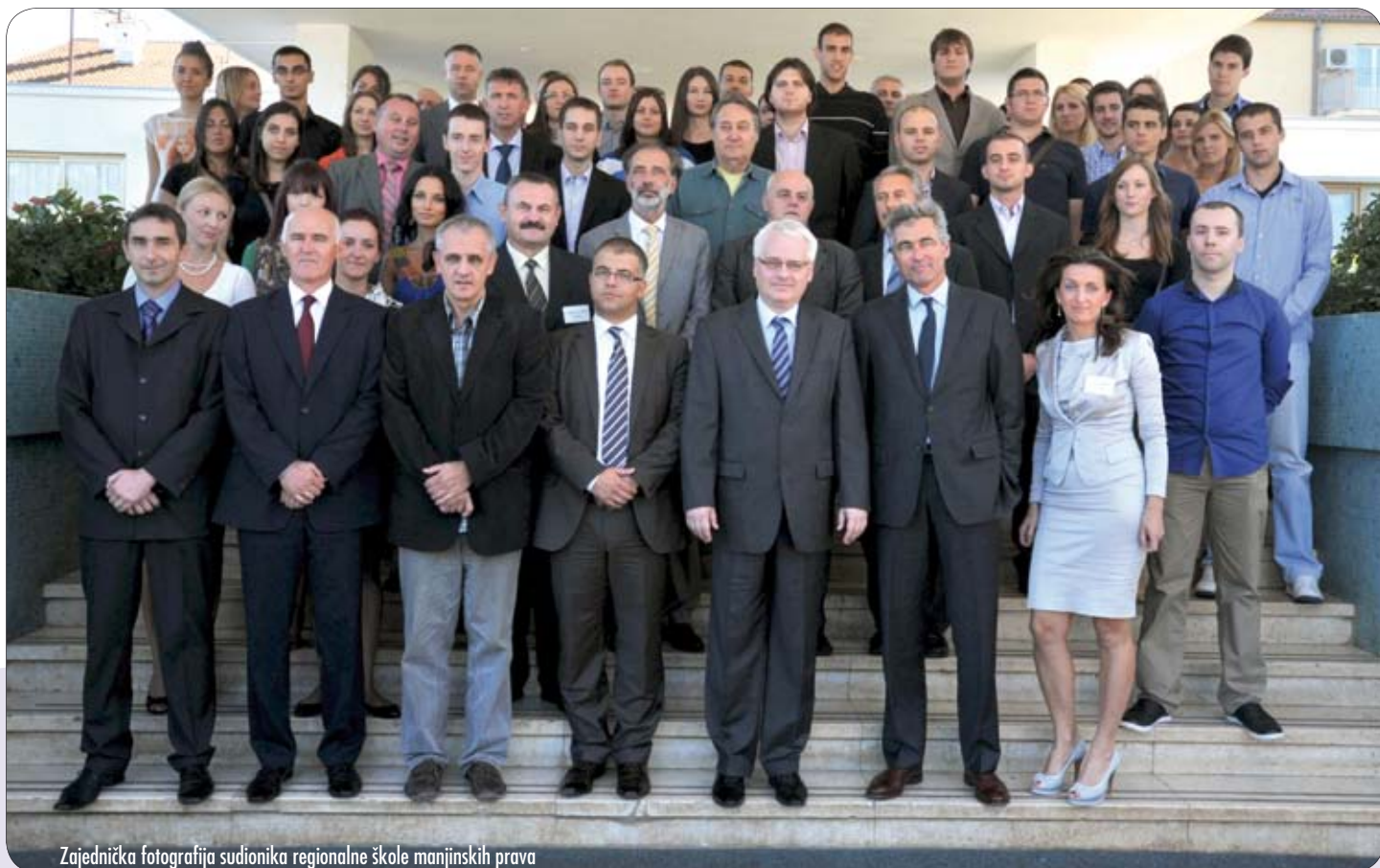
Zajednička fotografija sudionika regionalne škole manjinskih prava

jedan segment širega projekta Vijeća Europe koji ima za cilj unaprijeđenje zaštite prava manjina u jugoistočnoj Europi. Otvorenju škole prisustvovao je predsjednik Republike Hrvatske prof. dr. sc. Ivo Josipović, koji je održao i uvodno predavanje, na temu "Zaštita nacionalnih manjina u Republici Hrvatskoj i regionalna suradnja".