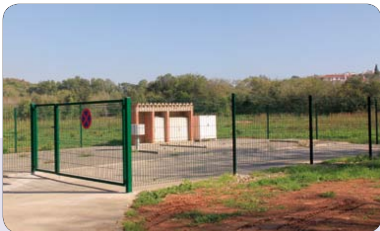
Ograđena je crpna stanica u Kanaliću

% procjenjene vrijednosti radova. Proveden je postupak javne nabave za radove, radovi bi mogli početi koncem listopada.