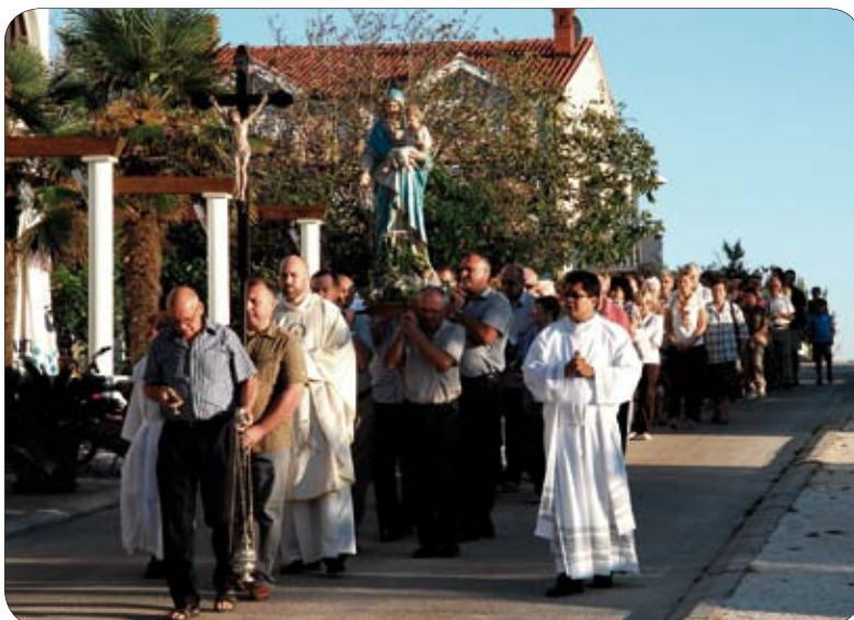
Procesija kroz Banjole

U subotu, 8. rujna ove godine slavilo se rođenje blažene Djevice Marije. Njeno rođenje bilo je početak našeg spasenja. Marija je došla na ovaj svijet da nama daje Krista koji nam pokazuje put spasenja. On je put koji vodi u vječno blaženstvo. Ona je uspostavila put između neba i zemlje. Baš nju je među svim ženama vječna Božja mudrost odabrala da po njoj utjelovljuje začetnika i dovršitelja našega spasa. Ona je zora našeg spasenja. Slaveći Marijine blagdane mi produbljujemo svoju vjeru i ulazimo u