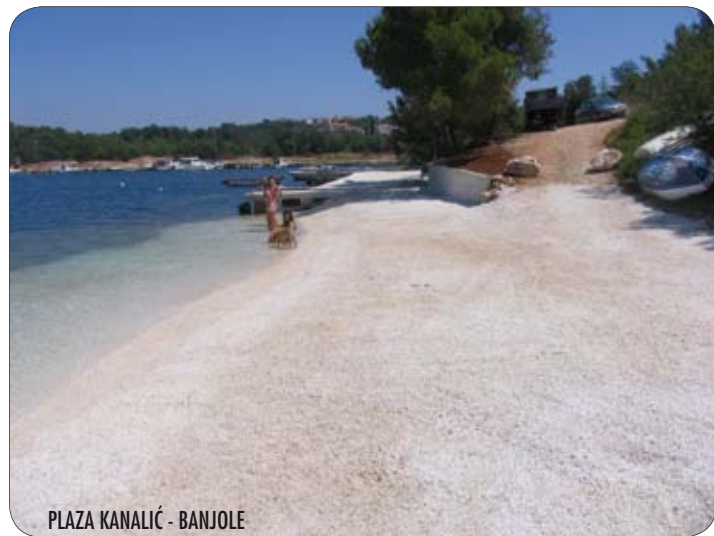
PLAŽA KANALIĆ - BANJOLE

ja. To je veoma bitno, pogotovo kad se svakodnevno pojavljuju i privatni investitori spremni ulagati u taj segment od vitalne važnosti za našu općinu. Tako smo započeli nešto bez čega se neće moći razvijati turizam u našoj općini. Ovo je onaj minimum za poboljšanje uvjeta na našim plažama. No, potrebno je izraditi i složeniju projektnu dokumentaciju, višeg stupnja, za pojedine vitalne dijelove našeg priobalja. Tu prvenstveno mislim na nekoliko prekrasnih uvala, za koje se mora izraditi