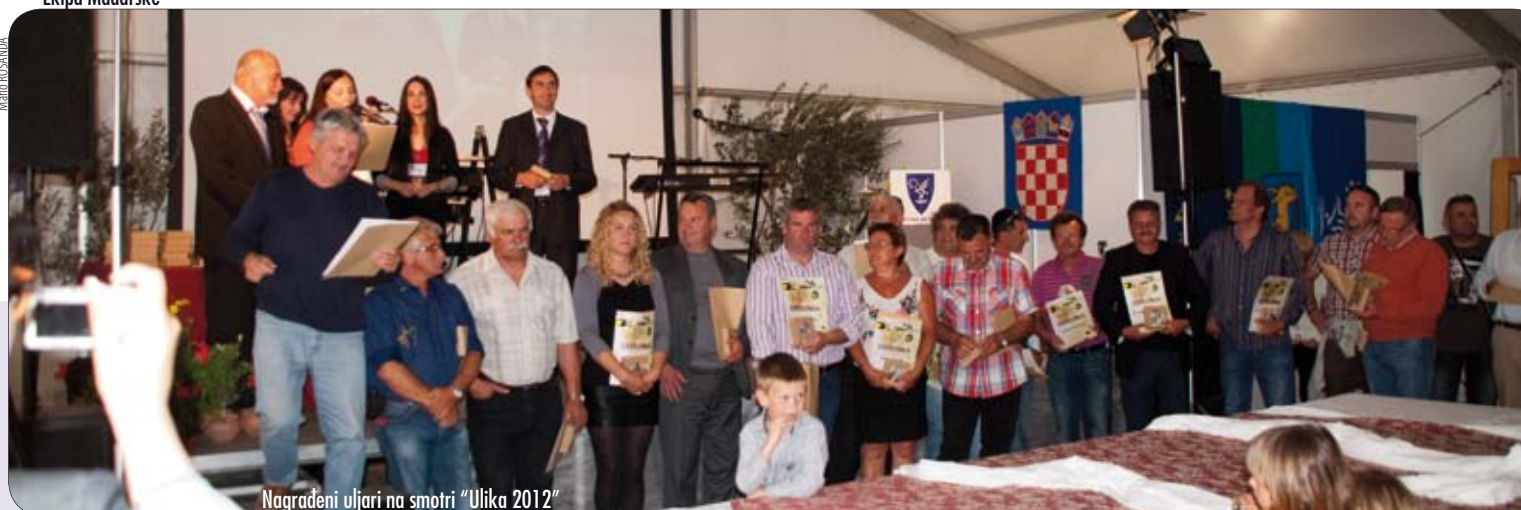
Nagrađeni uljari na smotri "Ulika 2012"

Zanimljivost za sve posjetitelje svakako je bilo natjecanje u pripremi brodeteta među općinama-partnerima, a svojevrsna je atrakcija manifestacije definitivno bila kad su se načelnici četiriju pobratimljenih općina natjecali u pečenju palačinki. Sve u svemu, Općina Medulin pripremila je vrlo bogat kulinarski program te vrhunske domaće i strane gastro i eno specijalitete za sve posjetitelje festivala AGRI TWIN, koji će zasigurno postati tradicionalni događaj.