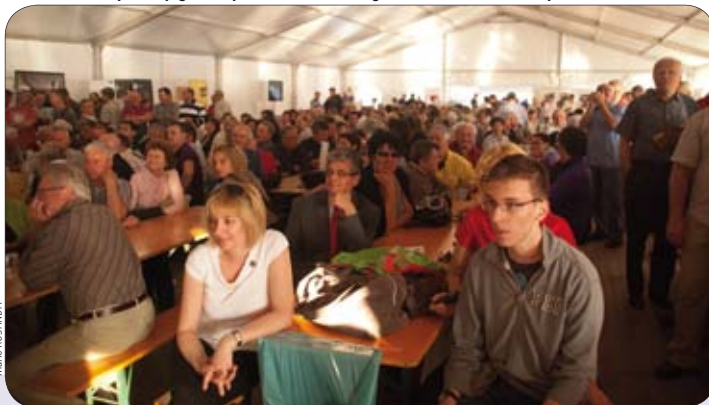
Mnogobrojna zadovoljna publika i sudionici Agri Twina

Početak svibnja Općina Medulin organizirala je završnu konferenciju projekta AGRI TWIN, na kojoj su se okupili svi partneri (predstavnici općina Marcali iz Mađarske, Montecarotto iz Italije, Dojran iz Makedonije) te predstavnici Općine Medulin. Puni je naziv projekta “Razvoj poljoprivrede kroz regionalno i lokalno sudjelovanje u međunarodnim inicijativama – bratimljenje gradova”, a cilj mu je tematsko umrežavanje i bratimljenje općina na području četiri države (Italija, Mađarska, Makedonija i Hrvatska).