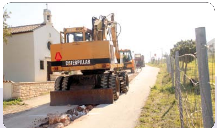
I u Volmama se gradi vodovodna mreža