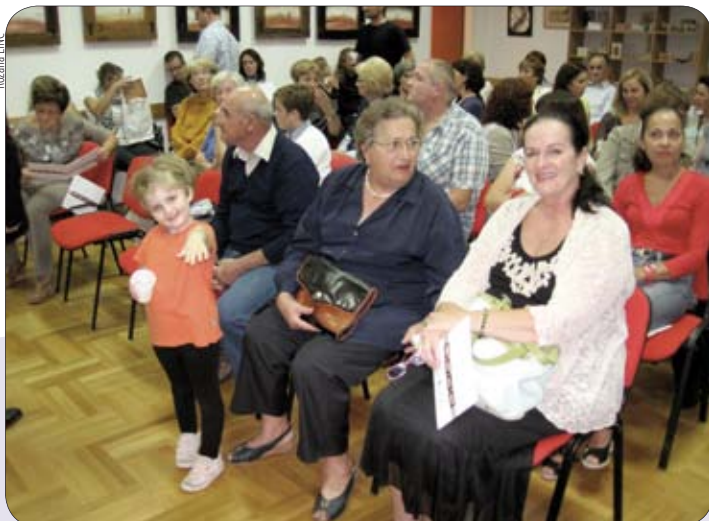
Na vinkuranskim kulturnim večerima odaziv publike je uvijek odličan

Na koncu, slikar Mario Rosanda predstavio se sa ciklusom slika Kamfor 2, a koji je ovoga ljeta predstavljen i u medulinskoj galeriji Loža.