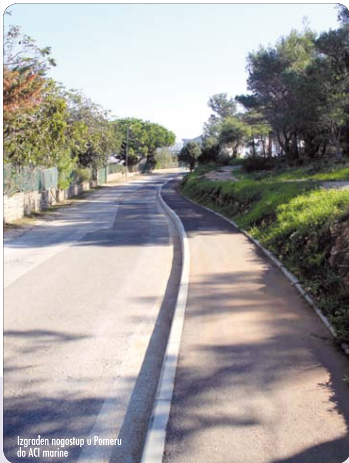
Izgrađen nogostup u Pomeru do ACI marine