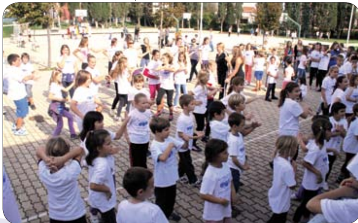
Slovenski školarci u Medulinu

Treći dio bio je namijenjen najstarijim mještanima općina, s ciljem da se upoznaju, razmjenjuju aktivnosti, podijele iskustva o provođenju slobodnog vremena, o tome kako biti