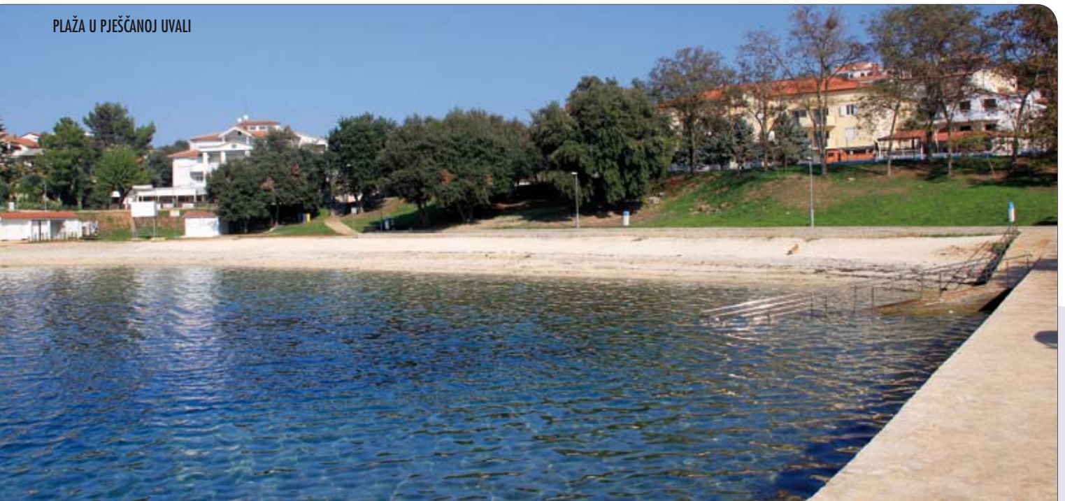
PLAŽA U PJEŠČANOJ UVALI

Naša je obaveza, da sve mjesta i dijelovi naselja imaju uređene plaže, kako zbog samih mještana, tako i turista koji su velik i značajan faktor u očuvanju standarda velikog djela naših mještana koji se bave turizmom. Uskoro ćemo objaviti i popis novih plaža za koje će se izraditi projektna dokumentacija. To je veoma bitno, pogotovo kad se svakodnevno pojavljuju i privatni investitori spremni ulagati u taj segment od vitalne važnosti za našu općinu