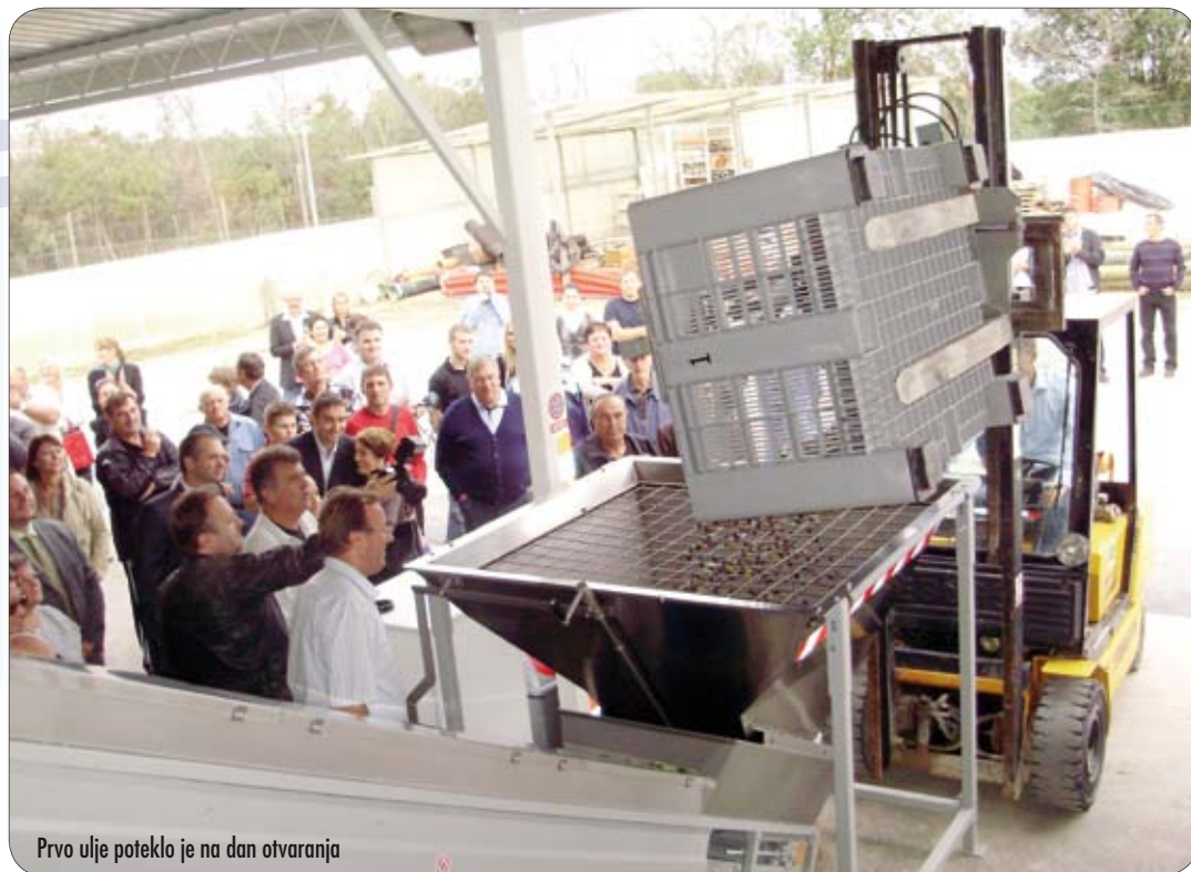
Prvo ulje poteklo je na dan otvaranja