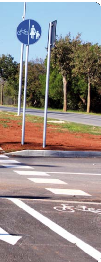
Novoizgrađena pješačko biciklistička staza u Banjolama

selja Premantura od Volte do špine u iznosu od 145.852 kuna kao i remont crpne stanice Stupice s popravljenim difuzorom u moru. U sklopu Projekta Jadran Svjetska banka i Hrvatske vode prihvatili su projektiranje i izgradnja uređaja za pročišćavanje otpadnih voda prvog stupnja zajedno sa podmorskim ispustom na Glavici.