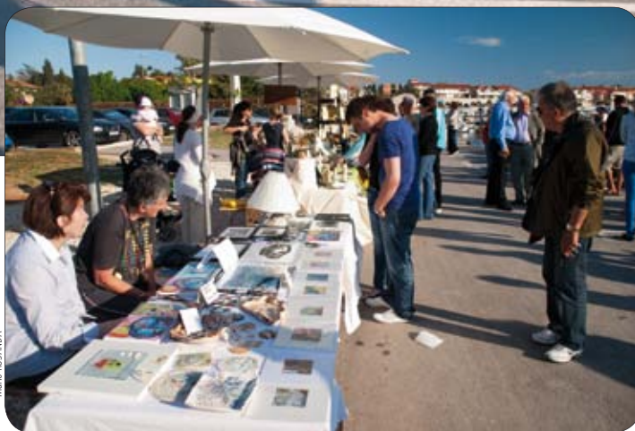
U šatoru i ispred njega odvijala se raznovrsna gastro i kulturna zbivanja