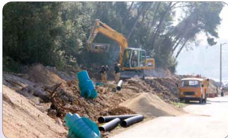
Radovi na sustavu odvodnje u Vinkuranu