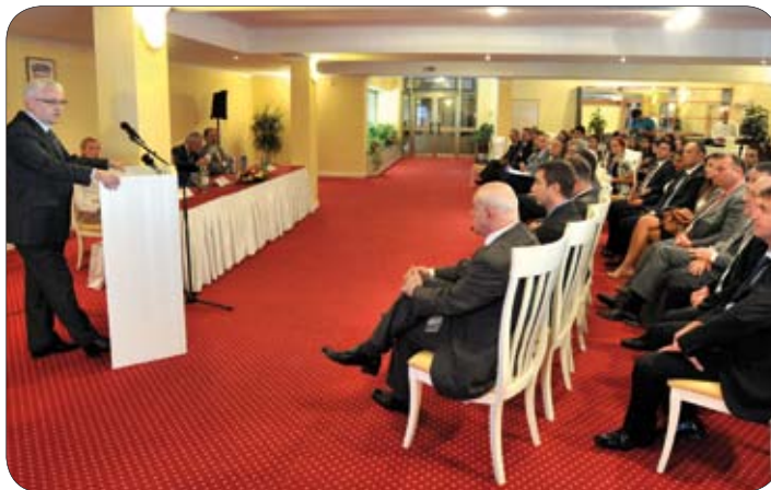
Regionalnu školu otvorio je predsjednik RH Ivo Josipović

S radom je završila treća Regionalna škola manjinskih prava koju je organizirao Centar za međunarodne i sigurnosne studije Fakulteta političkih znanosti Sveučilišta u Zagrebu u suradnji sa Vijećem Europe. Sedmodnevni rad 60 studenata i profesora fakulteta političkih znanosti iz Beograda, Banja Luke, Podgorice i Zagreba, Pravnog fakulteta iz Zagreba, Fakulteta društvenih znanosti iz Ljubljane, kao i mladih pripadnika manjinskih zajednica u Republici Hrvatskoj, rezultirao je preporukama koje će u formi zaključaka biti upućeni političkim institucijama zaduženim za zaštitu nacionalnih manjina država sudionica. U završnoj deklaraciji naglašena je važnost daljnjeg unaprijeđenja regionalne suradnje, a posebice u području ljudskih prava i zaštite prava nacionalnih manjina. Uz uvažavanje znatnog napretka koji je postignut u prethodnom