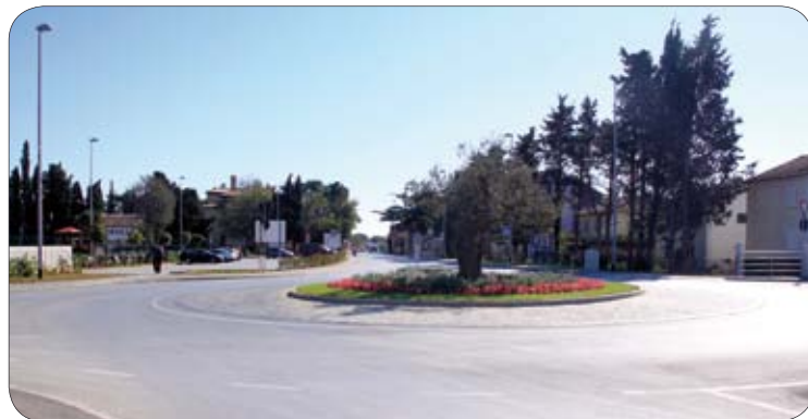
Novouređeni Medulinski rotor

Izvedeni su radovi na izgradnji III faze prometnice Nova lokva u Medulinu. Po dovršetku građevinskih radova na izgradnji kružnog toka na ulazu u Medulin s prometnicom i parkiralištem izvedeno je i hortikulturno uređenje kružnog toka i ostalih zelenih površina, ulaz u Medulin u potpunosti se izmijenio i sada izgleda lijepo i