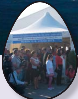
Završna konferencija projekta EU Agri Twin str. 2-3