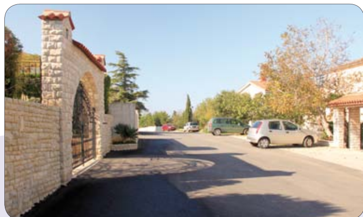
Na Kaštanježu asfaltirana je nova prometnica s oborinskom i fekalnom kanalizacijom