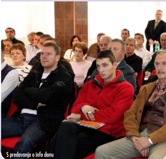
S predavanja o info danu