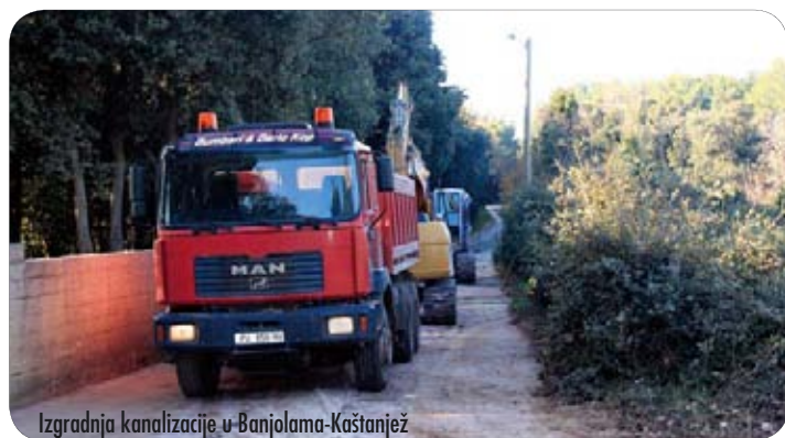
Izgradnja kanalizacije u Banjolama-Kaštanjež