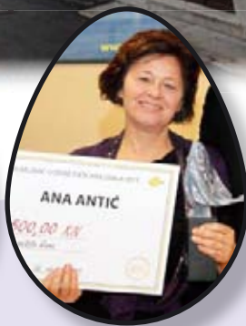
MEDULINSKA RIVIJERA str. 15