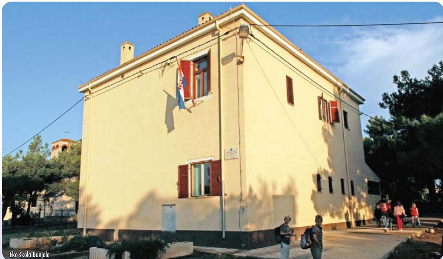
Eko škola Banjole