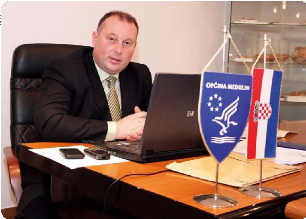
Enco Crnbori - Mjesni odbori, međunarodna suradnja i informiranje