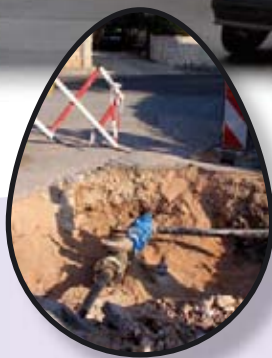
KOMUNALNE AKCIJE str. 4-5