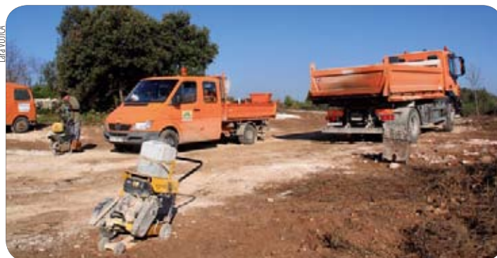
Vinkuran Cota vodovod

U Pomeru smo ujesen uredili prilaz i veliki dio zaleđa buduće plaže na Mući. Ispianirana je i nasuta buduća šetnica od sela do marine, u dužini od cca. 320 m, očišćeni pokosi i posadeno grmoliko raslinje. U centru su uređeni nogostupi, kao i odvodni kanali za oborinske vode u parku iza marketa, posadene su ukrasne sadnice te uređena rasvjeta i oluci na sjenici na puču. Izgrađeno je nekoliko zelenih otoka i zajedno s Hrvatskim šumama posadeno 50-ak pinija na Muntižjeji. Uz donaciju TZ-a, izrađena je replika mozaika