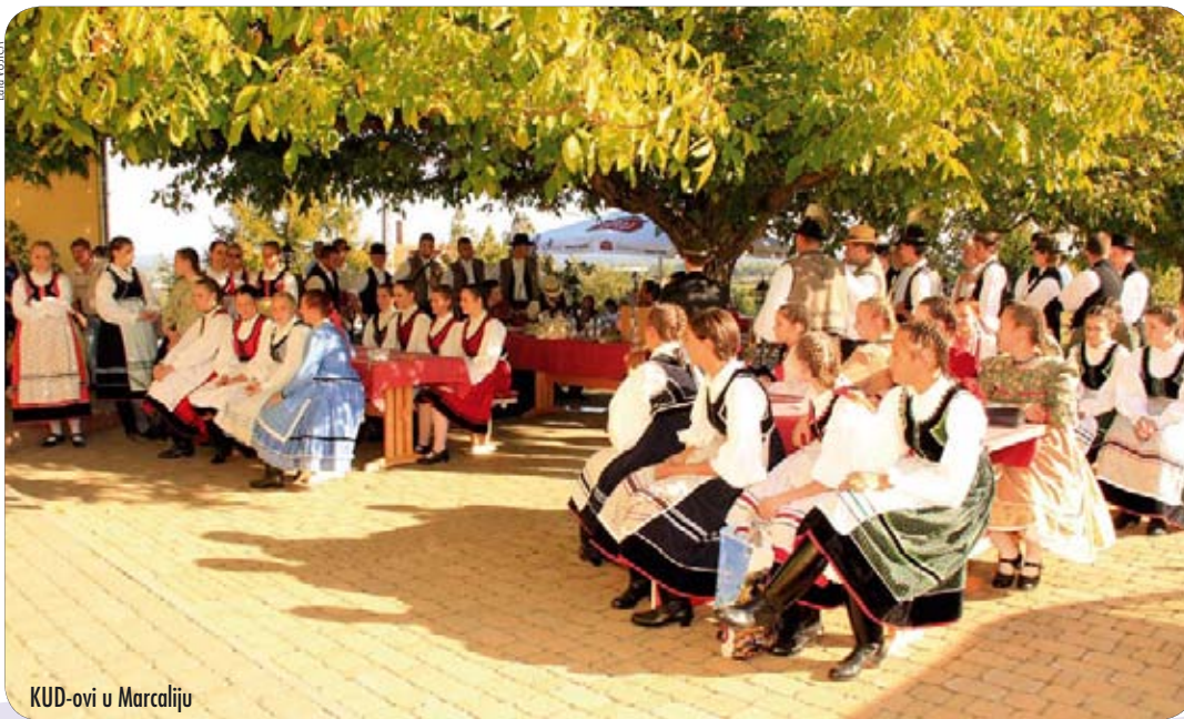
KUD-ovi u Marcaliju

sorti grožđa i sve su partnerske delegacije sudjelovale u kušanju vina. U večernjim satima je u samom vinskom podrumu Varga, Badacsony, organizirana i večera.