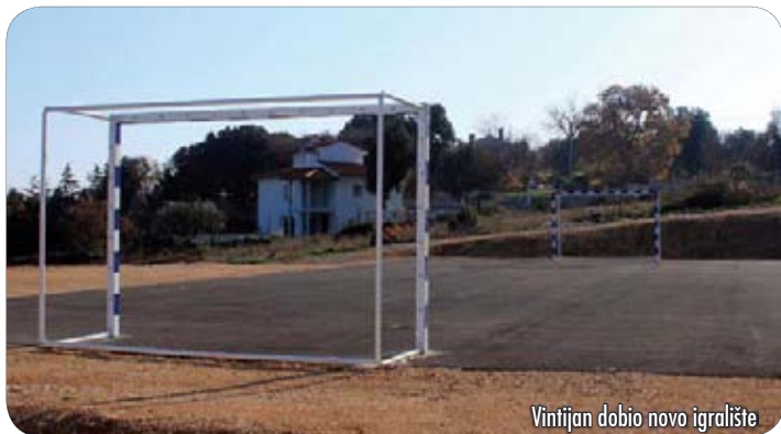
Vintijan dobio novo igralište