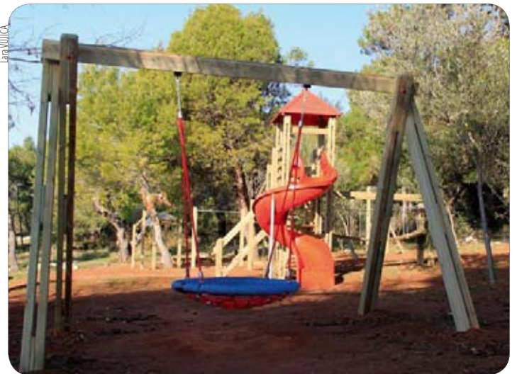
Igralo u Pomeru

Postavljanje ovih igrala rezultat je sinergije mjesnih odbora, Turističke zajednice i Općine Medulin, a to ujedno predstavlja i dobar početak za buduće uređivanje zelenih površina na području medulinske općine.