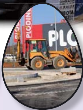
RADOVI U OPĆINI str. 8-9