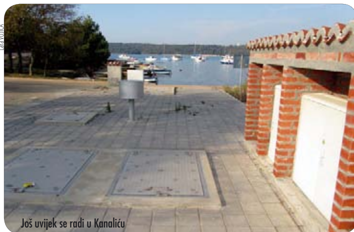
Još uvijek se radi u Kanaliću

- Naši djelatnici će postaviti baje u koje će se točno znati što se odlaze te će se posebno odla-