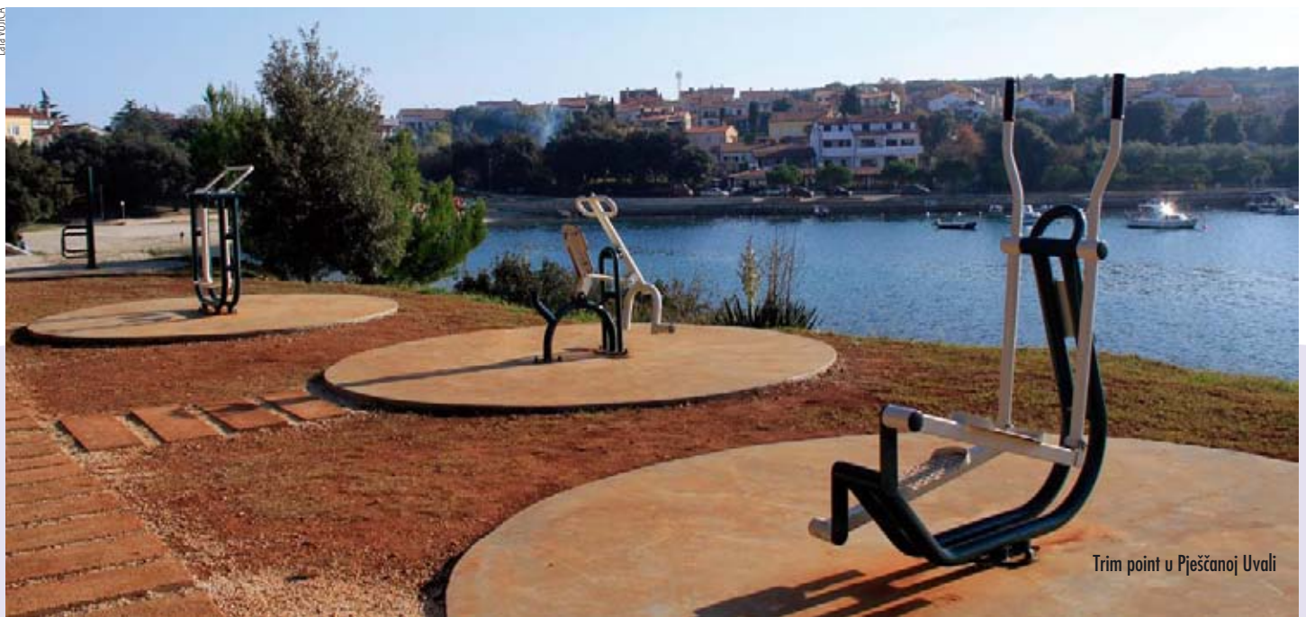
Trim point u Pješanoj Uvali