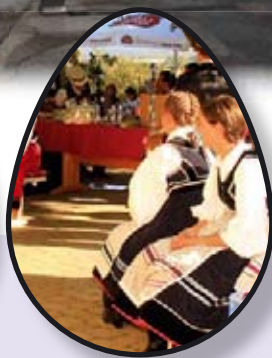
AGRI TWIN str. 10-11