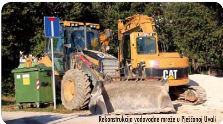
Rekonstrukcija vodovodne mreže u Pješčanoj Uvali