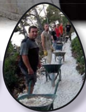
UDRUGE str. 20