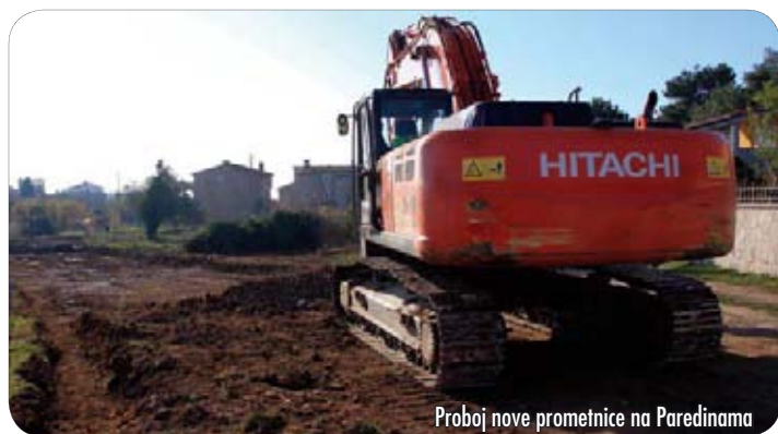
Proboj nove prometnice na Paredinama

osigurano 4,5 mil. kuna. Radovi će početi tijekom prosinca te će medulinska riva sljedeću turističku sezonu dočekati u novom ruhu. Uređenje obuhvaća gradnju oborinske kanalizacije, postavljanje javne rasvjete, popločavanje površina za ugostiteljske terase te hortikulturno uređenje.