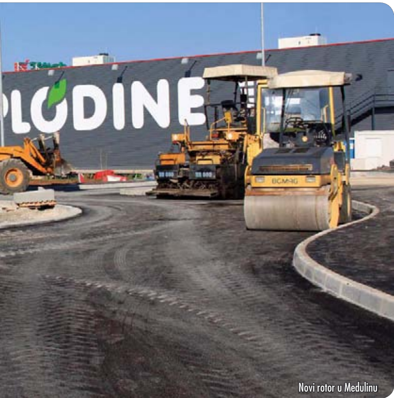
Novi rotor u Medulinu

Izradu plana financira vlasnik nekretnina na području njegova obuhvata – ondje se planira izgradnja dizajn-hotela maksimalnog kapaciteta 200 postelja