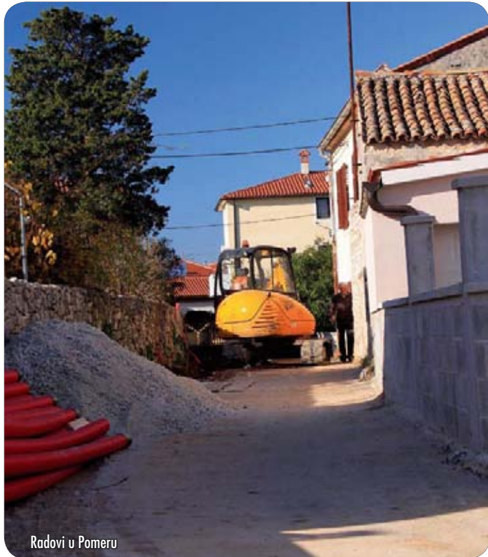
Radovi u Pomeru