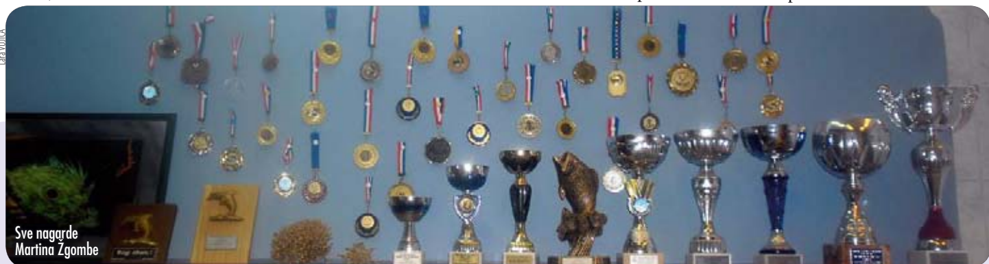
Sve nagrade Martina Žgombe

Zadnje natjecanje na kojem je sudjelovao bilo je ono u Ičićima. Kući se vratio s medaljom za 1. mjesto pojedinačno, medaljom i peharom za 1. mjesto ekipno te prijelaznim peharom za klub, ali i posebno sretan zato što je nakon natjecanja živa riba vraćena u more. Zna mali moru moraš nešto vratiti da bi ti ono puno dalo.