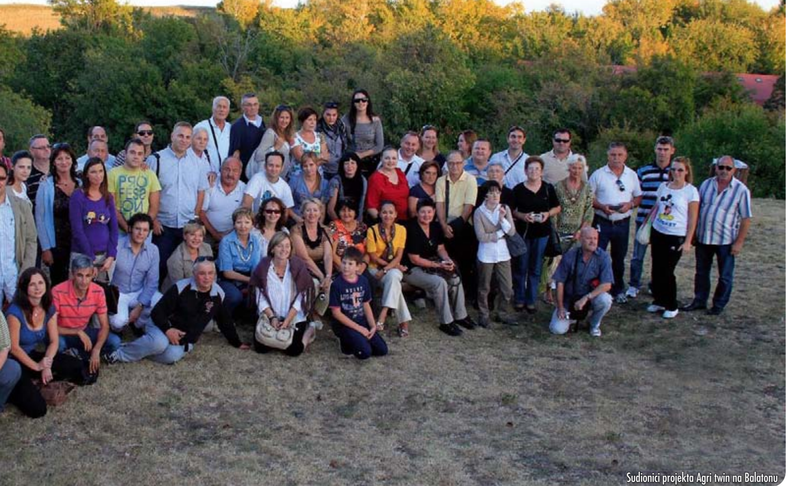
Sudionici projekta Agri twin na Balatonu