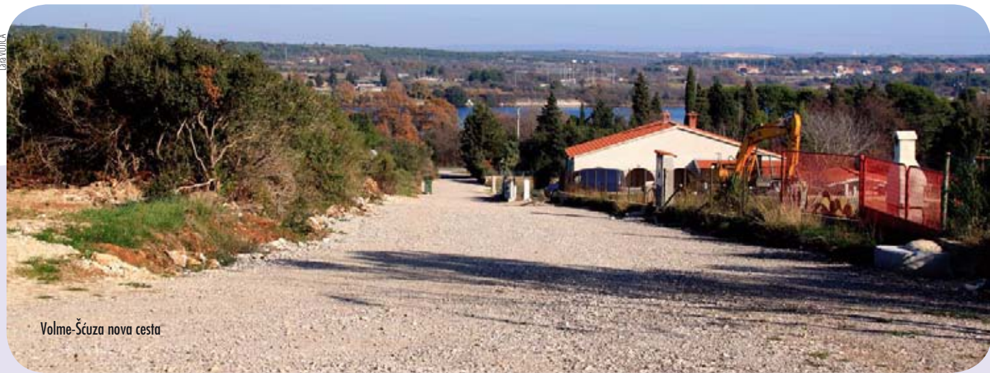
Volme-Šćuza nova cesta

U Vinkuranu su uređeni nogostupi i zelene površine, s novim zelenim otocima oko Puljankine trgovine. Nažalost, situacija je takva da Puljanka nije mogla sudjelovati u uređenju tog prostora, no dobra volja još je prisutna pa se nadamo boljoj suradnji za sljedeću sezonu. Izgradnjom sportske lučice Vinkuran je izgubio svoju jedinu