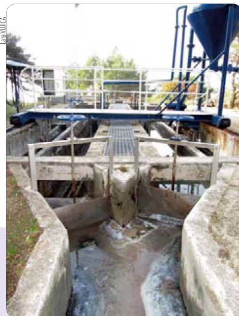
Otpadne vode izlaze u more pročišćene

U travnju ove godine Hrvatske vode, Albanež i Općina Medulin potpisali su ugovor o podzajmu i poddarovnici za podprojekt Medulin, koji je težak 59 milijuna kuna. Radi se o izgradnji pročištača na Marleri, sa svom prapratnom infrastrukturom, opremanju crpne stanice Kažela, izgradnji gravitacijskih vodova naselja Vinkuran i projektiranju uređaja za naselja Premantura i Banjole. Ovih dana će se regulirati ostali dokumenti vezani uz zajam s poslovnim bankom, a u međuvremenu se