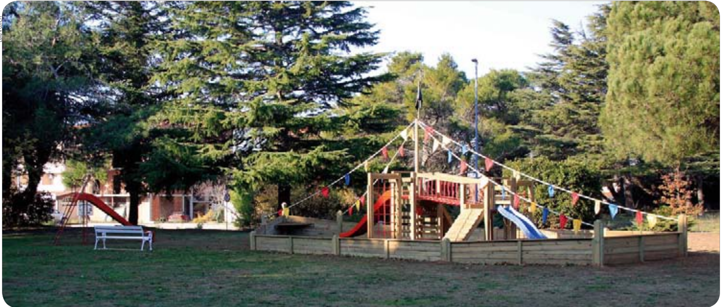
Igralo u Medulinu

Mjesni odbori Medulina I. i II. te Pomeru odabrali su igrala za djecu, koja su početkom studenog i postavljena. Uz suradnju Općine Medulin, dječja igrala nabavila je općinska Turistička zajednica.