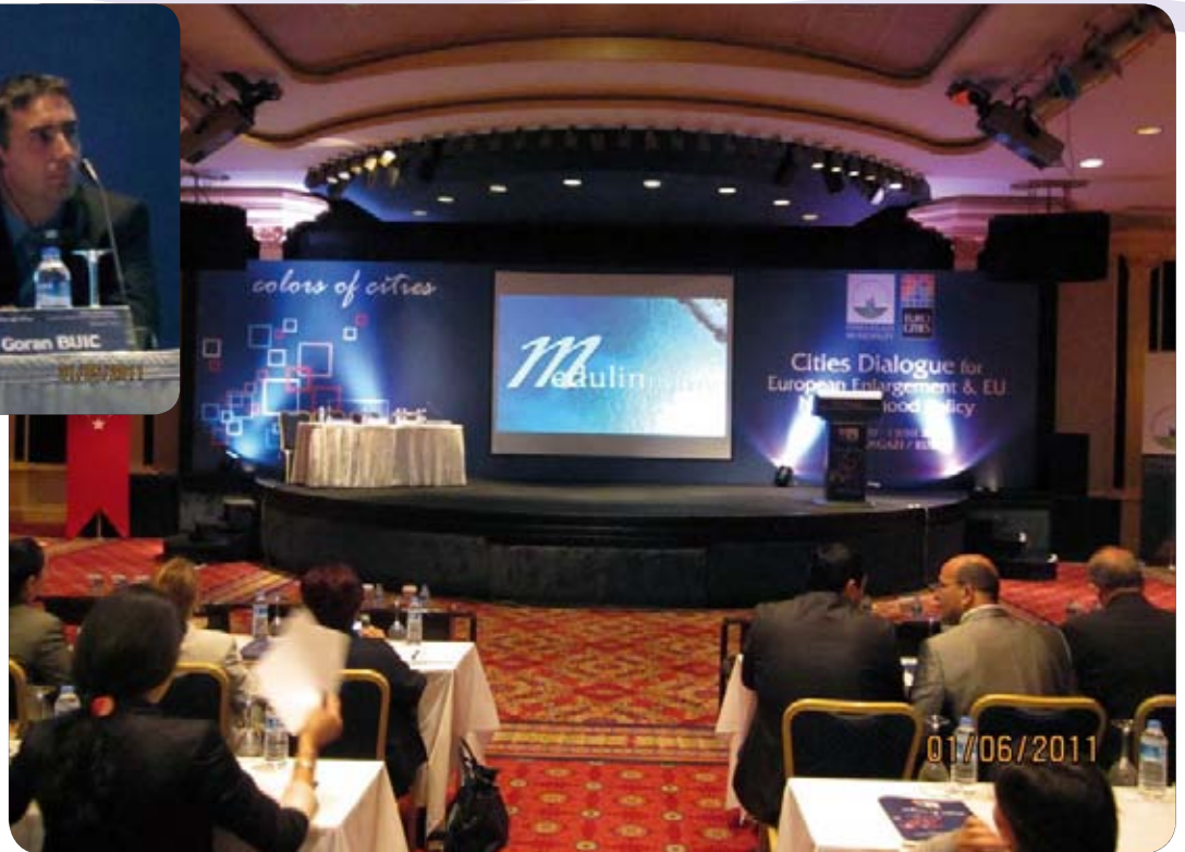
Sa skupa načelnika u Turskoj

Na seminaru sam na engleskom jeziku izlagao o sljedećoj temi: "Što hrvatska lokalna uprava očekuje od članstva u EU-u?". Ujedno je sudionicima skupa prezentirana općina Me-