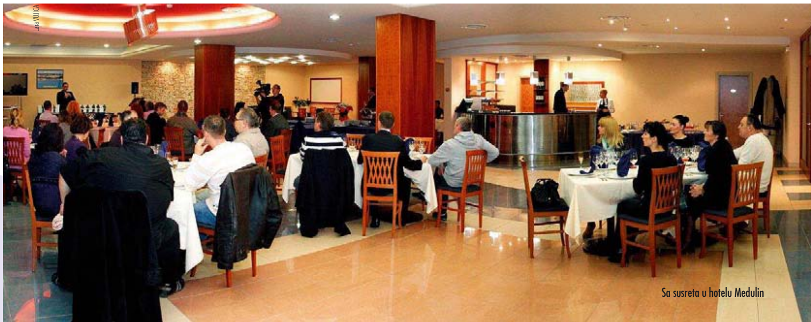
Sa susreta u hotelu Medulin