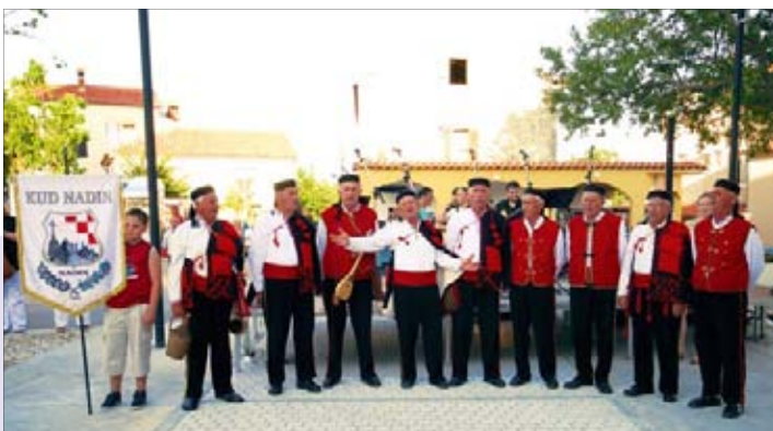
Članovi KUD-a Nadin