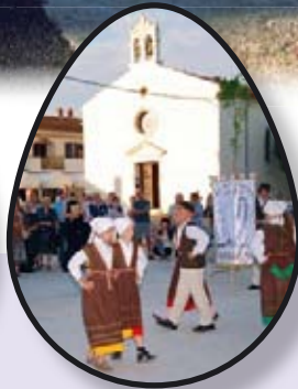
DAN OPĆINE str. 8-11