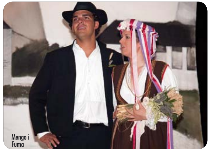
Mengo i Fuma

Predstava "Fuma i Mengo, galižanski mladić a medulinska nevista" traje oko 45 minuta, a cijela fešta od večeri do jutarnjih sati. U nekoliko scena (start kamp/vjetrenjače) kreće se svatovska povorka koju čini 40-ak članova KUD-a Zajednice Talijana "Armando Capolicchio" u narodnim nošnjama. Članovi DKUS-a Mendula u narodnim nošnjama s druge strane (start placa, SAD, Mižerija) kreću u šetnju selom i pripremaju mladu za udaju