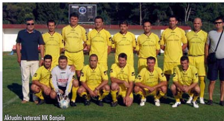
Aktualni veterani NK Banjole