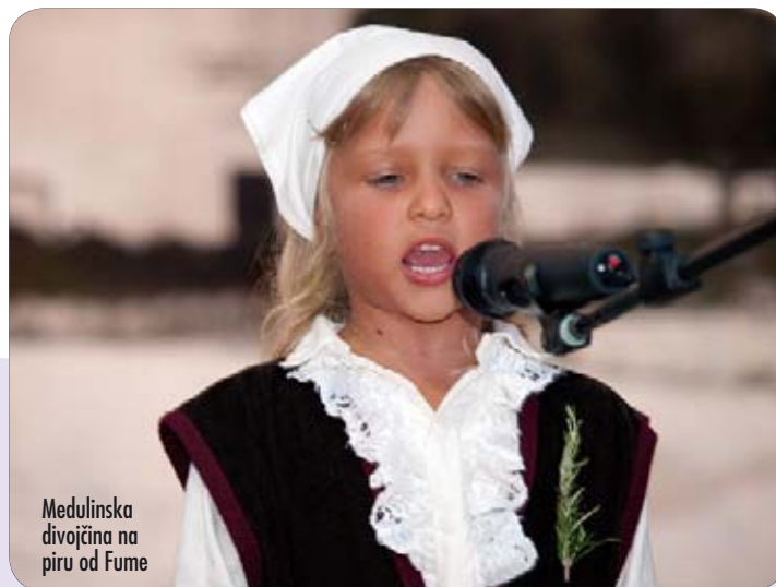
Medulinska divjčina na piru od Fume

dođu na pir. Pjeva se i pleše na tri mjesta po selu. Uz zvukove sopela, miha, kanta na tanko i debelo, obilje dijaloga nosilaca uloga na starom lokalnom čakavskom govoru, uz vrlo bliski kontakt s publikom, prati se scena dolaska, odijevanja i prošnje Fume (sve na pozornici). Fuma je Medulinka, a Mengo Galižanac. Galižanci dolaze po nevistu! Na pozornici je uz dobrog voditelja na stranim jezicima objašnjena priča i miješanje običaja iz unutrašnjosti i obale s natjecanjem. Medulinci ne daju mladu i izazivaju Galižance na ples i pjesmu. Najprije plešu Medulinci, a onda Galižanci. Pjevaju Medulinci pa Galižanci... Stari svat nakon pregovaranja s obje strane spaja Fumu i Menga i čin vjenčanja je gotov. Baca se svadbeni kolač... Svi članovi ispraćaju mladence uz pjesmu na batanu i ribar ih vozi u bračne vode. Svi pokazuju svoje i svi su zanimljivi i važni. Glazbeno-scensko djelo zahtijeva dobro znanje specifičnog sviranja izvornih narodnih istarskih instrumenata te plesa i pjevanja na tanko i debelo.