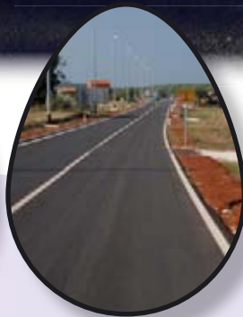
POMERSKA ZAIBILAZNICA str. 6