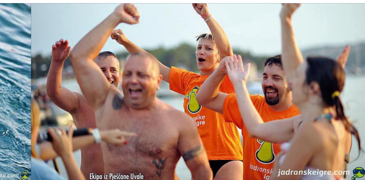
Ekipa iz Pješčane Uvale

Nastavak druženja s “Jadranskim igrama” održan je 17. kolovoza u Banjolama, u sklopu hotela Del Mar. Zahvaljujući domaćinstvu i svesrdnoj pomoći vlasnika tog hotela bilo je moguće realizirati ovaj događaj, na kojem su nam se priključile ekipe iz Fažane, Lovrana, Petrovije, Matulja, Rijeke i Umaga. Odličan ambijent i mnogobrojna publika doprinijeli su pravoj atmosferi na borilištu. U morskom i kopnenom dijelu održano je pet igara, a ekipa Pješčane Uvale nažalost nije skupila dovoljan broj bodova za plasman u polufinale. No, bez obzira na rezultat, ostalo je slatko sjećanje na lijepu avanturu uz “Jadranske igre” i obećanje organizatora da će i dogodine posjetiti medulinsku općinu.