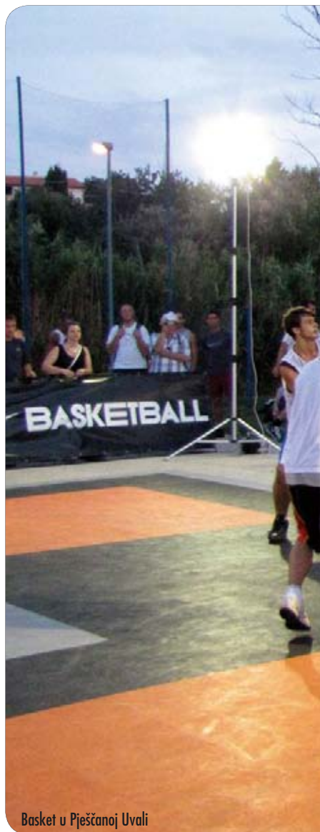
Basket u Pješćanoj Uvali

tima te okuplja veliki broj dobrih ekipa u natjecanju koje ima svoju posebnu draž i svakako je značajno iskustvo za sve sudionike. Basket Tour poznat je po svom fenomenalnom show-programu. Dugogodišnja suradnja s najboljim hrvatskim breakdancerima i plesnim skupinama i ove se sezone pokazala uspješnom. Na turniru u Pješćanoj Uvali nastupila je odlična riječka plesna skupina Renegades crew.