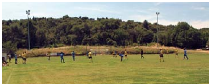
Na nogometnom terenu u Banjolama održan je i turnir u nogometu

donatorima, tom su prilikom izložene 22 slike poznatog slikara, koje su krajem ljeta vraćene vlasnicima.