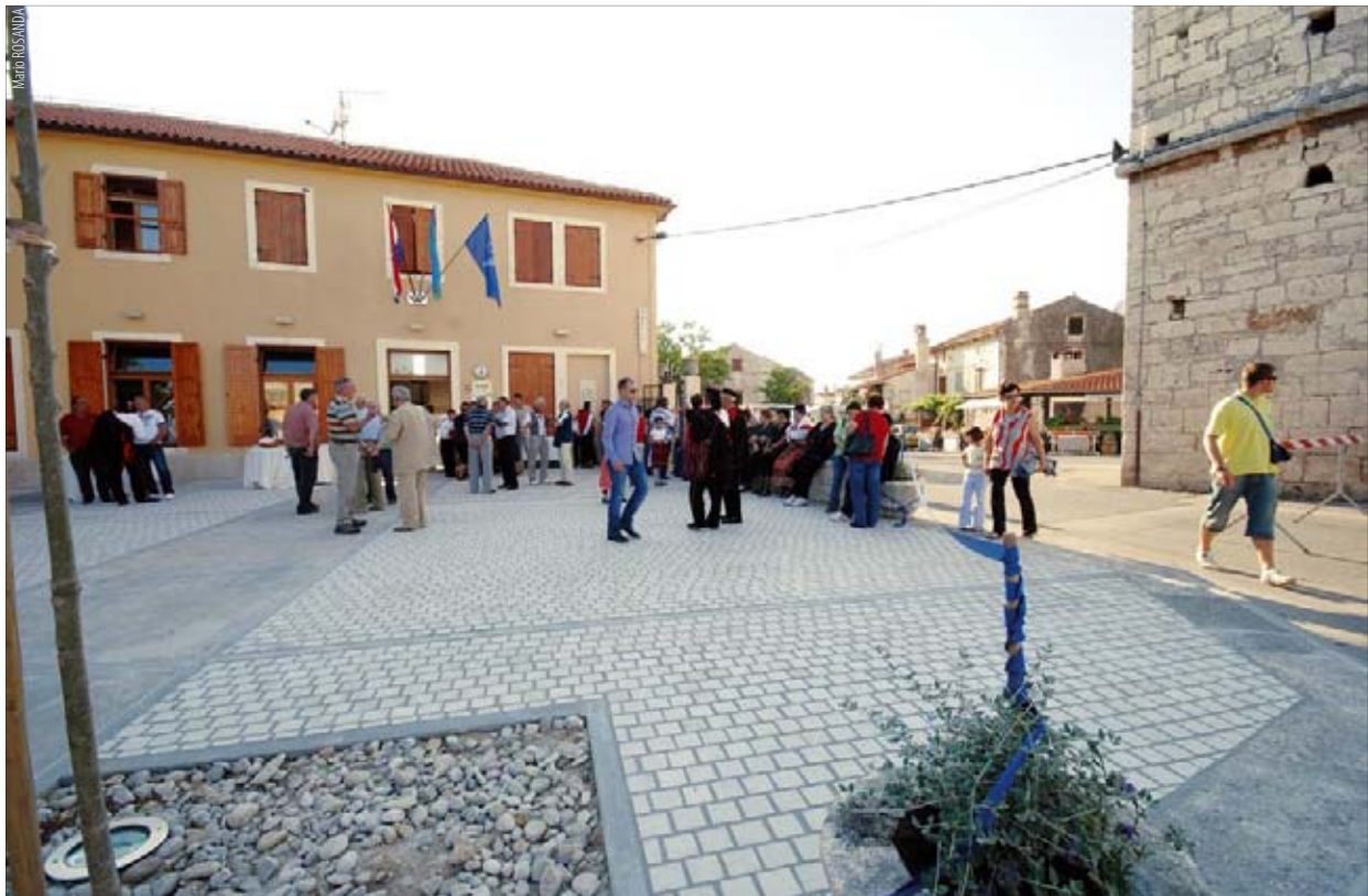
Stara škola u premanturi

mora i priobalja te obnovljivih izvora energije. Također, Općina Medulin će prijaviti projekt uređenja medulinske Lože na natječaj regije Veneto, kojim se omogućuje financiranje, između ostalog, i aktivnosti obnove i