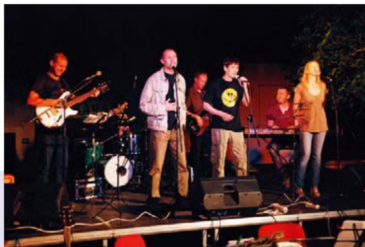
Prvi koncert domaće grupe Sakramenski