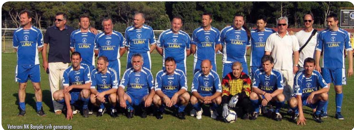
Veterani NK Banjole svih generacija