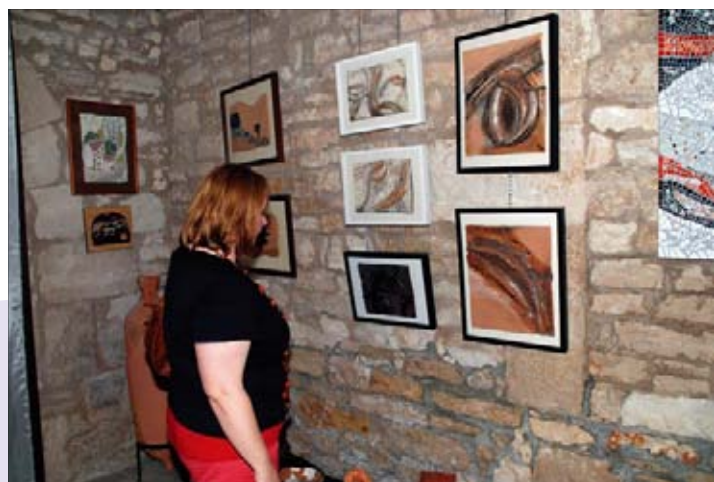
Izložba mozaika i keramike Udruge za poticanje stvaralaštva Art studio iz Pule, u galeriji Loža

Istoga dana je u večernjim satima otvorena izložba mozaika