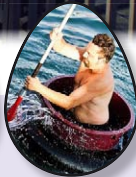
JADRANSKE IGRE str. 27