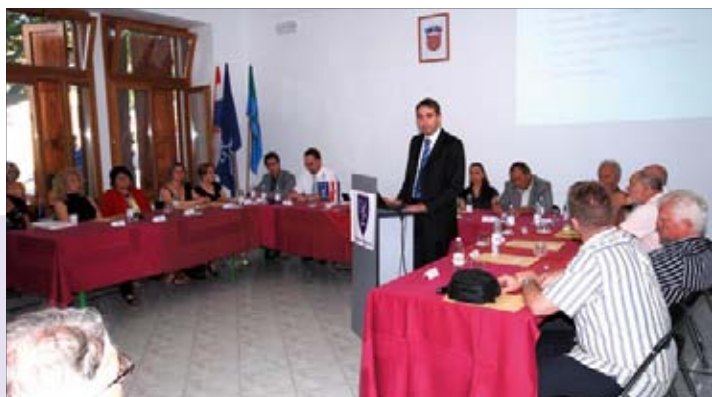
Općinsko vijeće Medulina na 21. svečanoj sjednici u Premanturi