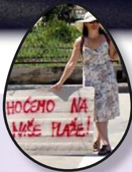
SLUČAJ "ARENATURIST" str. 2-5