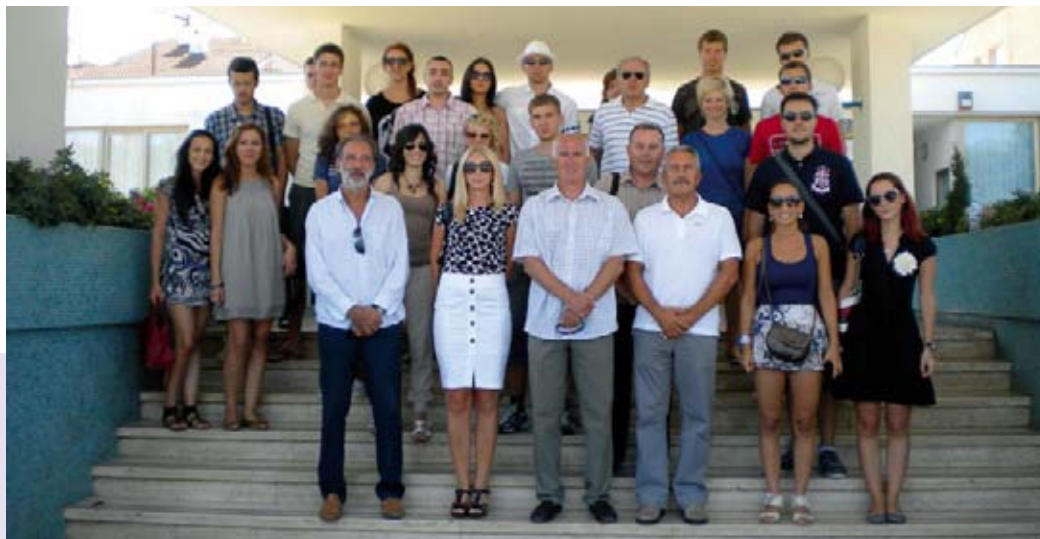
Zajednička fotografija polaznika škole i predavača

Rezultate istraživanja potreba i interesa mladih koje smo proveli tijekom siječnja i veljače možemo sažeti u nekoliko zaključaka. Anketu je ispunilo 140 osoba, a najveći problemi su nedostatak sadržaja za mlade, nedostatak prostora za okupljanje tijekom cijele godine te nedostatak sportskih objekata.