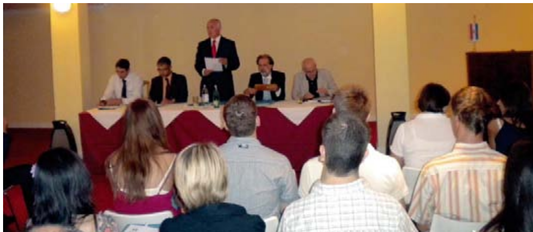
S otvorenja ljetne škole politološkog studija u hotelu Belvedere