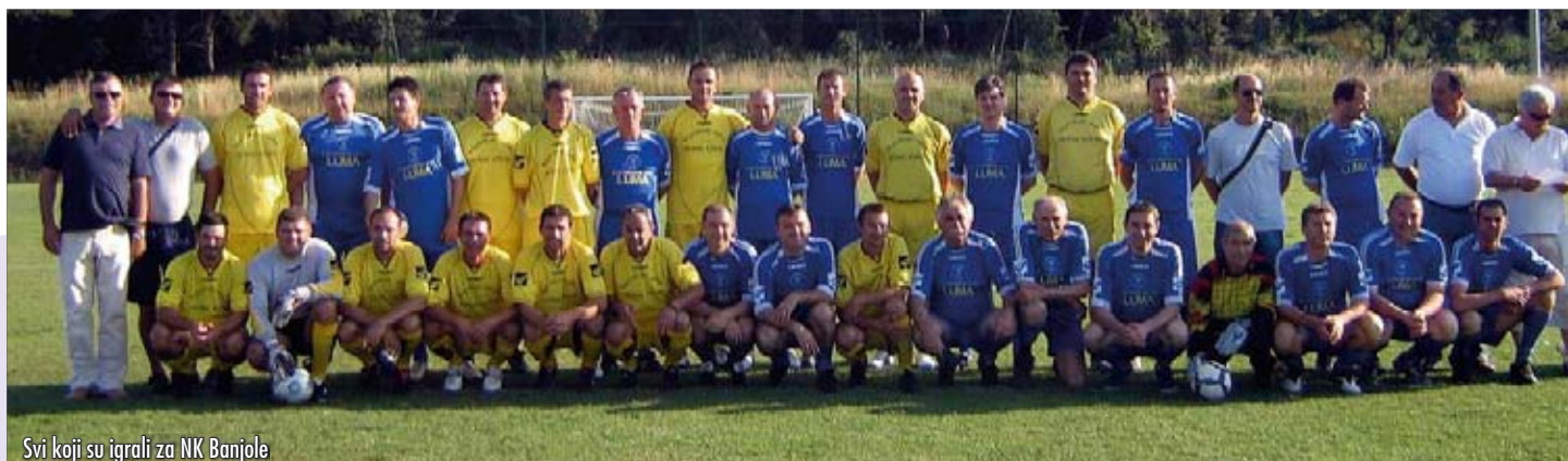
Svi koji su igrali za NK Banjole