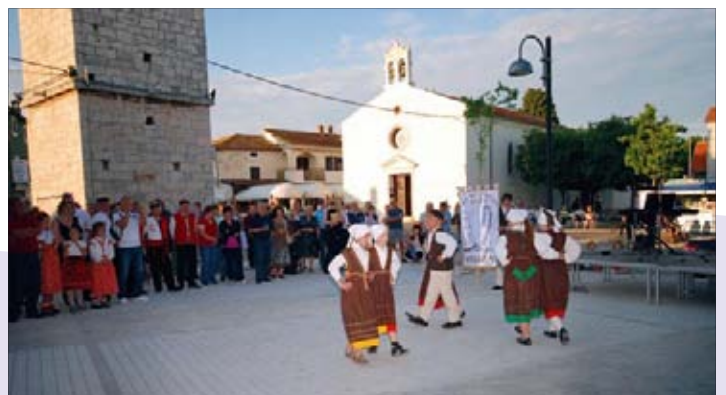
DKUS Mendula sa svojim folklornim programom