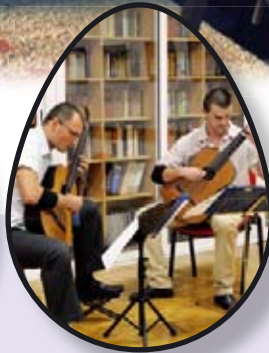
VINKURAN ART str. 15