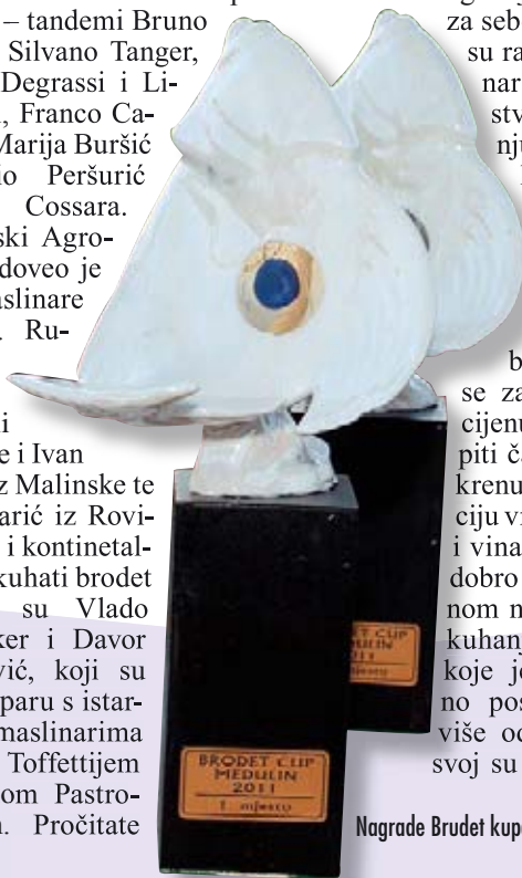
Nagrade Brodet kupa