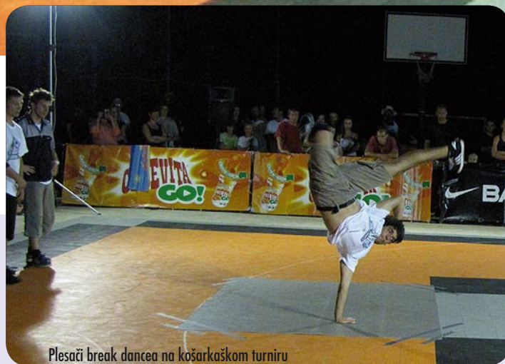
Plesači break dancea na košarkaškom turniru

najviše natjecatelja, a pobjeđuje najprecizniji. Pobjednik osvaja košarkašku loptu. Cede vita go! natjecanje u zakucavanjima je natjecanje u kojem do izražaja dolaze fizičke predispozicije i mašta, a prijavljuju se atletski najsposobniji igrači. Zakucavanja ocjenjuje tročlani žiri ocjenama od 1 do 5. Košarkaški poligon Kymco moj 1. koš oduševljava najmlađe, koji u velikom broju sudjeluju na turnirima. Svaki natjecatelj mora proći poligon, a od vremena po-