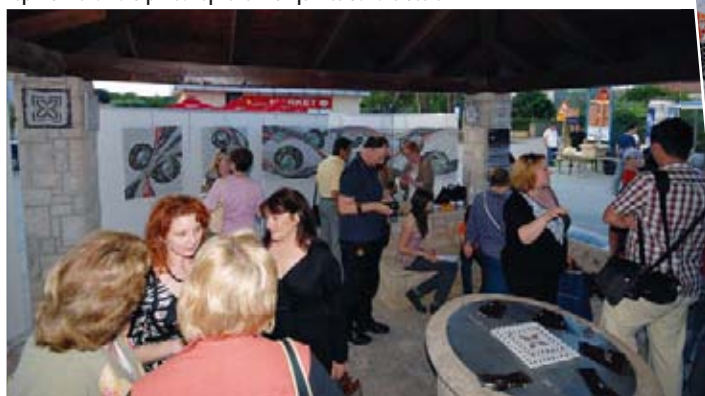
Izložba vikend-radionice izrade mozaika oko pomerskog bunara