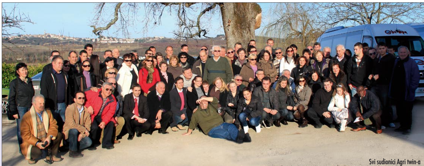
Svi sudionici Agri twin-a