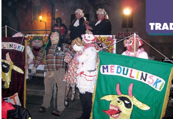
Šentenca na medulinskoj placi