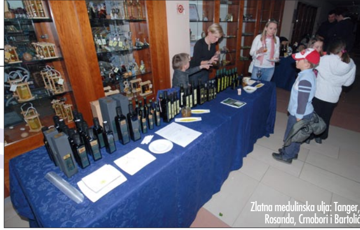
Zlatna medulinska ulja: Tanger, Rosanda, Crnbori i Bartolić

A KREĆE U OSVAJANJE HRVATSKOG I EUROPSKOG TRŽIŠTA