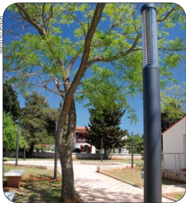
Rasvjeta u dvorištu vinkuranske škole

ulaganje izvršeno je u izgradnju vodovodne mreže Ližnjanska Mukalba (1. faza) 2,2 milijuna kuna. Izgrađena je fekalna i oborinska kanalizacija od ulice Sad do Ližnjanske, fekalna kanalizacija u ulici Munida, fekalna i oborinska kanalizacija od crkve do starog vrtića u Medulinu sveukupno 1,4 milijuna kuna, dok je u sekundarnu mrežu uloženo 332.000 kuna. U otkup zemljišta za izgradnju prometnica u posljednjih šest mjeseci prošle godine uloženo je 1,8 milijuna kuna, na izgradnju 1. faze ceste na Paredinama 370.000 kn, 573.000 kn na izgradnju vertikale Burle te 235.000 kn na cestu Nova Lokva. Cijelu proteklu godinu obilježila je gradnja dječjeg vrtića, te je u drugoj polovini godine