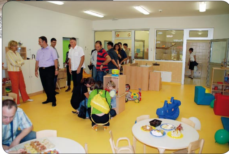
Otvorenje novog vrtića u Medulinu

Također, Općina i dalje plaća prijevoz učenika područne škole u