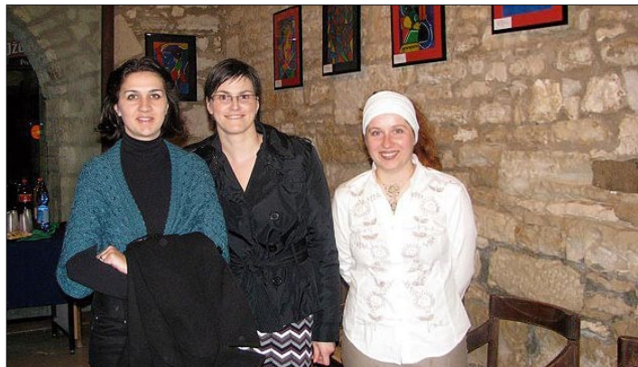
Aktivistice udruge MedulinArt