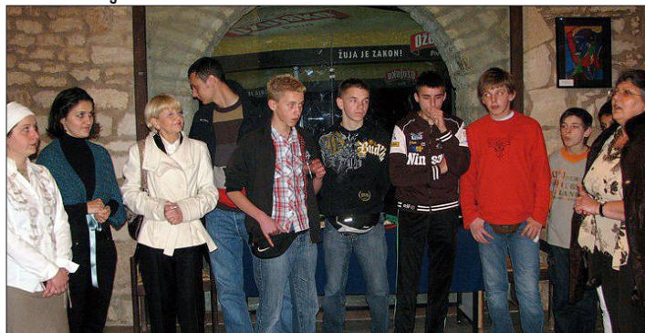
S jednog od predavanja u medulinskoj Loži