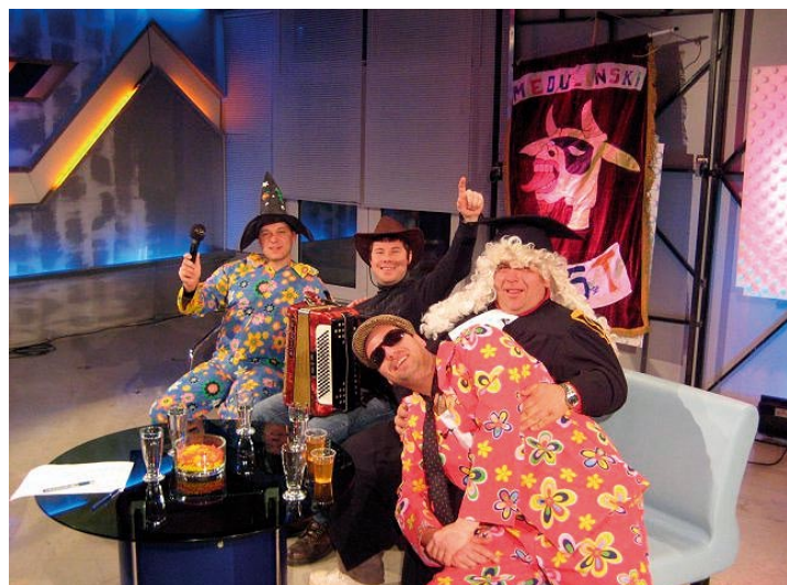
Medulinske maškare na TV Novi