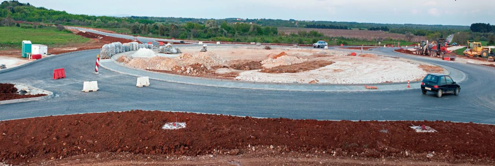
Kružni tok na Campanožu

- Dobra cestovna povezanost je oduvijek bila preduvjet za gospodarski razvoj, što znači da će i naša općina i njeni mještani već od ove godine imati odličnu podlogu za gospodarski rast. Radilo se o razvoju turizma, privatnog, hotelskog i kamp smještaja kao i razvoju dodatne ponude putem jačanja ugostiteljskih i zabavnih sadržaja, poticanju malog i srednjeg poduzetništva i obrta, izgradnji trgovačkih centara i popratnih sadržaja, revitalizaciji tržišta nekretnina, nova priključna cesta nam donosi niz prednosti. Zahvalio bih se tvrtki Bina Istra, Bouyges i svim podizvođačima na velikom zalaganju u izgradnji pristupne ceste i na suradnji s mjesnim odborima, školom Banjole i mještanima općenito. Zahvalio bih i Hrvatskim autocestama, Uredu državne uprave u Puli na brzom na efikasnom riješavanju imovinsko-pravnih odnosa na trasi, kao i Ministarstvu mora prometa i infrastrukture i Istarskoj županiji na podršci u provođenju projekta. Posebno bih se zahvalio i članovima poglavarstva (čiji sam bio predsjednik) iz mojeg prethodnog mandata bez kojih pomerska zaobilaznica ne bi bila uvrštena u projekt izgradnje pristupne ceste Pomer - Peličeti. Time je općina Medulin dobila dodatni infrastrukturni objekt - zaobilaznicu vrijednu više od 15 milijuna kuna, a sve o trošku Koncesionara i Vlade RH, istaknuo je načelnik Goran Buić.