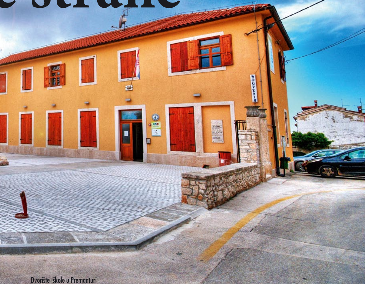
Dvorište škole u Premanturi

projekt sportske zone Pomer, koji će biti temelj za daljnje ishodište odobrenja za gradnju te za uređivanje imovinsko pravnih odnosa. Dobivena je i lokacijska dozvola za nogostup na ulasku u Pomer te je u tijeku izrada i provedba parcelacijskog elaborata nakon čega će se moći krenuti u otkup zemljišta.