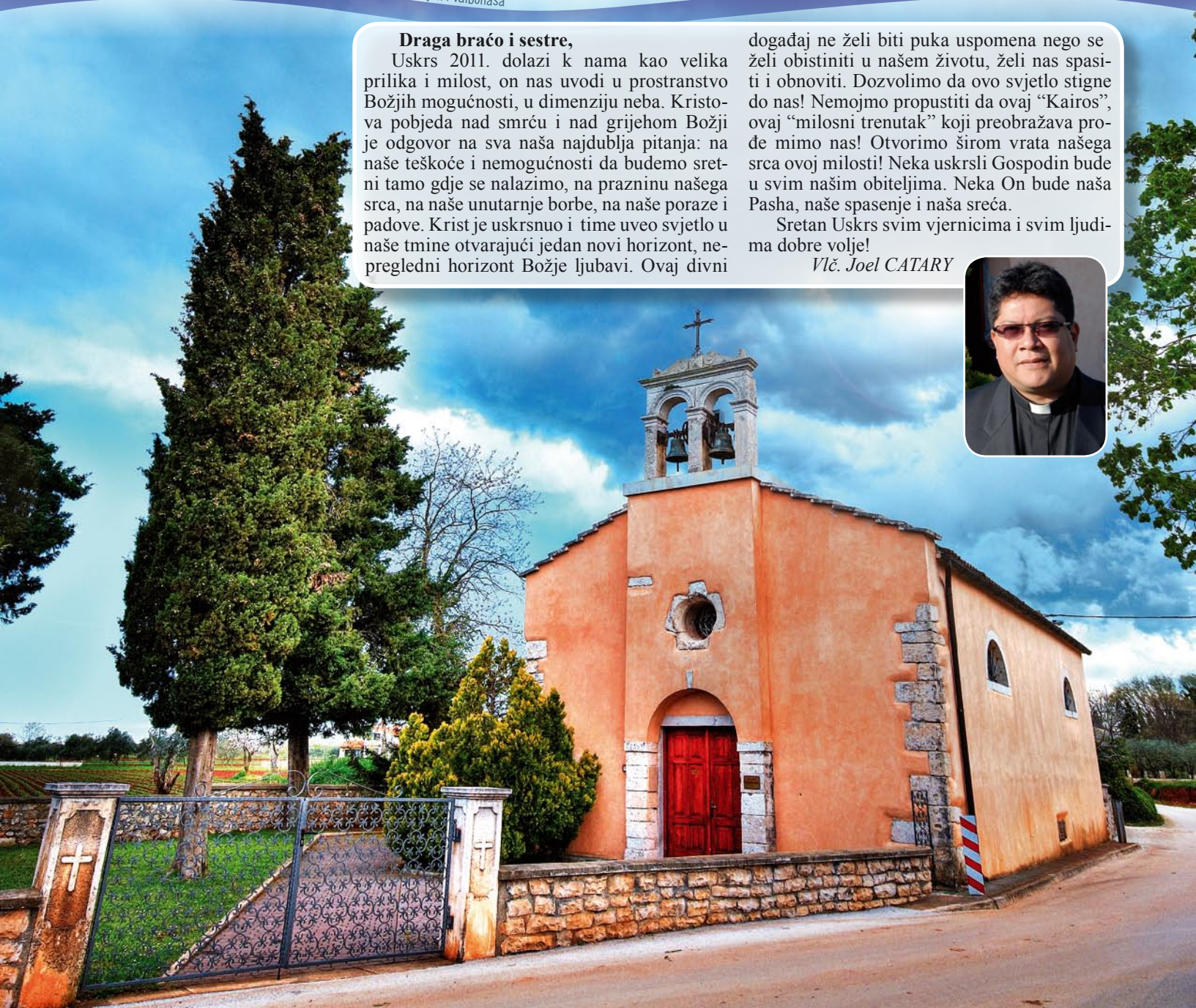
Župna crkva Blažene Djevice Marije