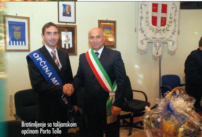
Bratimljenje sa talijanskom općinom Porto Tolle

godišnji obračun Proračuna za 2009. godinu, Izrađene su izmjene i dopune Odluke o izvršenju Proračuna za 2010. g., te izmjene i dopune Proračuna za 2010.g., također je izrađen izvještaj o obavljenom uvidu u proračunski i financijski izvještaj za 2009. g. Vođene su poslovne knjige i izrađeni financijski izvještaji za JU Kamenjak, Predškolsku ustanovu Dječji vrtići Medulin, nogometni klub Banjole i Medulin,