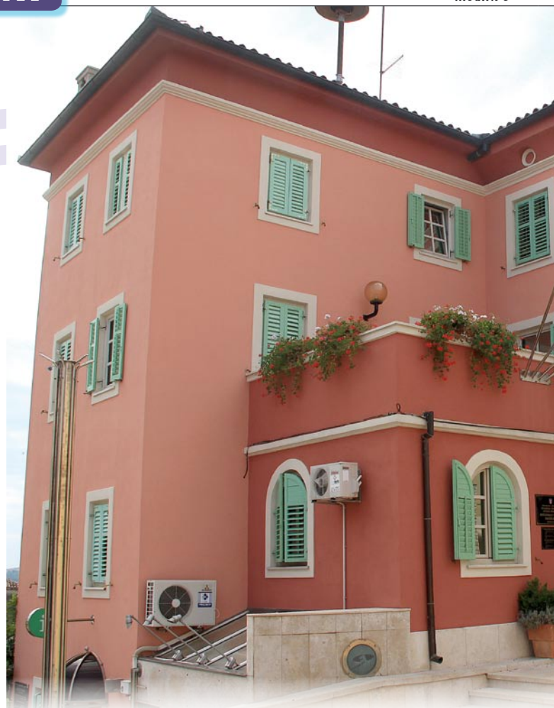
Ustrojena četiri nova općinska odjela

Područje zdravstva i socijalne skrbi, definitivno obilježava socijalni program koji je jedan od boljih na ovim područjima. Upravo, kad su ovako teška financijska vremena, taj je program neophodan kako bi kroz njega pomogli našim mještanima. Socijalno vijeće održalo je dvije sjednice socijalnog vijeća, na kojima je dodijeljeno 93 jednokratne novčane pomoći (u ukupnom iznosu od 68.443,02 kn), pet pomoći za participaciju pogrebnih troškova (u ukupnom iznosu od 5.000 kn), 147 božićnica kao pomoć socijalno ugroženi-