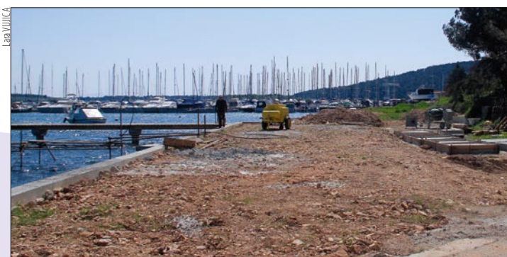
Lučica Puč Pomer