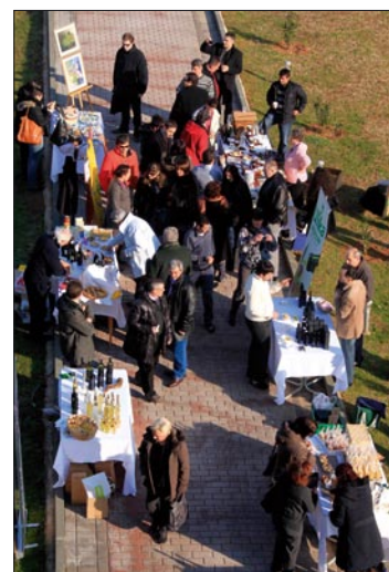
Sudionici su predstavili svoje proizvode

U četiri dana, koliko je trajao prvi susret i boravak sudionika iz partnerskih općina u Medulinu, strani i domaći gosti prisustvovali su predavanjima