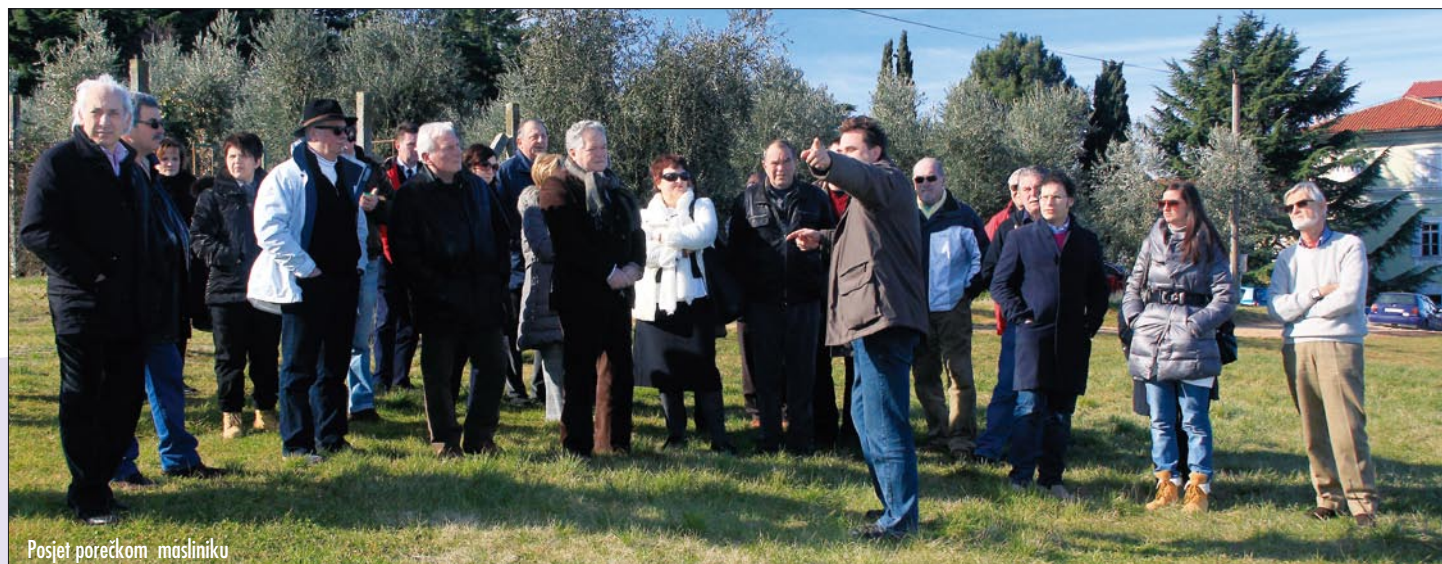
Posjet porečkom masliniku

Udruga A. Bartola, koja sa strane talijanskog partnera Općine Montecarotto surađuje na našem projektu, predstaviti će on-line E-learning tečaj o Europskoj poljoprivrednoj politici koji će zahvaljujući AGRI-TWIN projektu biti dostupan svim zainteresiranim osobama sa strane svih uključenih projektnih partnera. Također, tijekom boravka u Montecarottu, upoznat ćemo Europsku politiku ruralnog razvoja (RDP), s naglaskom na mogućnostima koje ona pruža i konkretnim iskustvima u već realiziranim projektima financiranim sredstvima iz tog programa, koja će naši talijanski AGRI-TWIN partneri, kao partneri iz zemlje članice EU, podijeliti sa svim ostalim partnerima.