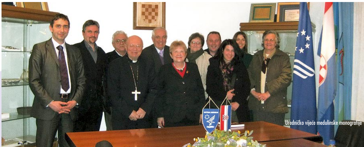
Uredničko vijeće medulinske monografije