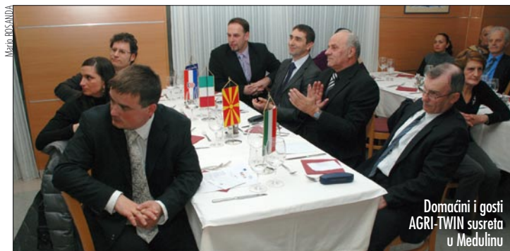
Domaćini i gosti AGRI-TWIN susreta u Medulinu

U studenom je objavljen javni natječaj za prijem jednog vještbenika i jednog višeg stručnog suradnika za društvene djelatnosti. Natječaj je okončan kra-