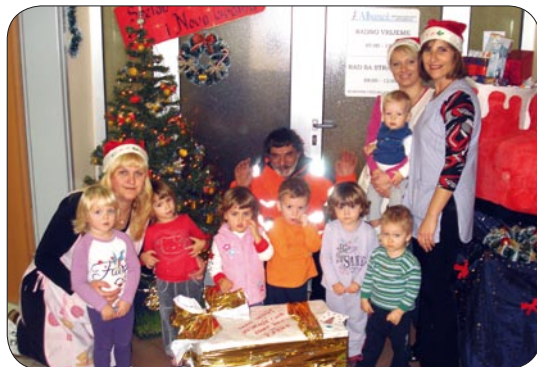
Božić u pomerskim jasticama