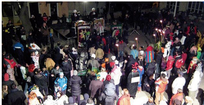
Spaljivanje pusta na medulinskoj placi

Rječani su pokupili maškare od nas - našalio se jednom prilikom tajnik DKUS-a Mendula Mladen Sacco. Ipak, ova šala ima smisla jer maškare u Medulinu imaju najdužu tradiciju na području Istre. Kroz mnoga kulturno-umjetnička društva maškare u Medulinu djeluju od početka proteklog stoljeća, a od 2008. godine postoji i udruga „Medulinske maškare“ čiji se članovi okupljaju već ujesen, kada i počinju prve pripreme za organizaciju Pusta. Unatoč tome, medulinskim maškarama nije uvijek bilo lako o čemu nam priča predsjednik udruge Simeone Ukotić-Šime, koji u maškarama aktivno sudjeluje proteklih dvadesetak godina. Govoreći o povijesti medulinskih maškara, Simeone Ukotić napominje kako nema podata-