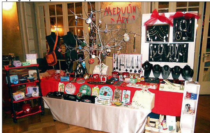
Izložba uardaka članova MedulinArt

nička izložba Dom – Art-a i MedulinArt-a u Loži u Medulinu. Na kratko smo se družili s radovima djece iz doma iz Pule. Njihove slike izrađene u pastelu su duže vrijeme oplemenjivale prostor Lože i oživljavale Placu. Tijekom ljeta naši članovi su izlagali na Ex tempore u Bujama, Novigradu, Vodnjanu, Pazi-