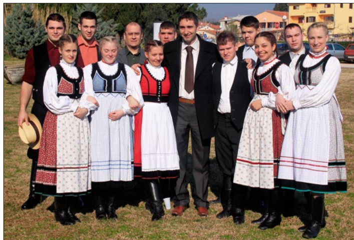
Mađari u narodnim nošnjama

Sljedeći susret AGRI-TWIN projektnih partnera biti će u Općini Montecarotto u Italiji od 30. lipnja 3. srpnja ove godine. Kroz ta četiri dana nastaviti ćemo druženje započeto