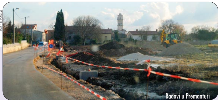
Radovi u Premanturi

Velika kapitalna investicija realizirana u novom vrtiću, rezultirala je i velikom stavkom od 970.000 kn za opremanje samog objekta. Novi vrtić ima kapacitet za šest grupa, a od 1. rujna 2010. krenulo je sa radom pet grupa, stoga je zaposleno 11 novih djelatnika (6 odgojiteljica, 1 domar, 1 spremačica i 1 tajnica), od njih dvoje na pola radnog vremena. Analizom broja predškolske djece koju su napravile općinske