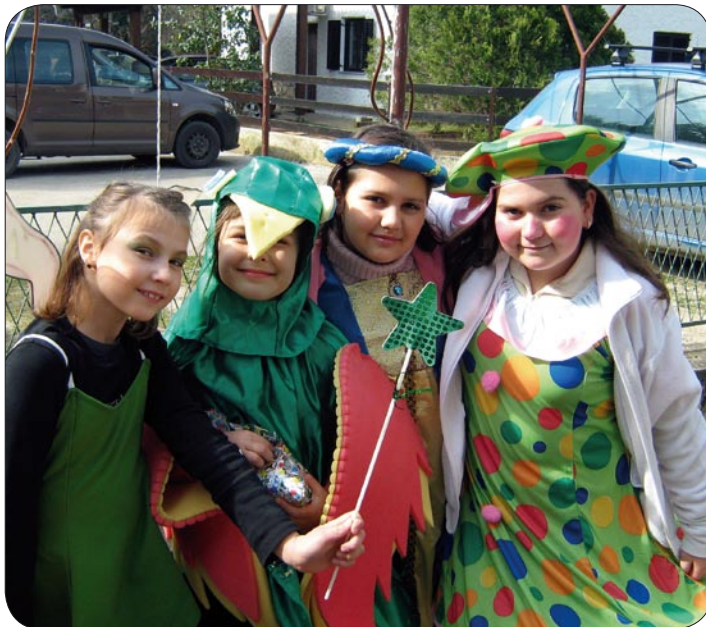
Novi naraštaji banjolskih krabulja