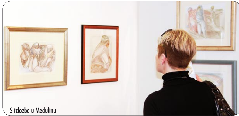
S izložbe u Medulinu

napravio portrete Michelangela, Rafaela, i s tim crtežima sam otišao 1957. godine na prijemni u Zagreb. Kada su vidjeli crteže, primili su me odmah, bez da sam išao na prijemni, koji je trajao tri dana. I eto, to je bio prvi kontakt i početak, u kojem sam se konačno opredijelio za novi, budući život. Tamo sam (na četvrtoj godini) bio konačno slobodan. Jer, radio sam grafike koje su dolazile iz moje