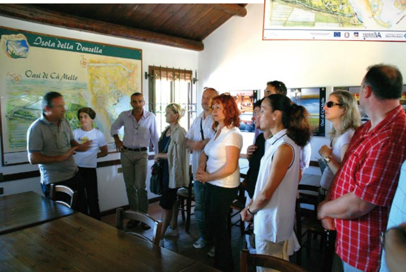
Isola della Donzella - Oasi di Ca'Mello