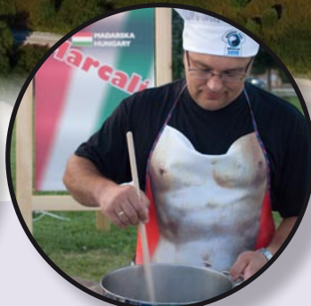
Brudet Kup str. 15