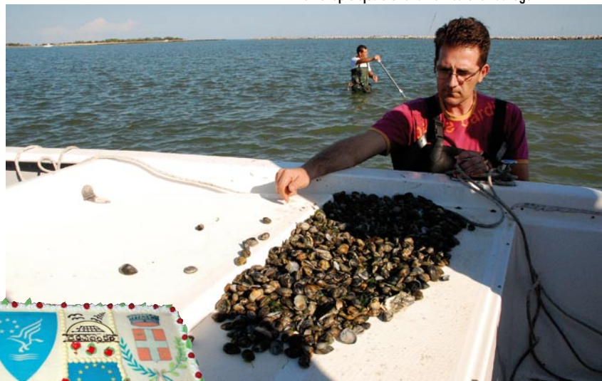
Ovako se školjke vade u Porto Tolle