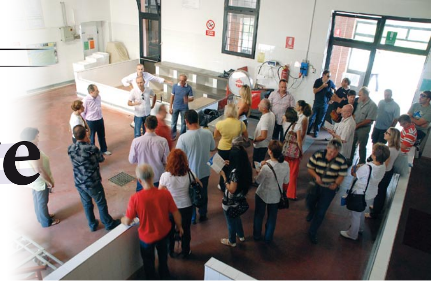
Veletržnica u Porto Tolle