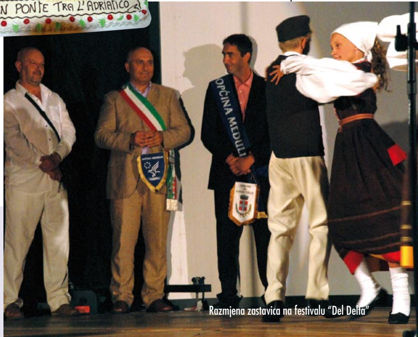
Razmjena zastavica na festivalu "Del Delta"