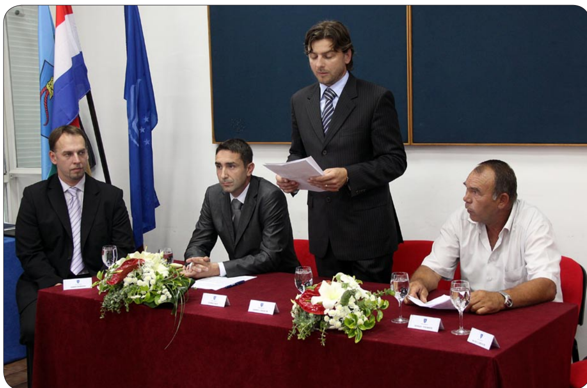
Sa svečane sjednice općinskog vijeća

U subotu je cijelog dana trajala pustolovna utrka kroz općinu. Natje-