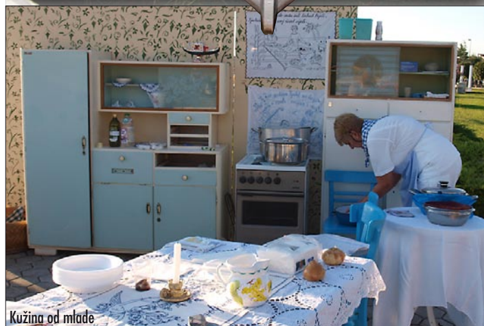
Kužina od mlade