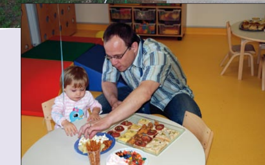
Mnoštvo Medulinaca na svečanosti