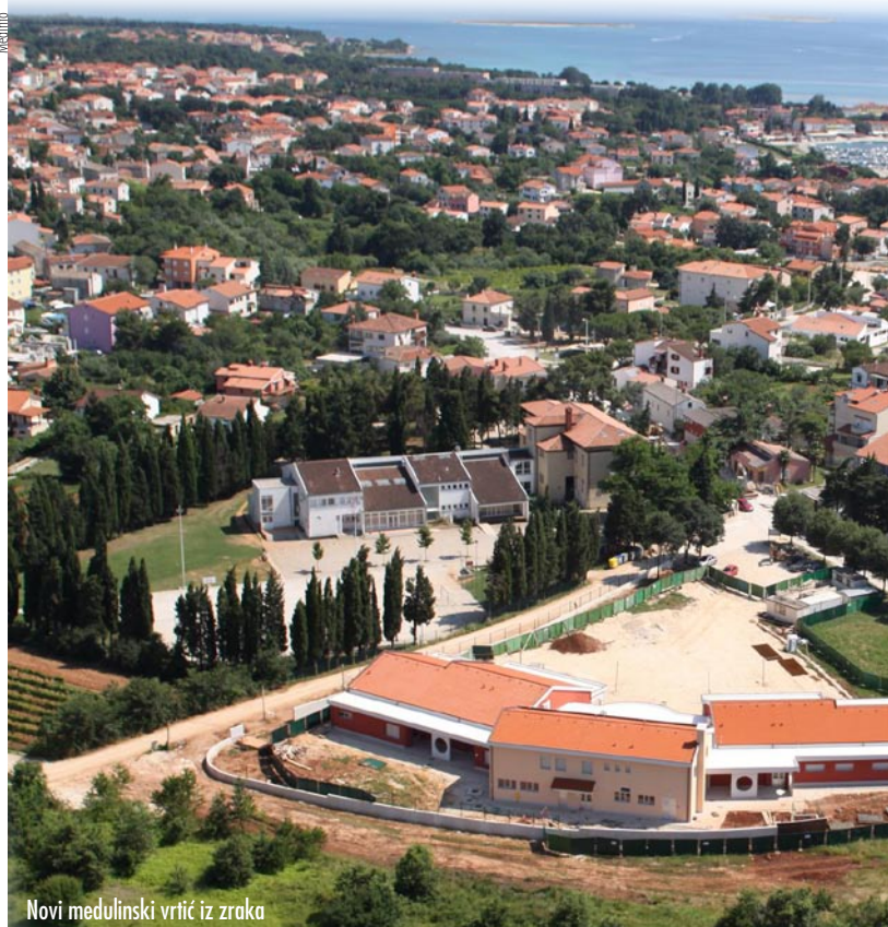
Novi medulinski vrtić iz zraka

Kao što je i načelnik Općine Medulin Goran Buić najavljavao, dana 1. rujna 2010. otvoren je novi vrtić u Medulinu. Na prostoru površine ukupno 3.755 četvornih metara prostire se zgrada dječjeg vrtića, na 1.325 kvadrata, te dvorište od 2.430 kvadrata. Vrtić je namijenjen za 120 djece, odnosno šest skupina: dvije jasličke, jednu međuskupinu te tri vrtičke. U vrtiću će raditi 20-ak djelatnika i to 10 odgajateljica, psiholog, pedagog, domar, spremačice, kuhar i pomoćna kuharica. Općina Medulin je uložila mnogo entuzijazma, truda i financijskih sredstava da bi se novi vrtić danas otvorio. Otkupljeno je zemljište za vrtić i prometnicu (7.510 kvadrata), što je stajalo 7.022.235,15 kuna, izrada idejnog projekta koštala je 268.400 kuna, a izgradnja vrtića 11.103.950,39 kuna. Ostali troškovi (nadzor, vodni doprinosi, priključci, geodeti, koordinator i sl.) iznose 370.875,40 kuna, dakle sveukupno je za vrtić trebalo izdvojiti 18.765.460,94 kune. Prije