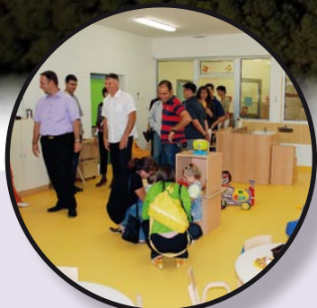
Novi medulinski vrtić str. 6 i 7