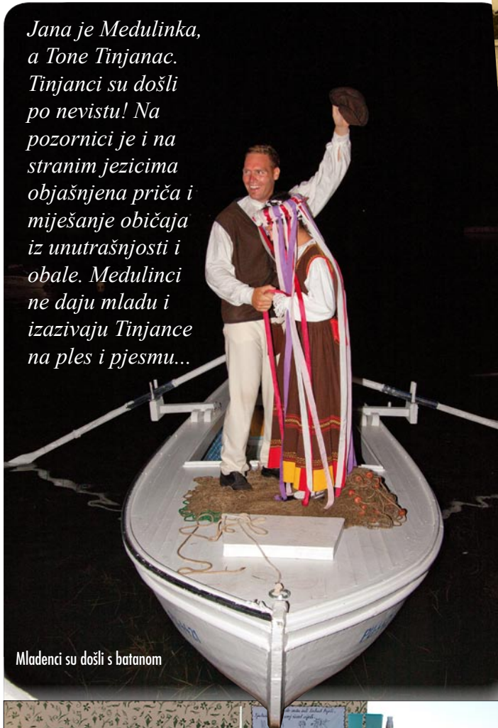
Mladenci su došli s batanom