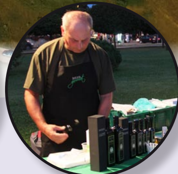
Mjesne fešte str. 16