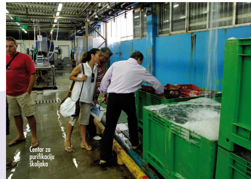
Centar za purifikaciju školjaka