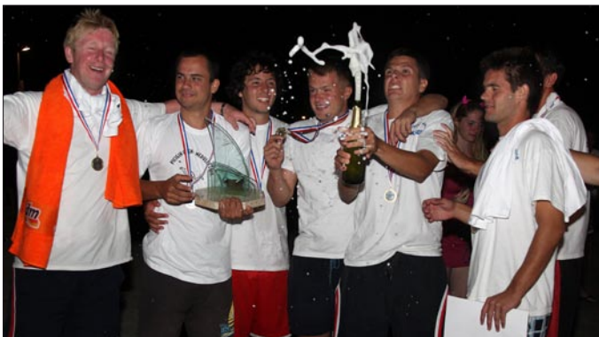
Slavlje nakon pobjede

Dvije ljetne subote, 17. srpnja i 21. kolovoza na plaži Bijeca u Medulinu bile su termini u kojima je Udruga za promicanje igre picigin - Pešekan organizirala svoja dva već tradicionalna natjecanja u piciginu: Pešekan cup 2010. i Picigin Open – Medulin 2010.