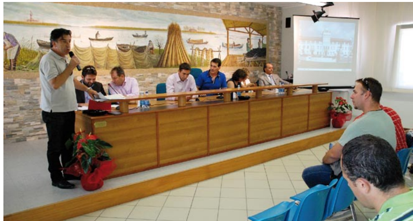
Workshop u sjedištu lokalne ribarske zadruge