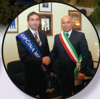
Bratimili se Medulin i Porto Tolle str. 12 i 13