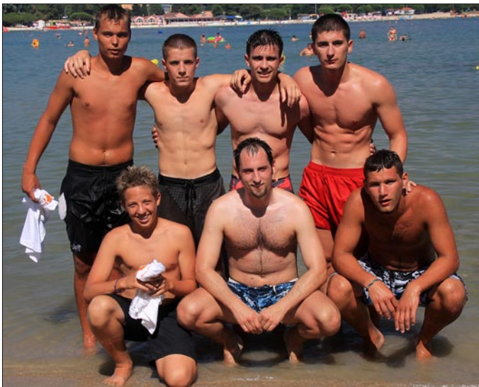
Zlatna ekipa Picigina