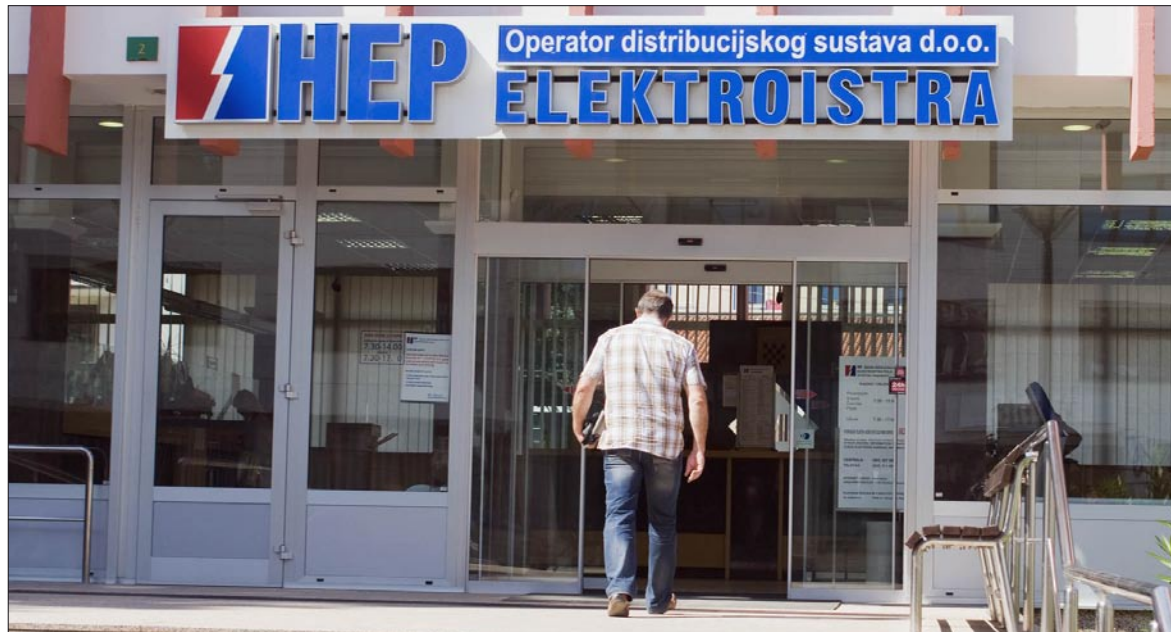
HEP planira značajna ulaganja u našoj općini

- Južni dio Istre napaja se iz trafostanice napona 110 kilovolti u Dolinki. Odatle struju crpe potrošači iz medulinske i ližnjanske općine, skroz do Valture. Iz Dolinke se strujom napaja i trafostanica u Banjolama, iz koje se električna energija prosljeđuje do svih naselja naše općine. Danas je opterećenje trafostanice Banjole dostiglo 15 megavata, što znači da je ona već preopterećena i krajnje je vrijeme da se izgradi trafostanica Medulin, napona 110/20 kilovolti. Po našim studijama, ova trafostanica na Libori je već trebala biti izgrađena. Nadamo se da ćemo do konca 2011. godine biti gotovi s dokumentacijom, ne bi li ona do 2012. bila izgrađena. To će pogotovo biti potrebno zato što su najavljeni novi potrošači, kao što je golf resort u Ližnjanu, koji treba tri megavata snage, pročistač fekalija na Marleri, Kaštijun i drugi, što ukupno iziskuje dodatnih 10