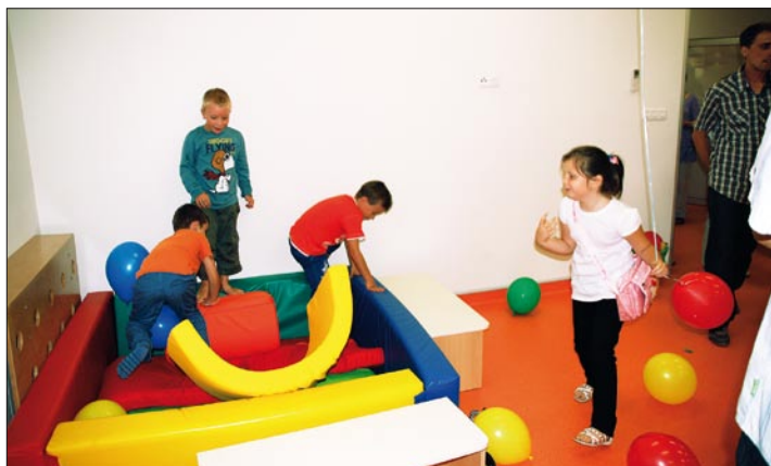
Najmlađi su se ipak najviše veselili