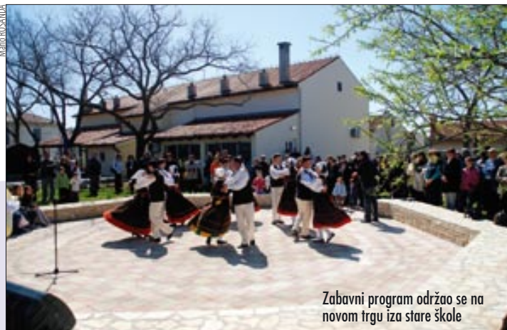
Zabavni program održao se na novom trgu iza stare škole

Na otvorenju knjižnice rečeno je da bi ona trebala postati matična knjižnica i čitaonica medulinske općine, u kojoj bi se mogle pročitati dnevne novine, tjednici, mjesečnici i sve knjige s polica.