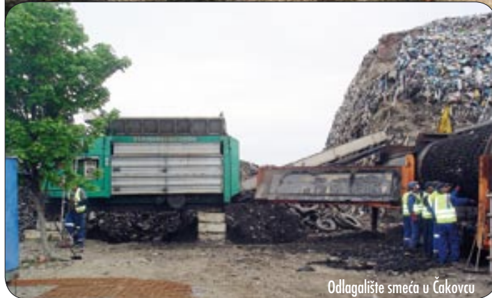
Selektivno prikupljanje otpada u Čakovcu