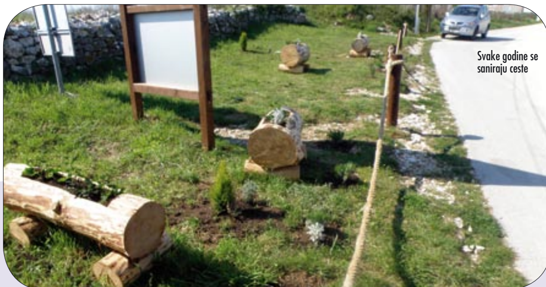
Svake godine se saniraju ceste