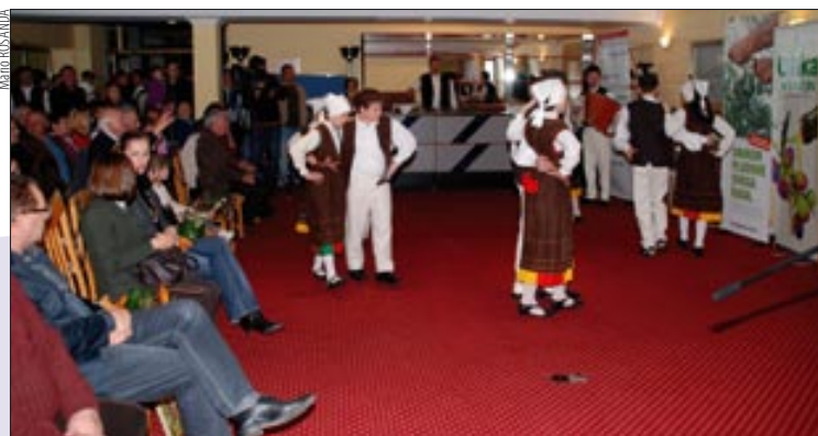
Folklorni ansambl DKUS-a Mendula iz Medulina

- Naime, mnogi bi željeli povećati nasade, no država nikako da ovaj problem riješi. Godišnje nabavljamo oko 2.000 sadnica, što je malo, jer se nemamo gdje širiti. Sada naši maslinari imaju ukupno između 55 i 60 tisuća stabala maslina, kaže Tanger.