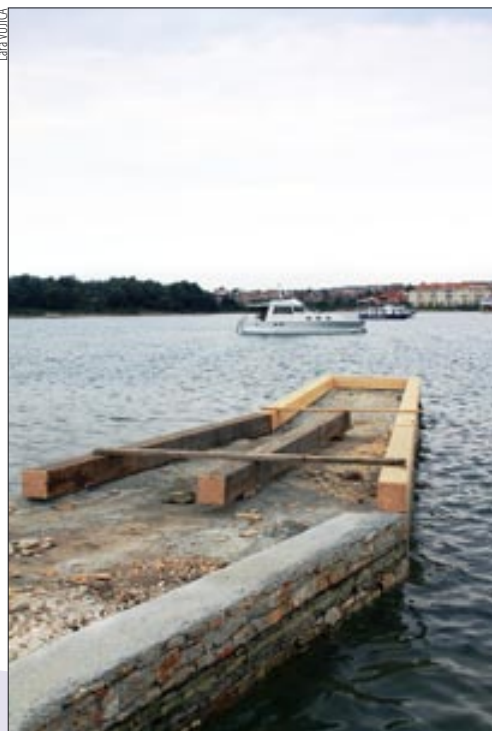
Sanacija molova je neophodna