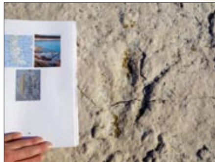
Vrijedni ostaci koje treba sačuvati

Ove godine uredit će se mali sportski plato na Školjiću, gdje će se izgraditi igrališta za odbojku i ostale sportove s loptom, ne bismo li potaknuli rekreativne aktivnosti uz more. U tijeku je nabava dva montažna objekta za suvenirnicu i info-punkt, a jedan objekt postavio bi se u Medulinu, u park-šumi Kašteja