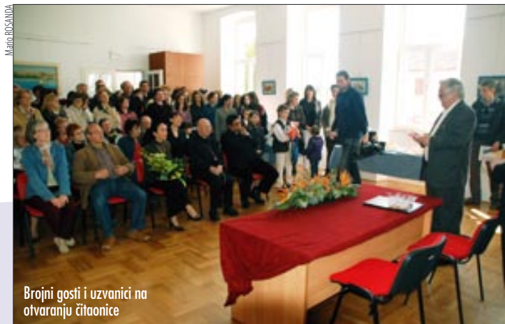
Brojni gosti i uzvanici na otvaranju čitaonice