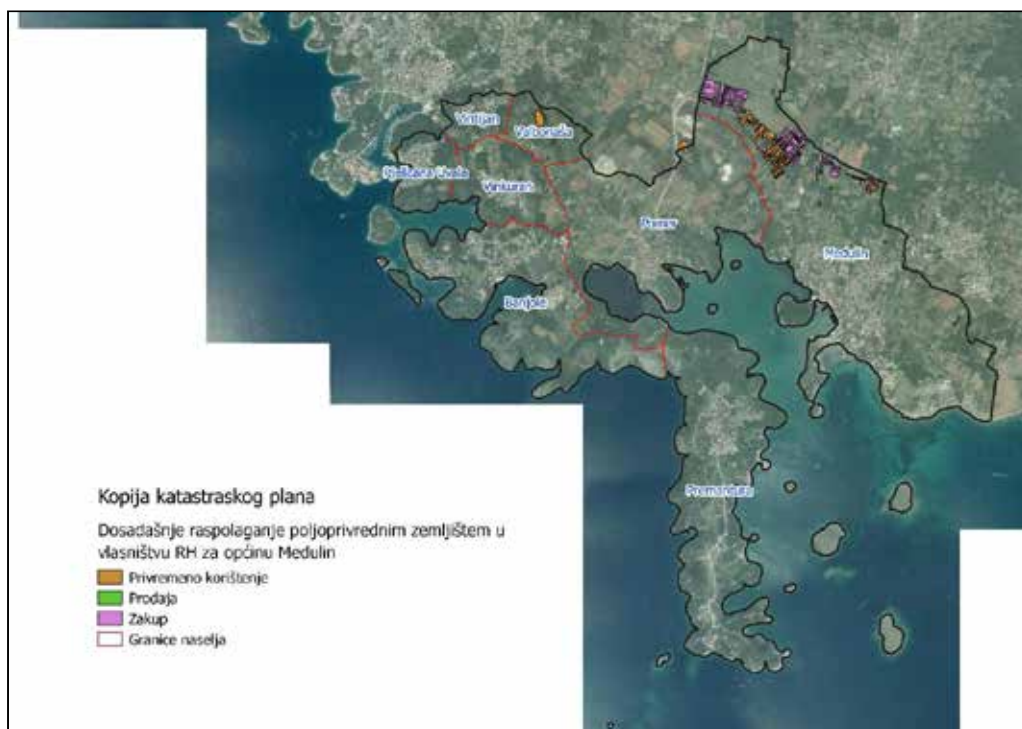
Slika 4: Prikaz dosadašnjeg raspolaganja poljoprivrednim zemljištem u vlasništvu RH