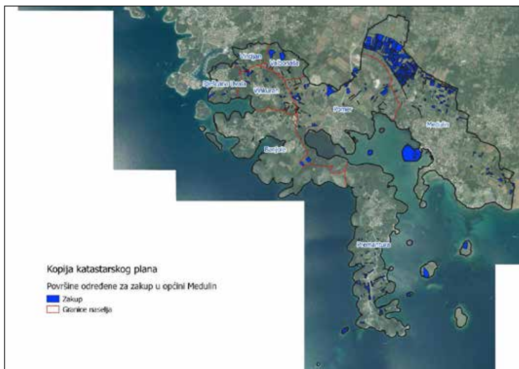
Slika 5: Površine određene za davanje u zakup

Od sveukupne navedene površine 148,1479 hektara ne nalazi se pod niti jednim oblikom raspolaganja kako je prikazano po katastarskim općinama u tablici 1, a čiji umanjeni prikaz možemo vidjeti na slici 6.