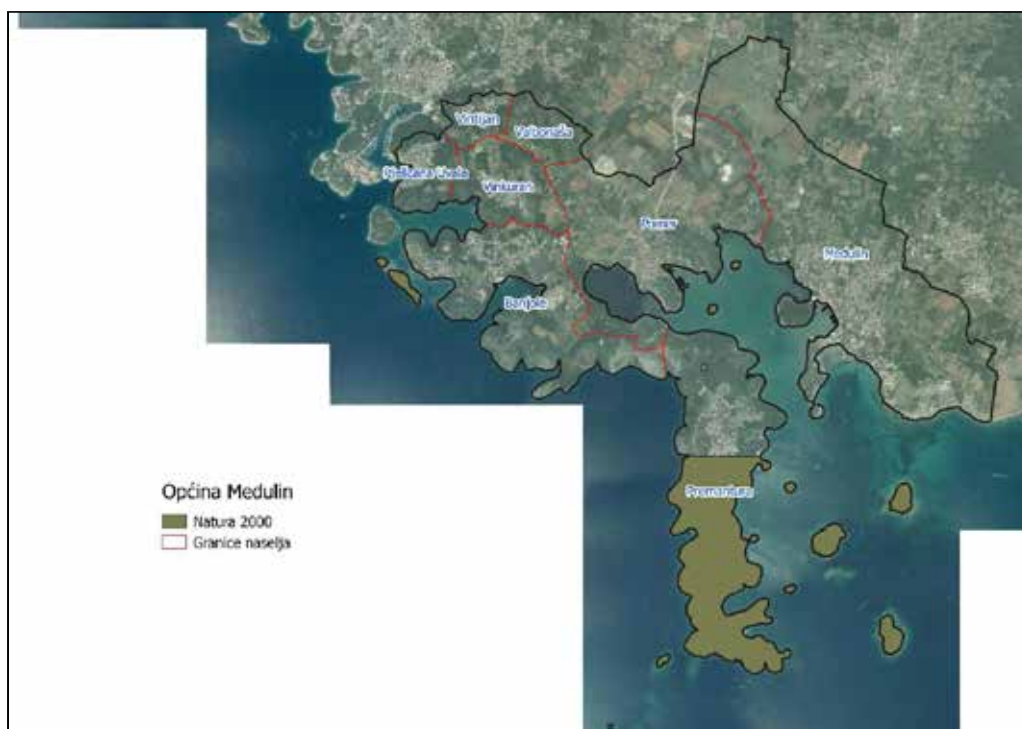
Slika 3: Zaštićena područja (Natura 2000)