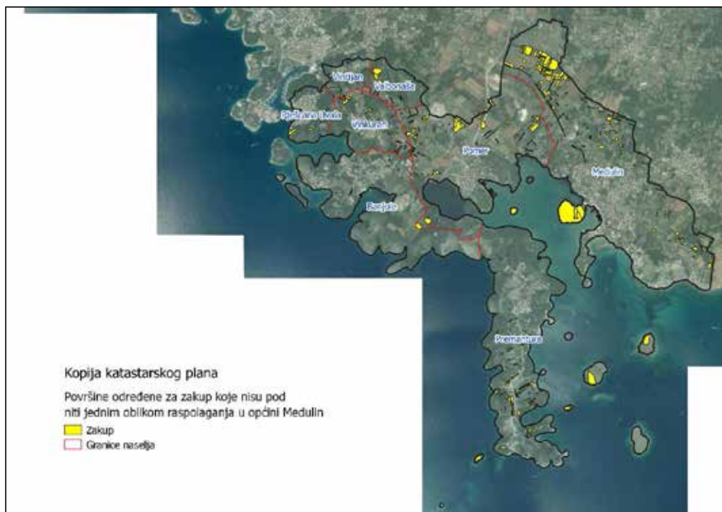
Slika 6: Površine određene za davanje u zakup koje nisu pod niti jednim oblikom raspolaganja, Izvor: Državna geodetska uprava, općina Medulin - obrada autora